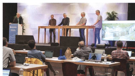
Die verschiedenen Vorträge und die Podiumsdiskussion mit den Teilnehmenden der filmischen Exkursion stiessen auf grosses Interesse.