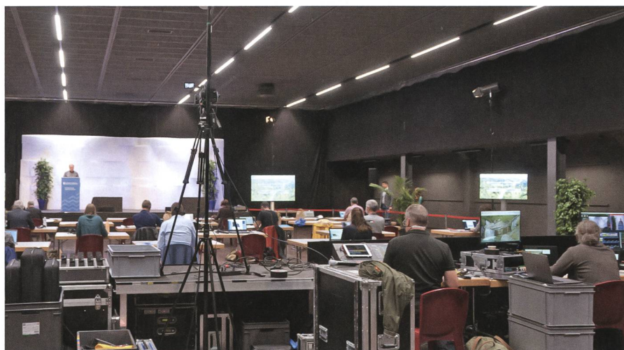
Blick auf die KOHS-Tagung aus Sicht der Regie.

Den Organisatoren seitens KOHS war es wichtig, dass die virtuelle Veranstaltung auch Möglichkeiten für die Vernetzung, für Fragen und Diskussionen und den Austausch neben den reinen Fachreferaten geboten hat. Für die technische Durchführung der Tagung wurde daher eine professionelle Firma, die OnStage Showtechnik GmbH aus Pfäffikon SZ, beauftragt. Die Veranstaltung in Thun wurde durch OnStage live gefilmt, für das Internet produziert und per Live-Streaming/Webcast an die Teilnehmenden übermittelt. Über die Chat-Funktionen konnten die Teilnehmenden Fragen den Referierenden zukommen lassen. In virtuellen Pausenräumen bestand zudem die Möglichkeit, mit den Referierenden für vertiefte Fragen und Diskussionen rund um den Vortrag in Kontakt zu treten.