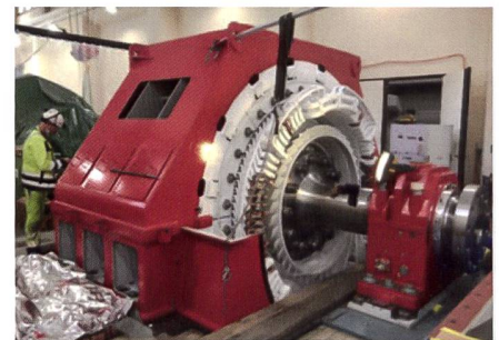
Montage d'un nouvel alternateur à Mottec.