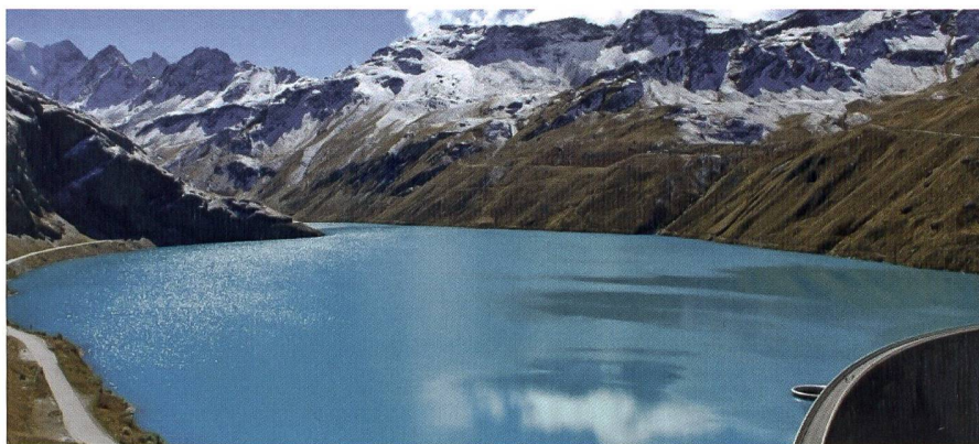
Barrage de Moiry.

Les centrales de Mottec et de Vissoie, situées dans le Val d'Anniviers, sont en cours de modernisation. Les machines actuelles fonctionnent depuis plus de 60 ans. Vingt années avant l'échéance des concessions, les Forces Motrices de la Gougra SA ont décidé d'investir 67 millions de CHF pour donner une nouvelle vie aux trois groupes des deux centrales. Cette réhabilitation permettra d'augmenter la puissance de la centrale de Mottec de 69 à 87 MW et celle de Vissoie de 45 à 57 MW; les centrales produiront 8 millions de kWh supplémentaires par an, soit l'équivalent de la consommation électrique annuelle moyenne de 2250 ménages. L'installation bénéficiera également d'une plage de réglage plus importante pour les services au réseau électrique (services système).