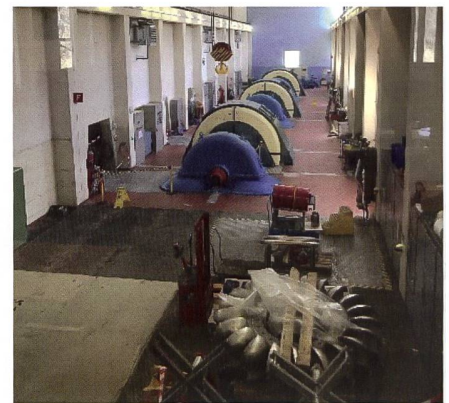
Centrale de Vissoie.

L'Office fédéral de l'énergie (OFEN) a octroyé aux Forces Motrices de la Gogra SA des contributions à l'investissement pour les suréquipements de 4,9 millions de CHF brut pour Mottec et de 13,2 millions de CHF pour Vissoie. Cette contribution à l'investissement fait partie des mesures de soutien aux grandes installations hydroélectriques prévues par la Stratégie énergétique 2050.