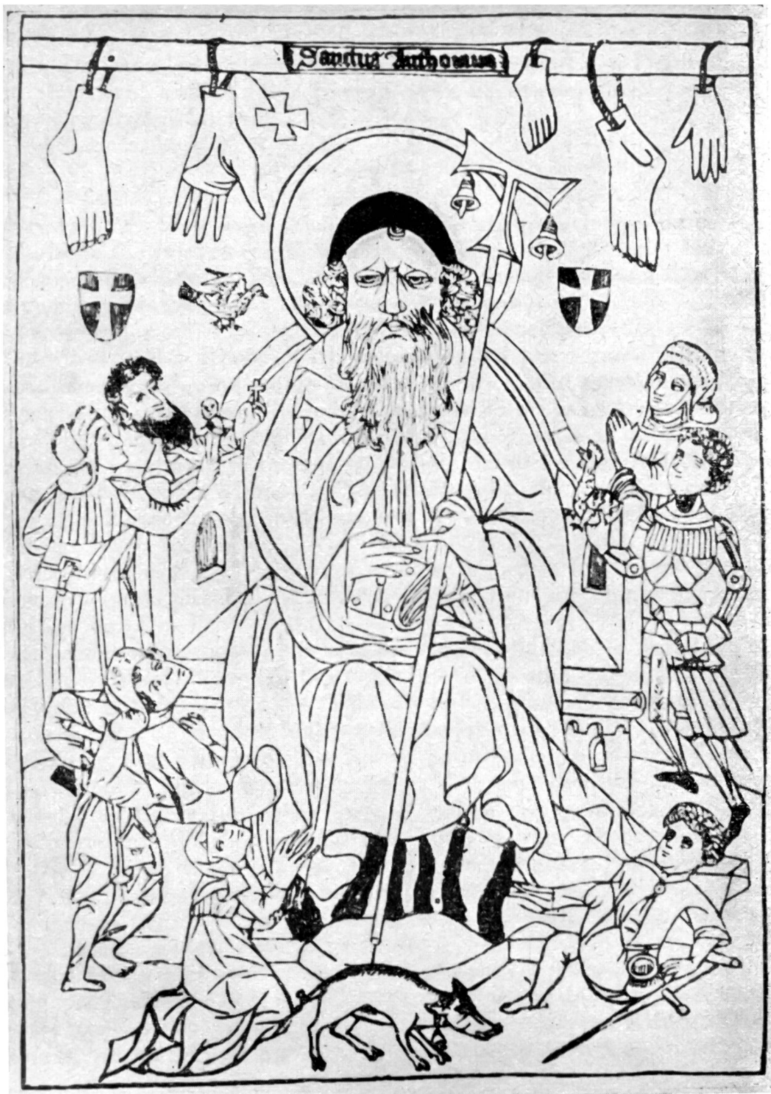
Der heilige Antonius, umgeben von Ergotismuskranke Holzschnitt aus den Bayrischen Staatssammlungen München