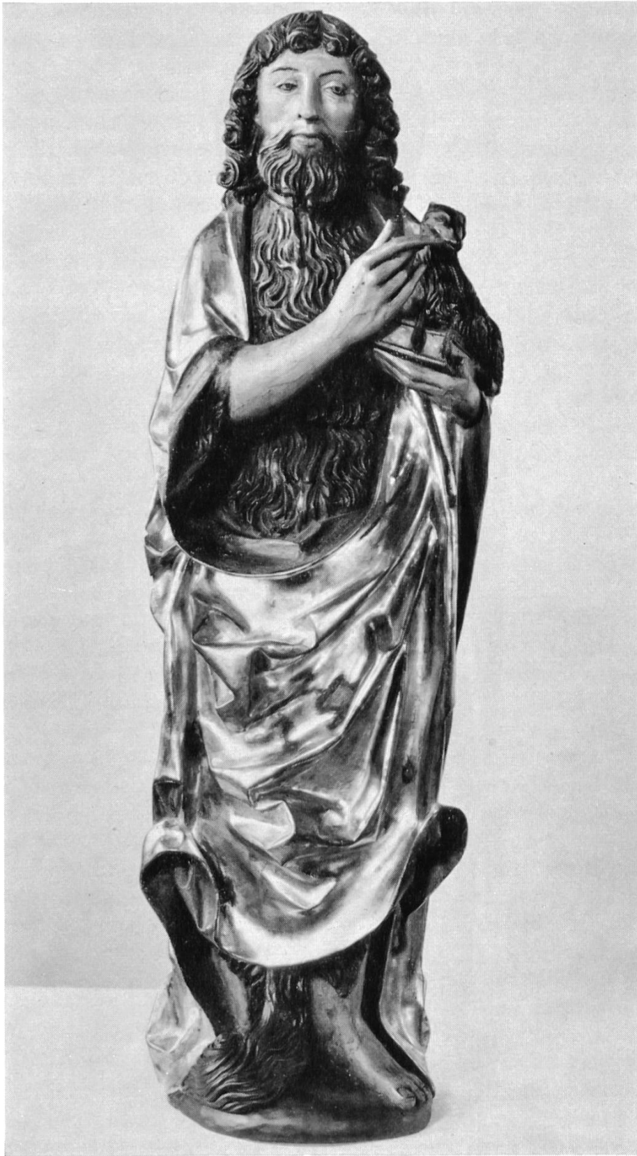
Nr. 4 Holzstatue des hl. Johannes des Täufers