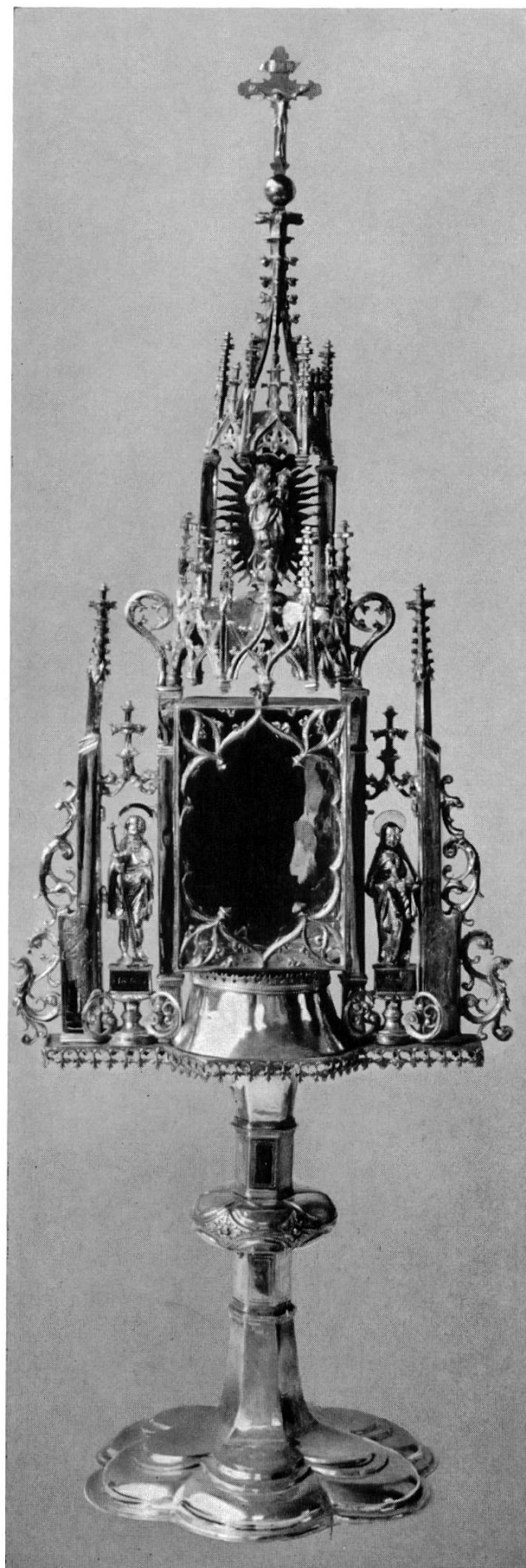
Nr. 5 Gotische Monstranz