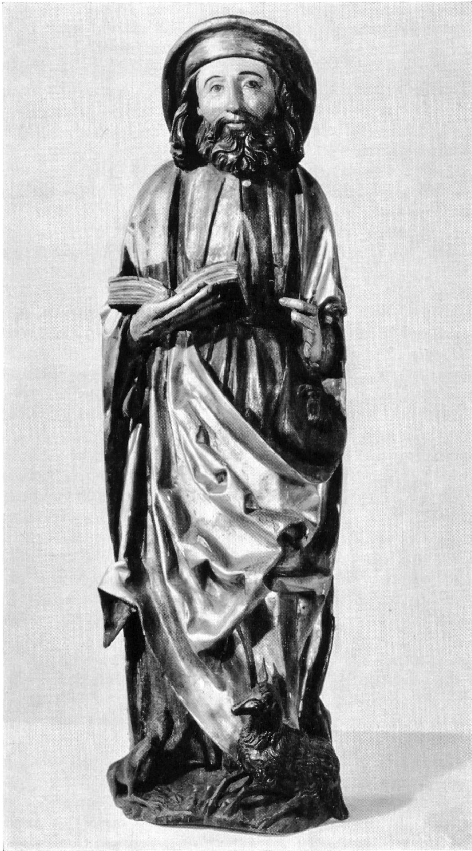
Nr. 3 Holzstatue des hl. Wendelin