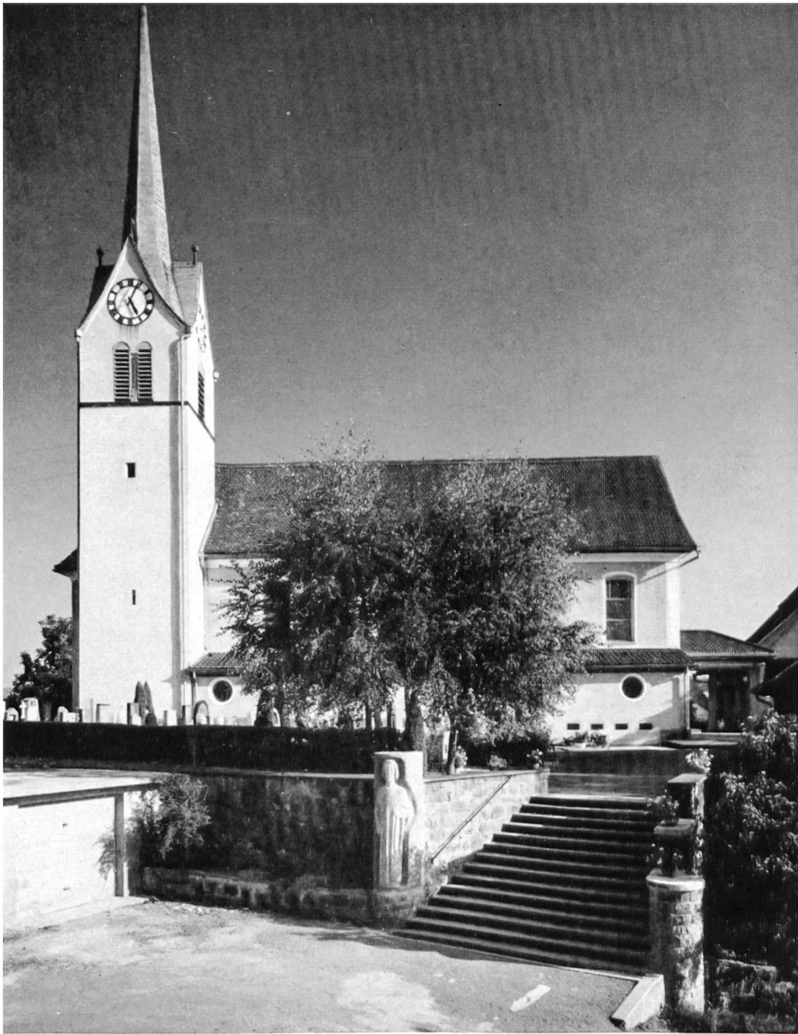
Nr. 2 Die Kirche nach den Umbauten 1952/63