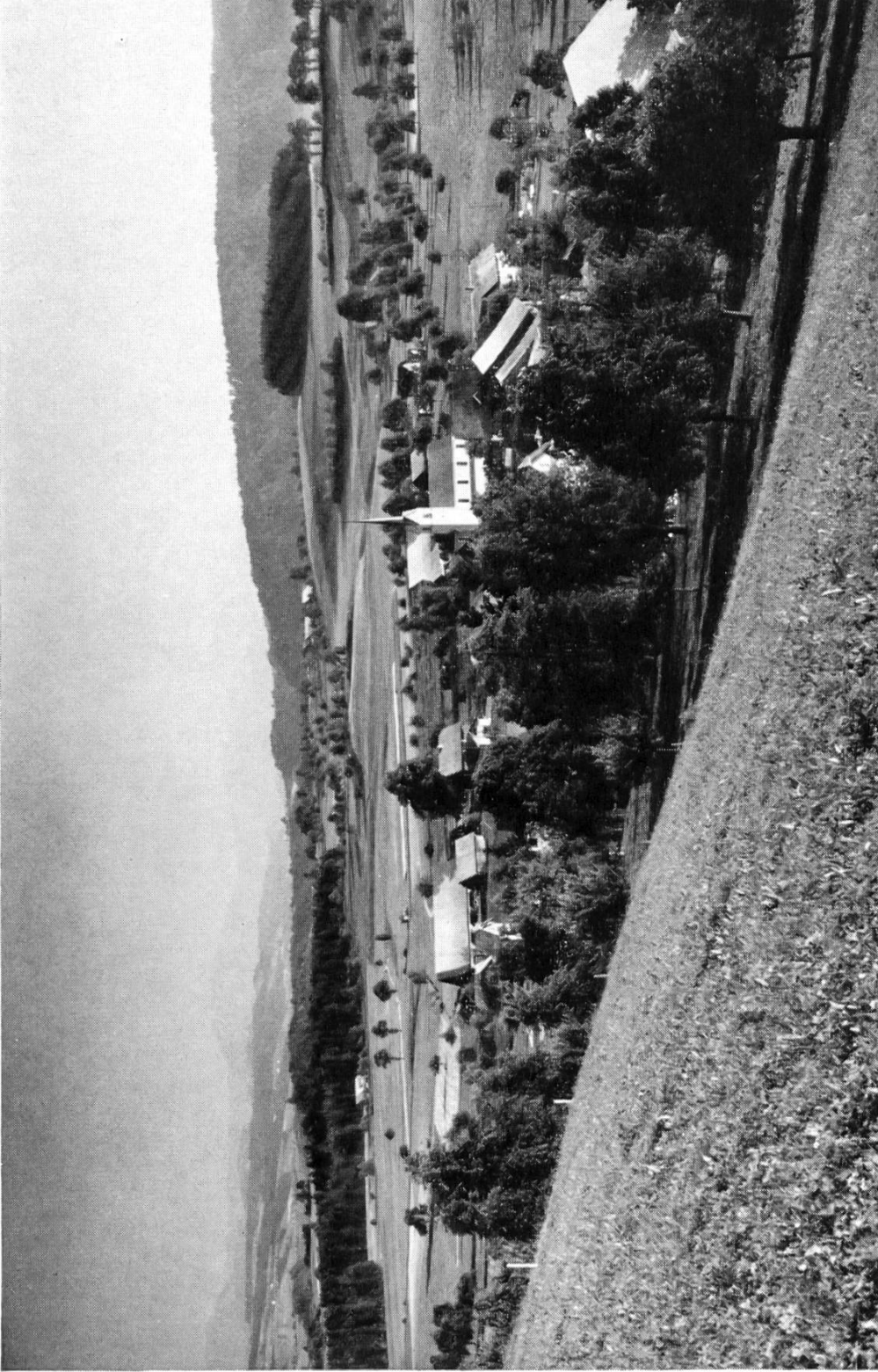
Nr. 1 Gesamtansicht von Geiß