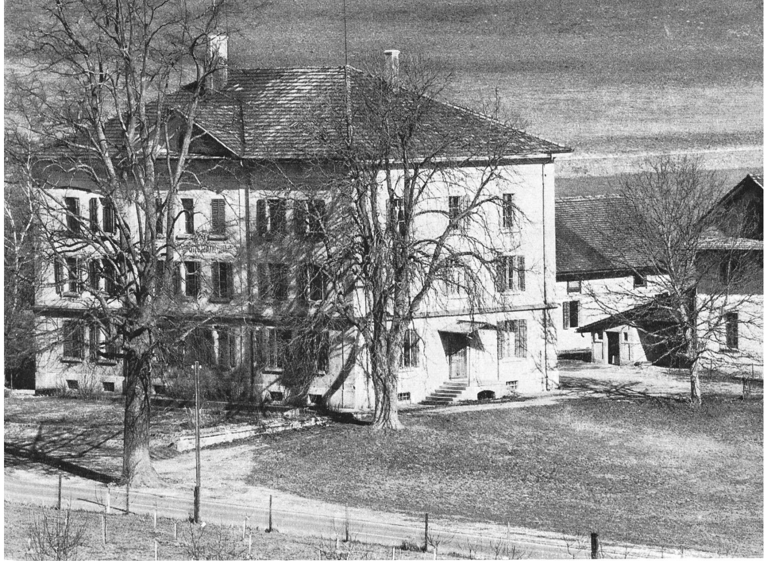
Das ehemalige Bürgerasyl «Burgrain» Ettiswil-Alberswil wie es sich heute präsentiert. Der Haupttrakt (im Vordergrund) und ein Teil der dahinter stehenden Oekonomiegebäude dienen nun als Provisorium für das geplante bäuerliche Museum.