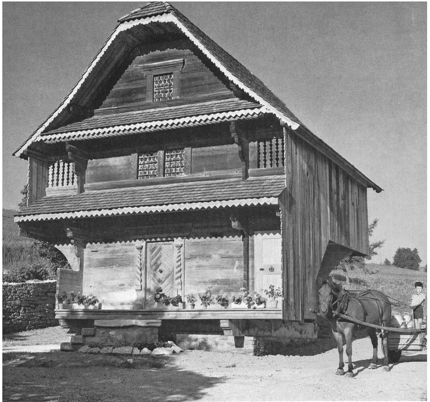
Der unter dem Patronat der Heimatvereinigung Wiggertal restaurierte Speicher auf dem «Chneubühlerhof» in Eppenwil. Das stattliche Objekt mit seiner ausgewogenen Architektur — sie ruht in sich selber — und den hübschen Verzierungen zählt zu den besten dieser Art im Amt Willisau. Der HvW ist es mit diesem Werk gelungen, ein gutes Stück bäuerlicher Kultur als Musterbeispiel instandzustellen und damit der Nachwelt zu erhalten.