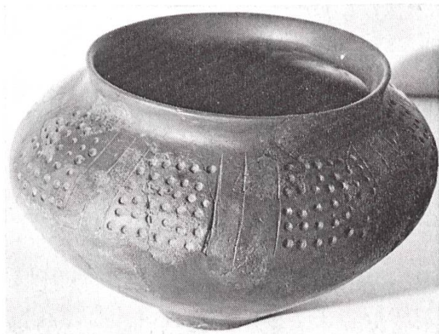
Graburne von einem Brand- grab im Gräberfeld der Schützenmatte, Unterdorf, Schötz. Hallstattzeit, zirka 800—400 vor Chr.