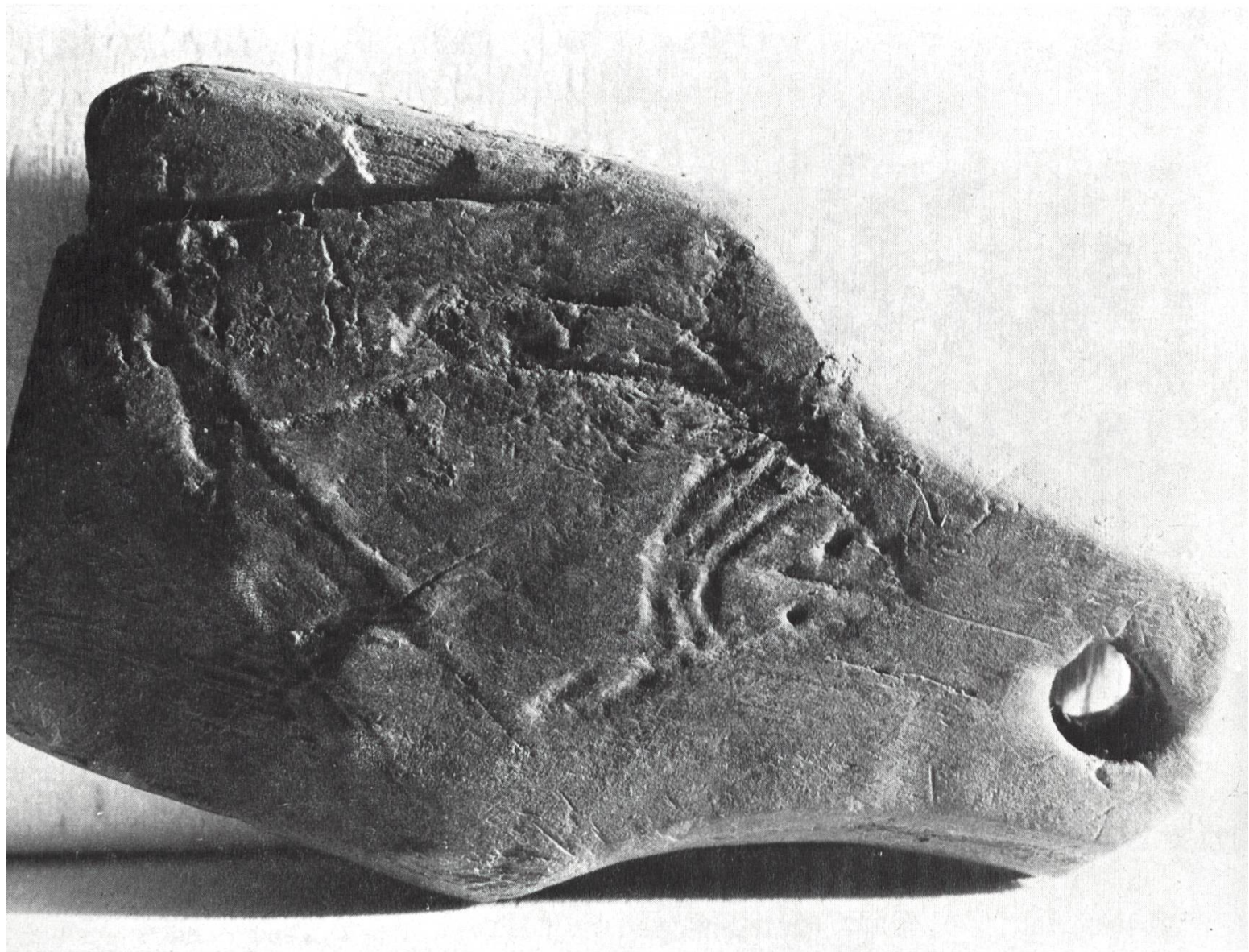
Netzschwimmer aus Holz (Nachbildung). Das Original stammt aus dem Wauwilermoos und gelangte im letzten Jahrhundert in das Historische Museum Basel.