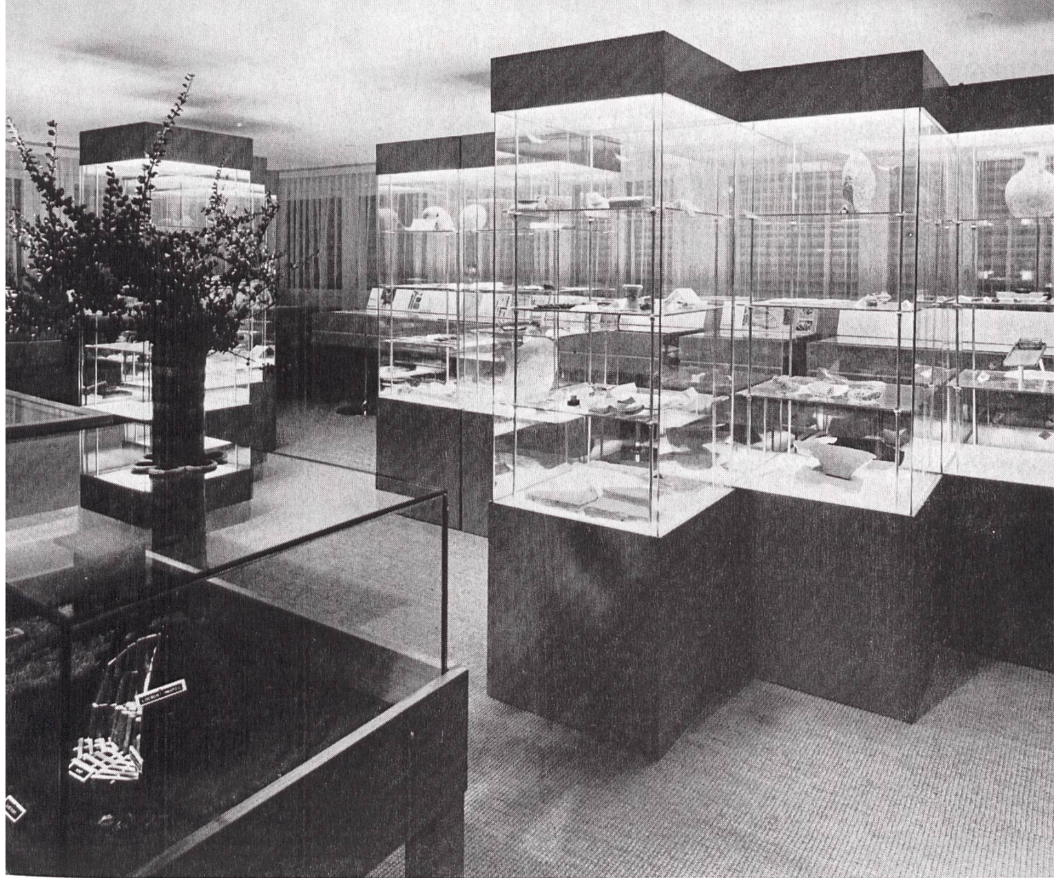
Blick in das zeitgemäss eingerrichtete Wiggertaler Museum