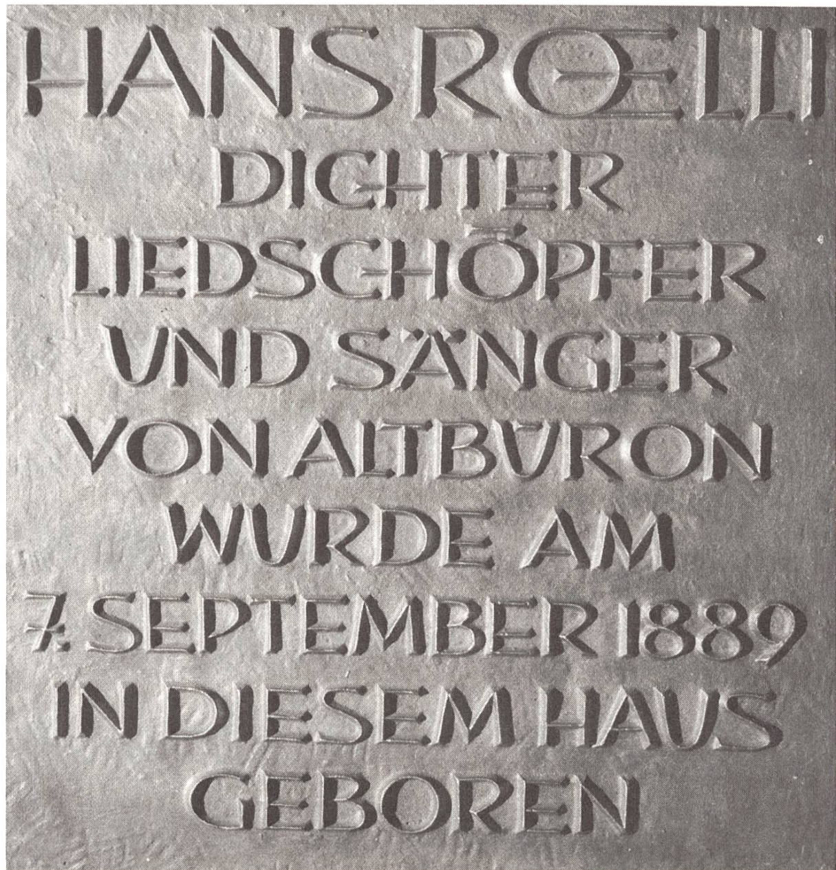
Die Bronzetafel am Geburtshaus in Willisau.