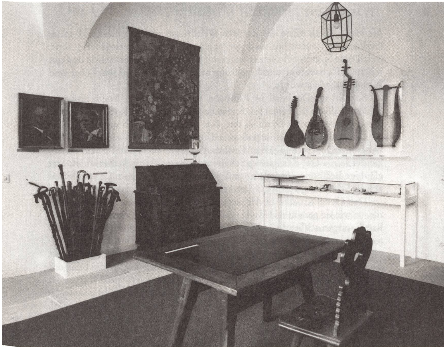
Ausschnitt einer Ecke der Hans Roelli-Stube im Schloss Willisau.