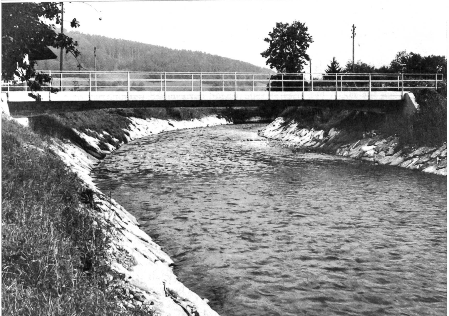
Die moderne Wiggerbrücke samt erfolgter Uferkorrektion: Zeuge einer neuen Zeit.

Gemäss dem besagten Strassengesetz war jeder Gemeinde vorgeschrieben, die in ihren Gemarken liegenden Strassen selber zu erhalten. Beim Bau und Unterhalt der Kantonsstrassen II. Klasse aber lag das Pflichtenheft in den Händen der sogenannten Strassenbezirke. Der Kanton war in zehn solche eingeteilt. Mit Nummer 9 war derjenige von Altishofen bezeichnet. Er umfasste die Gemeinden Alberswil, Schötz, Ohmstal, Nebikon, Egolzwil, Ebersecken, Altishofen und Dagmersellen. Bei diesen Kantonsstrassenbauten übernahm der Staat den Aufwand für die Ausmessung, Planierung und Absteckung der Strassenlinie, die Leitung und Aufsicht der Bauausführung, die Lieferung des erforderlichen Sprengpulvers, den Unterhalt der Werkzeuge zum Steinsprengen, die Arbeitskosten der Maurer, Steinhauer, Schmiede und Zimmerleute sowie die Lieferung des Kalkes; gleiche kantonale Leistungen wurden ebenfalls beim Bau von Brücken erbracht, wenn deren lichte Öffnung mindestens zwei Fuss (= 60 Zentimeter) betrug.