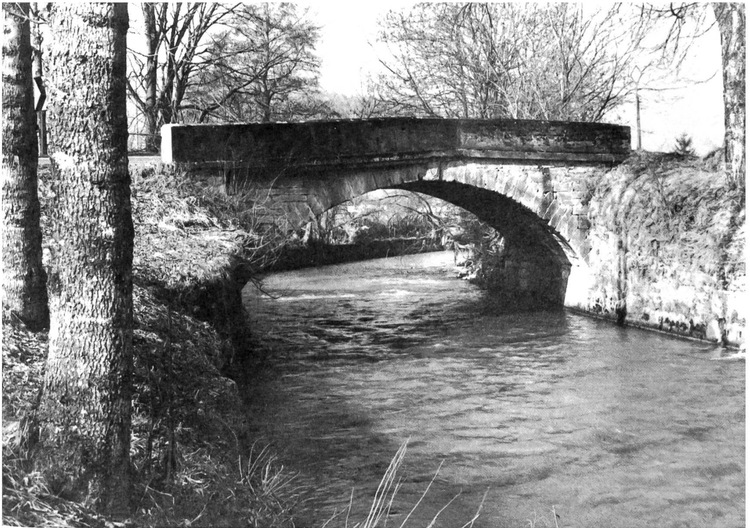
Die historische Wiggerbrücke in Altishofen: erbaut Ende der 1830er Jahre, 1854 nach Hochwasserschaden verstärkt, 1982 abgetragen