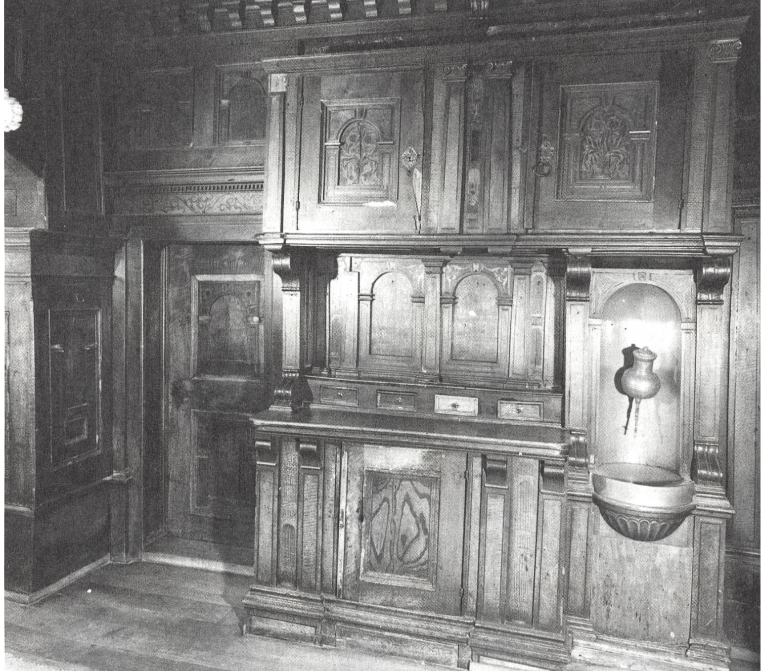
Gediegene Ecke in der sogenannten Bauernstube.