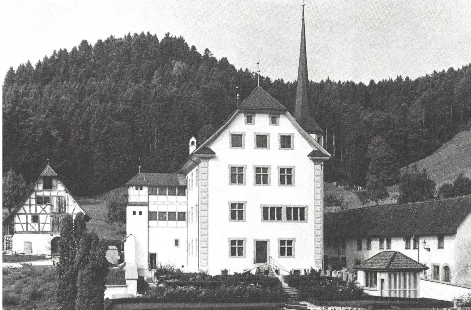
Der Schlossbezirk Altishofen. Von links: Kornschütti, restauriertes Schloss, Gartenhäuschen, Klösterli.

drei Vierteln ersetzt werden. Die Stütz- und Gartenmauern wurden mit Platten aus Alpenkalk neu gedeckt, und über der Eingangstüre wurde das Allianzwapfen (Pfyffer/Segesser), das zur Unkenntlichkeit verwittert war, neu geschaffen.