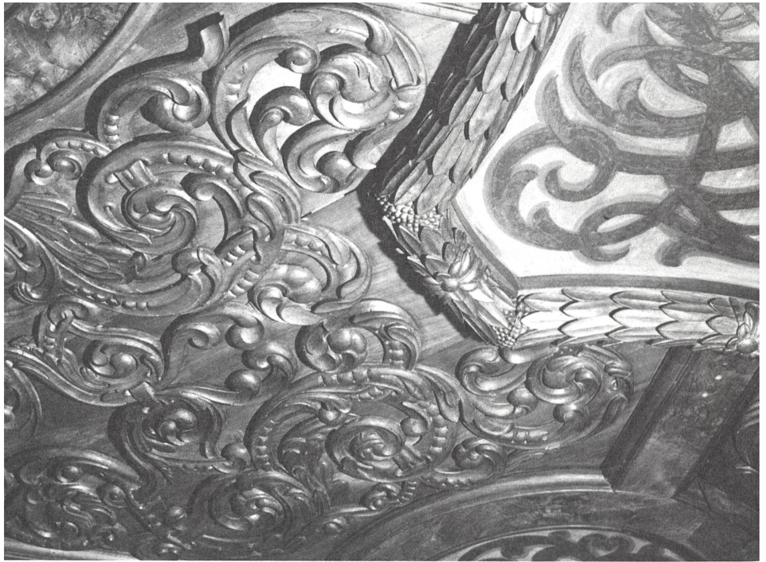
Teilansicht einer geschnitzten Zimmerdecke aus dem Hochbarock.

Überlieferungen) über das Bauwerk. Dazu gehörten der Meinungs- austausch und Beratungen mit den Sachverständigen der Kantonalen Denkmalpflege.