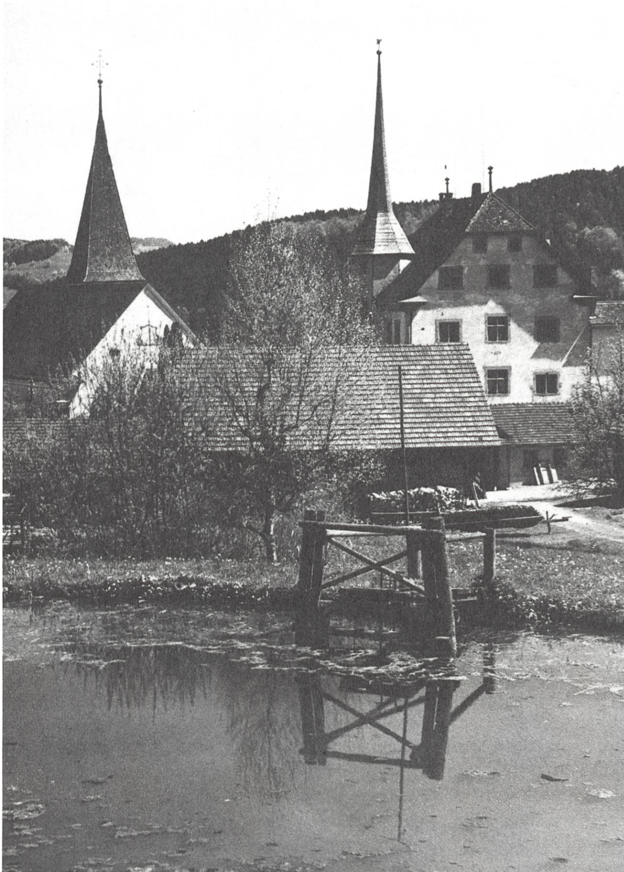
Verträumter Winkel beim Weiher oberhalb des Schlosses.