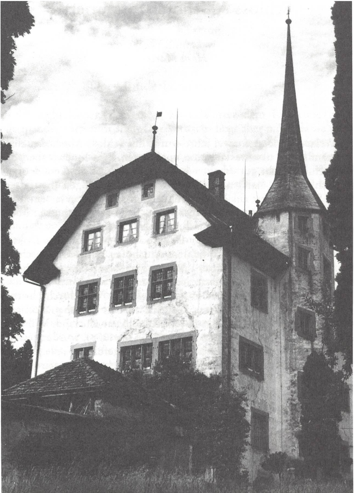
Schloss Altshofen vor seiner Restaurierung.