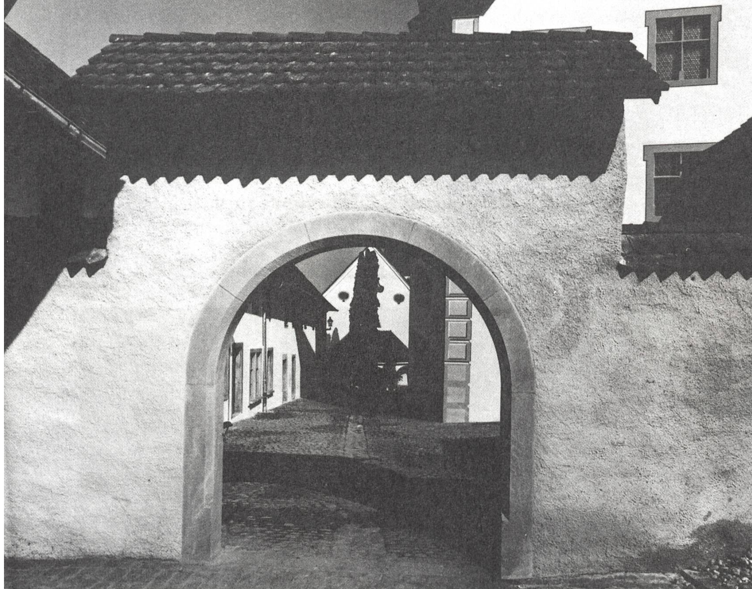
Der neuaufgebaute obere Toreingang auf der Westseite.

historisch gewachsene Baugruppe den regionalen Rahmen sprengt, Sorge zu tragen, ist der Auftrag an unsere Zeit, selbst wenn dafür noch grosse Opfer erforderlich sind. Finanzielle Mittel in Kultur angelegt sind für ein Volk eine gute Anlage, auch wenn sie keinen Zins bringen. Indem es sie schützt und erhält, beweist es, dass es sich über rein materielles Denken hinaus an Geistigem und Künstlerischem orientiert. Die Leistungen, die dafür aufgewendet werden, werten zukunftsbezogen und vor dem Hintergrund der Geschichte höher als Aufwendungen für die Zivilisation. Damit sei deren Bedeutung nicht im geringsten gemindert. Sie sind ebenso wichtig wie nötig. Die beste Entfaltung aber wird erreicht, wenn sich Zivilisation und Kultur befruchtend miteinander verbinden. Dann gelangen Mensch und Gemeinschaft zu wirklichem Fortschritt.