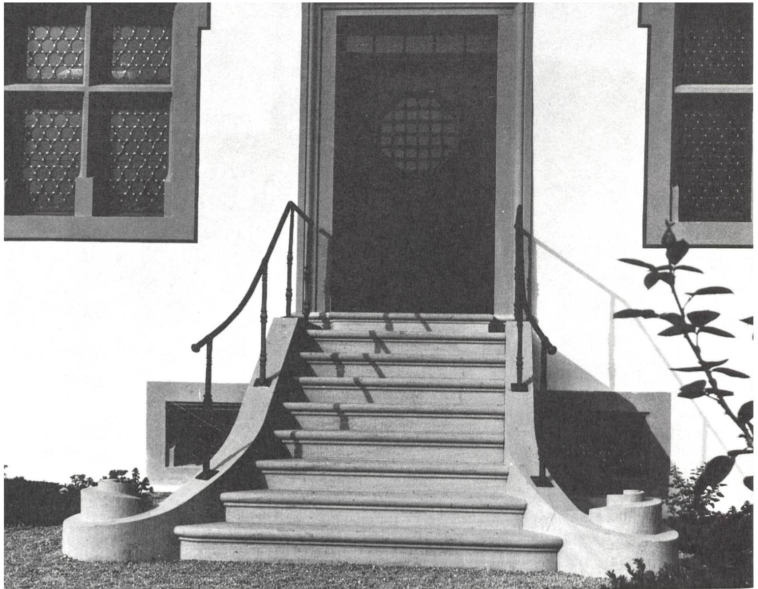
Die neugeschaffene sandsteinerne Freitreppe, die vom Barockgarten in das Erdgeschoss (einstiger Gartensaal) führt.

stet. Auch die Spendenaktion der «Freunde und Gönner für die Erhaltung des Schlosses Altishofen» unter dem Patronat des Gemeinderates ist gut angekommen. Zusätzlich Geld bringt die Vermietung der Schlossräume für Veranstaltungen, Hochzeiten, Feste undso weiter.