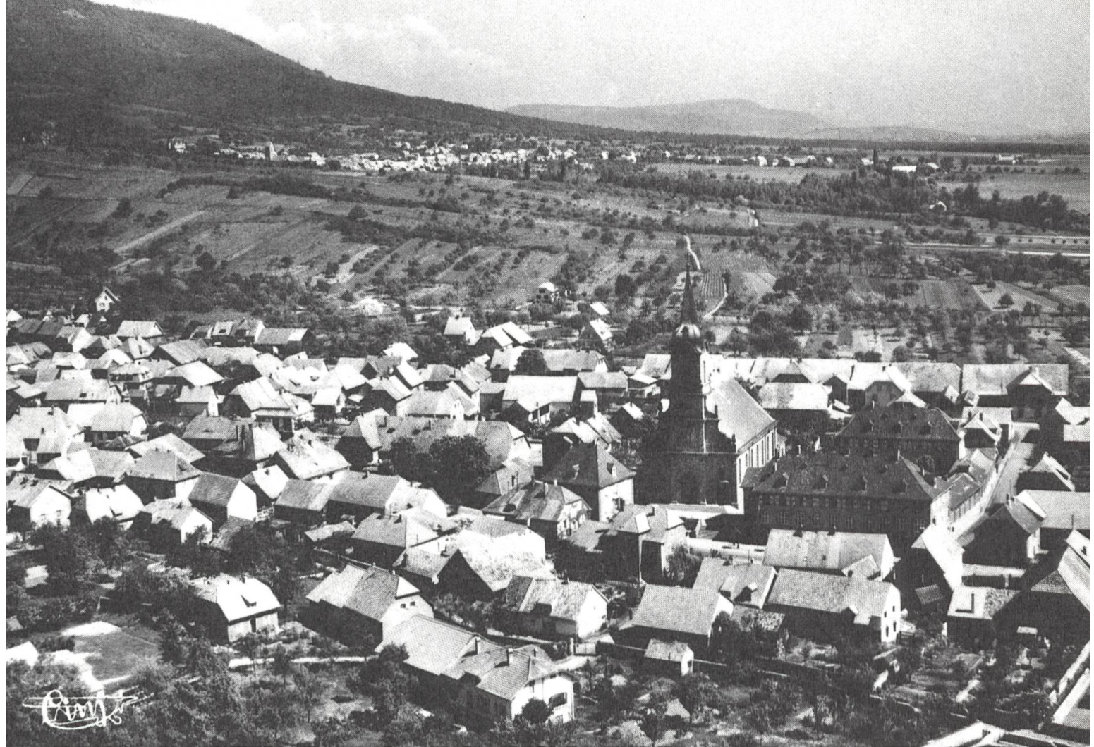
Uffholtz heute. Im Hintergrund liegt Wattwiller.