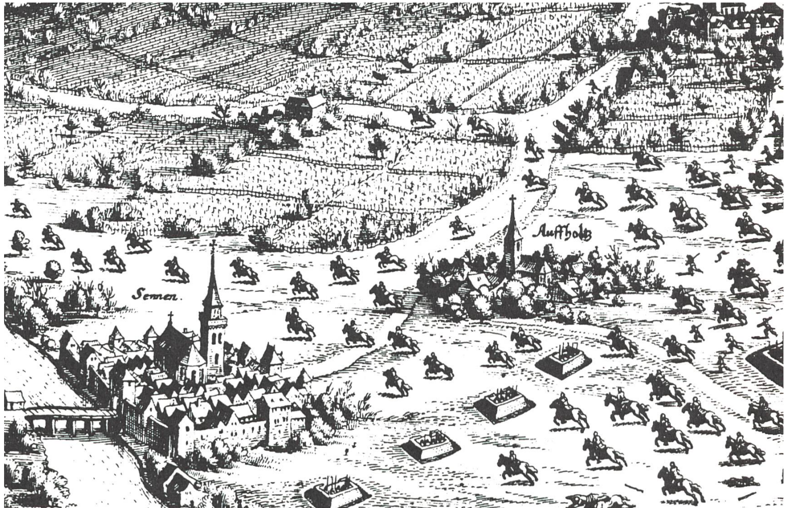
Kupferstich des Baslers Matthäus Merian: «Die Feldschlacht von Wattweiler» (12. März 1634). Auszug aus dem «Theatrum Europaeum», einer zeitgenössischen Zeitung. Die Schweden treiben die Kaiserlichen in die Flucht. Vier Jahre später trafen in Uffholtz die ersten Schweizer Einwanderer ein. Sennen = Sennheim (Cernay), Waatweil = Wattweiler (Wattwiler), Auffholtz = Uffholtz, Dann = Thann.