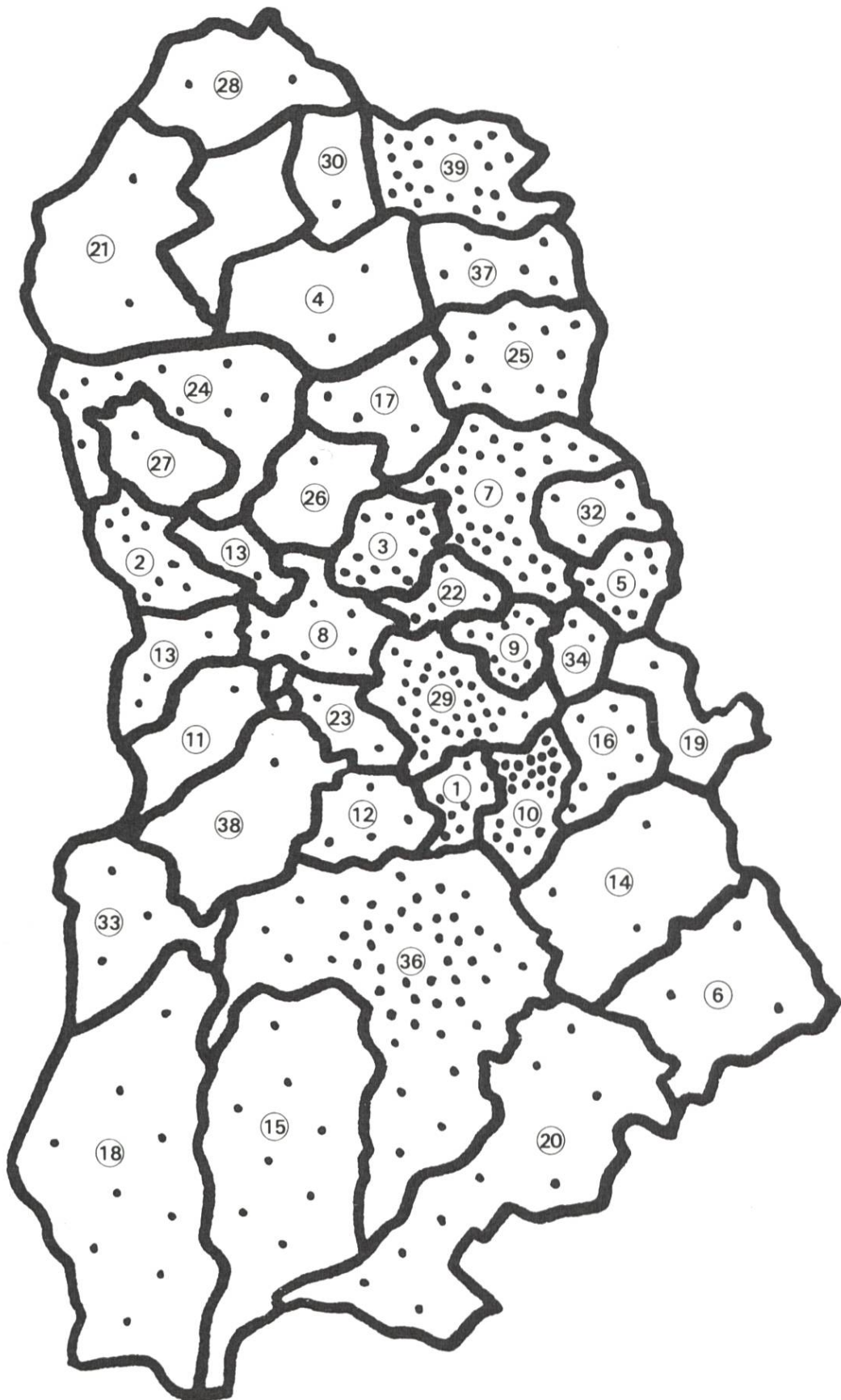
Tabelle 2: Geographische Gesamtübersicht der Anzahl Arbeiten (geordnet nach Gemeinden), ohne Berücksichtigung der regionalen Arbeiten. 1 Punkt entspricht 1 Arbeit. Numerierung der Gemeinden: siehe Tabelle 1.