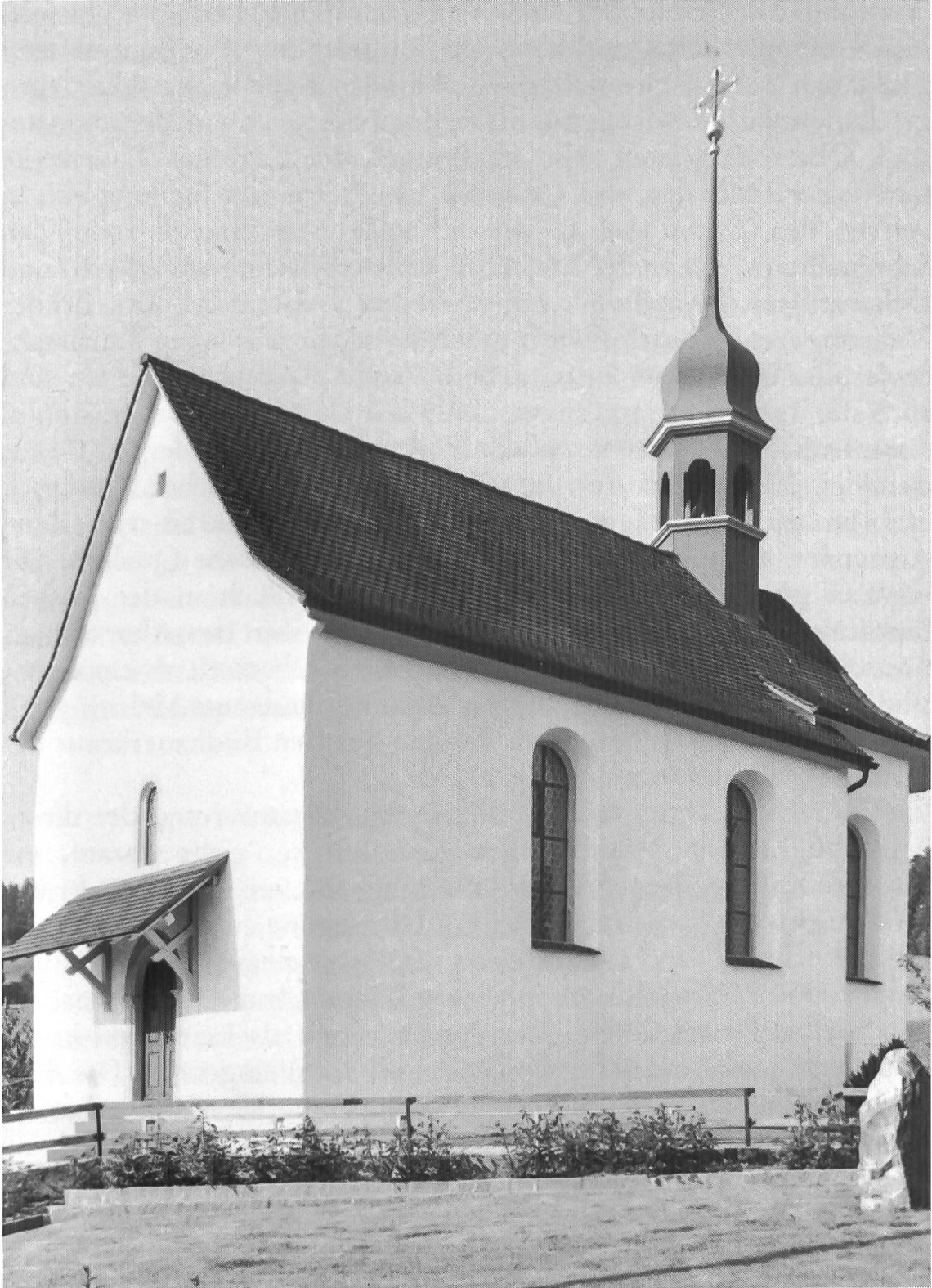
Kapelle St. Gallus und Othmar in Oberroth.