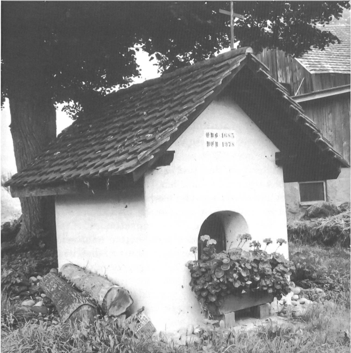
Otilia-Chäppeli im Zinggen.