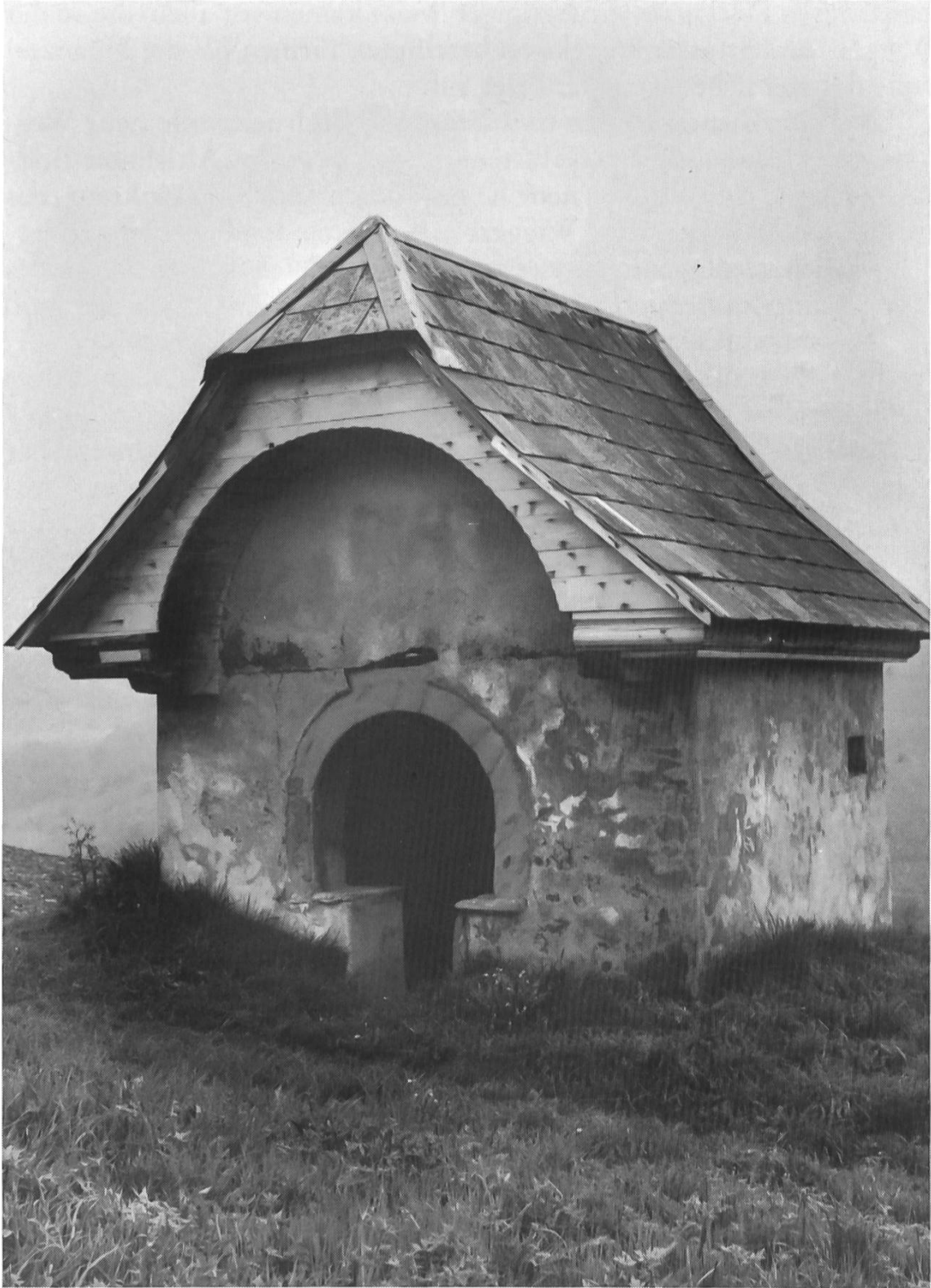
Das «Hölzig Chäppeli» in Ebersecken vor und nach der Restaurierung.