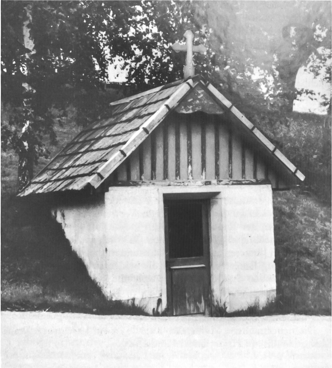
Alte und neue Wegkapelle beim Althus, ob der Mühlematt, Ufhusen.