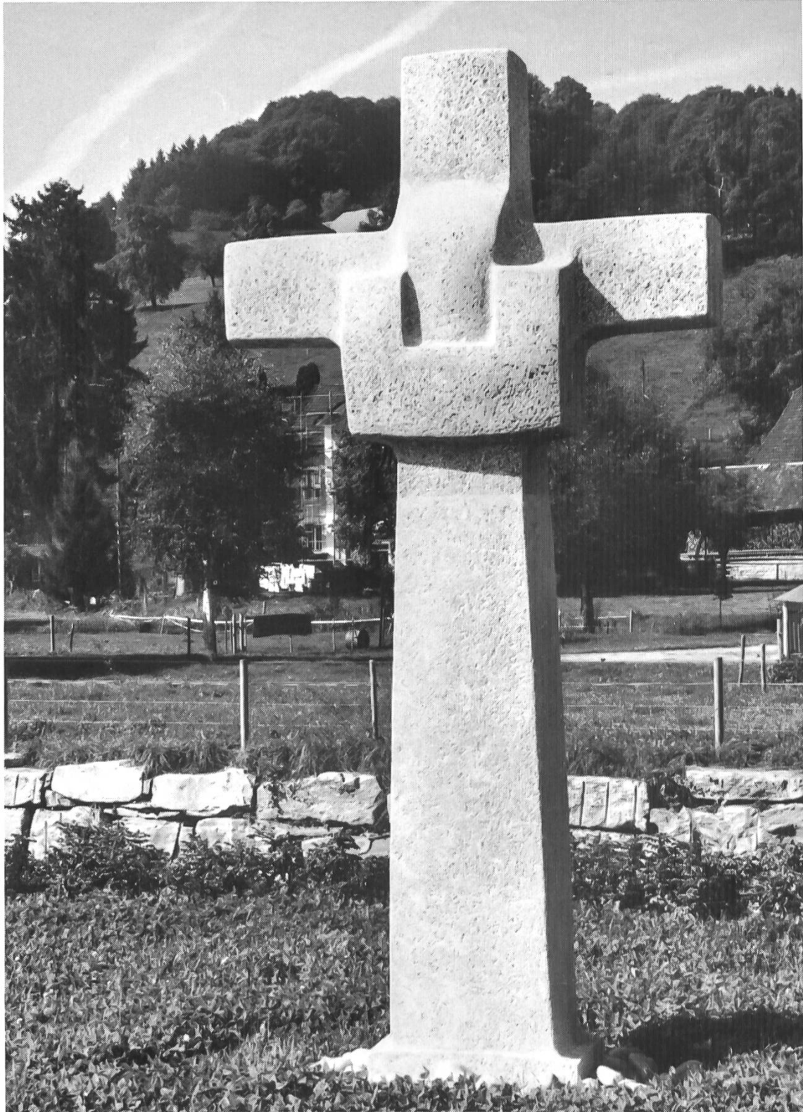
Das neue Wegkreuz in Alberswil.