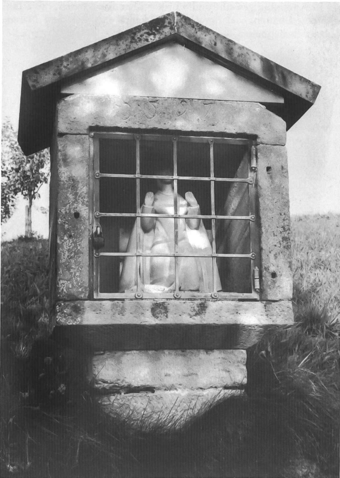
Das «Zändwehchäppeli» im Zinggen ist nach Grösse und Aussehen offenbar ein erweitertes «Helgestöckli».