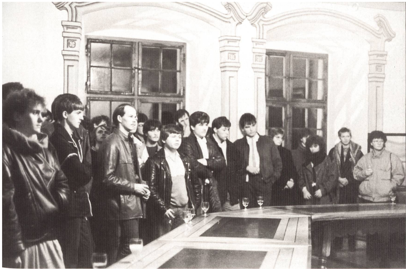
Fast während der ganzen Restaurierungszeit blieb der Rittersaal, der jetzt Ritterstube heisst, für offizielle und private Anlässe benutzbar, wie bei der Jungbürgerfeier 1985.