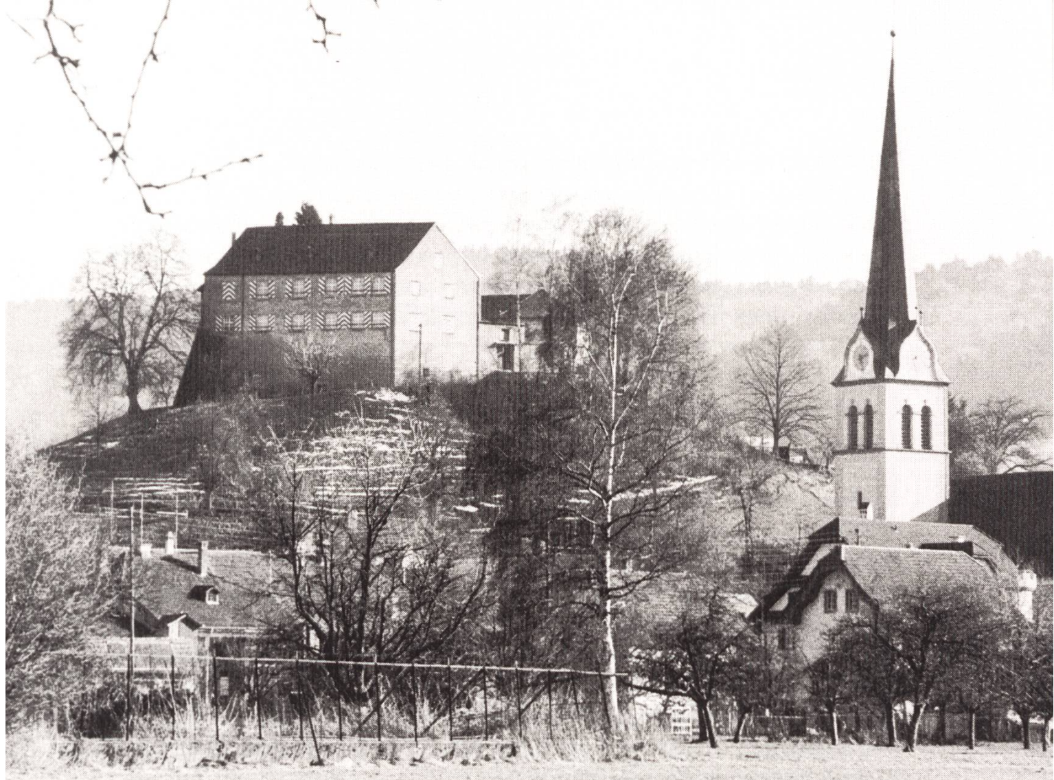
Auf dem vierzig Meter hohen Molassehügel hinter der Pfarrkirche, wo schon die – allerdings nicht durch Funde belegte – Burg der Herren von Reiden stand, erhebt sich die Johanniterkommende.

arme Jerusalempilger zu beherbergen, sie bei Krankheit zu pflegen, ihnen gegen die Sarazenen beizustehen und die christliche Religion zu beschützen und zu verbreiten. Aus diesen Vereinen, deren Mitglieder ein Kreuz auf ihrem Mantel aufgenäht hatten, gingen die geistlichen Ritterorden (wohl zu unterscheiden von den späteren weltlichen Ritterorden) hervor, die Hospitaliter, die Lazariter, die Tempelritter (Templer, Templiers) und die Deutschritter (Deutschherren, Marianer). Die Hospitaliter nannten sich später Johanniter oder – nach ihrem Hauptsitz – Rhodiser, Malteser. Alle diese Orden, ausgenommen die Templer, hatten auch Vereinigungen von Frauen, die sich in Spitälern ebenfalls in den Dienst der Armen und Kranken stellten.