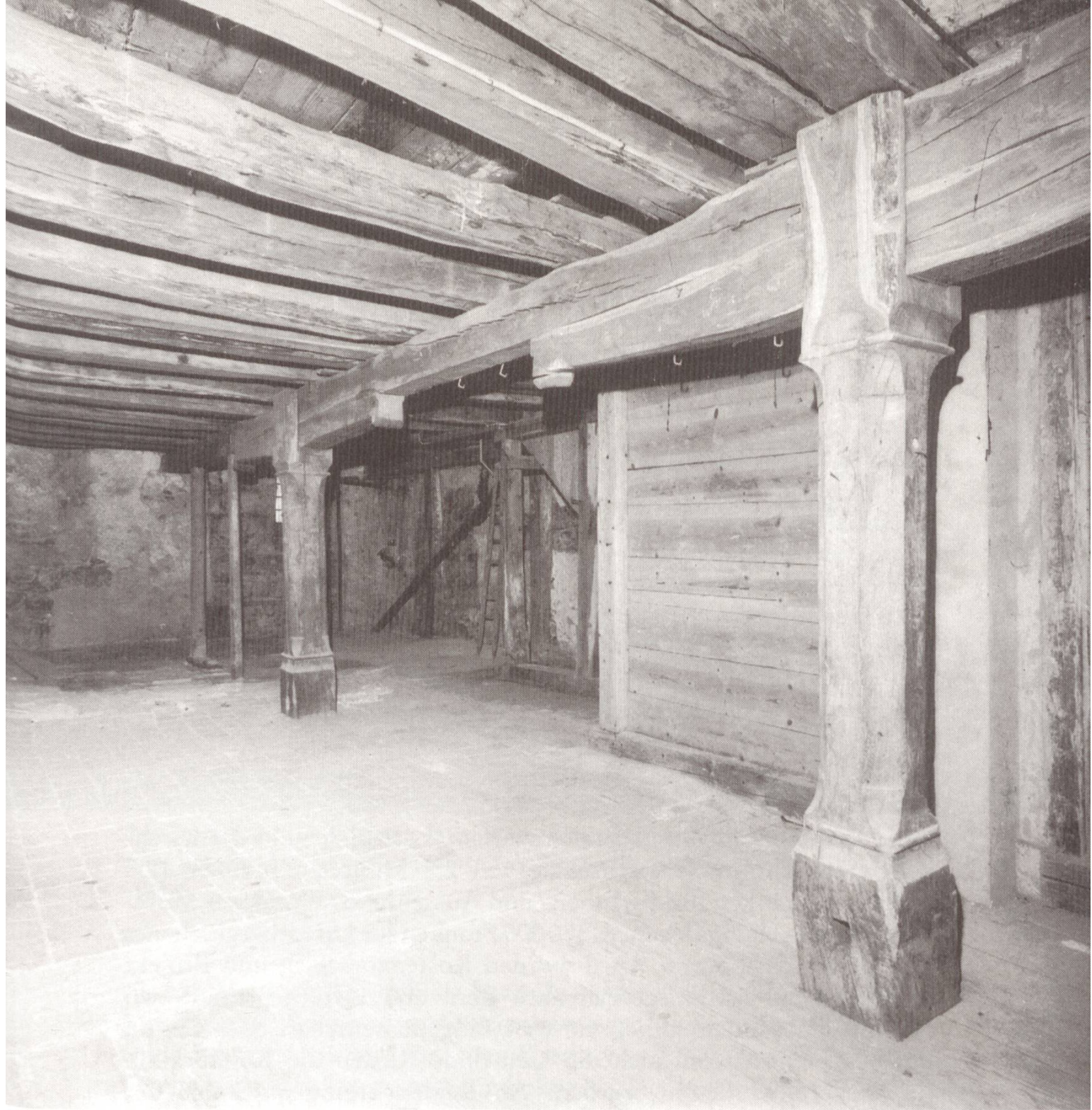
Die Kornschütte vor der Restaurierung.