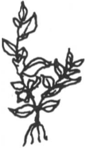
Abbildung 8: Kleinling, Centunculus minimus , die Äbnet-Rarität, nach der Natur gezeichnet. Zweifache Vergrößerung.