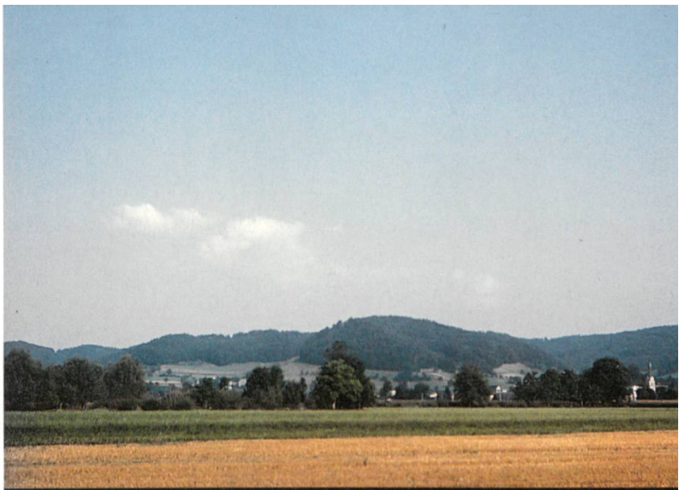
Abbildung 4: 200 m höher als das Dorf Reiden liegt der Äbnet, eine 1,6 km lange Hochfläche, leicht gewellt, mit Höhen zwischen 640 und 660 m über Meer. Hier der Blick gegen Süden. Links das einzige Gehöft auf dem Plateau, der Höferberg.

Abbildung 3: Vom Wiggertal aus ist der Äbnet nicht zu sehen. Er liegt, hinter Wäldern verborgen, zwei Kilometer östlich vom Dorf Reiden. Der Blick vom Westen her zeigt in der Bildmitte hinter dem Dorf Reiden den Hügel Lusberg, hinter dem auf Waldlichtungen das Gelände Lochbrunnen und die Siedlungen Gsteing und Reider Lätten liegen. Die Wälder links hinten verdecken die Sicht auf die Hochebene des Äbnet.