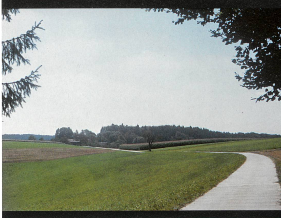
Abbildung 5: Eine einzige Stelle nahe dem Höferberg erlaubt den Blick vom Äbnet zurück nach Reiden. Rechts der Spitzhubel, links Reiden, dahinter der Brättschällenberg. Im Vordergrund abgeerntete Felder mit den zu Vernässung neigenden Böden.

Abbildung 4: 200 m höher als das Dorf Reiden liegt der Äbnet, eine 1,6 km lange Hochfläche, leicht gewellt, mit Höhen zwischen 640 und 660 m über Meer. Hier der Blick gegen Süden. Links das einzige Gehöft auf dem Plateau, der Höferberg.