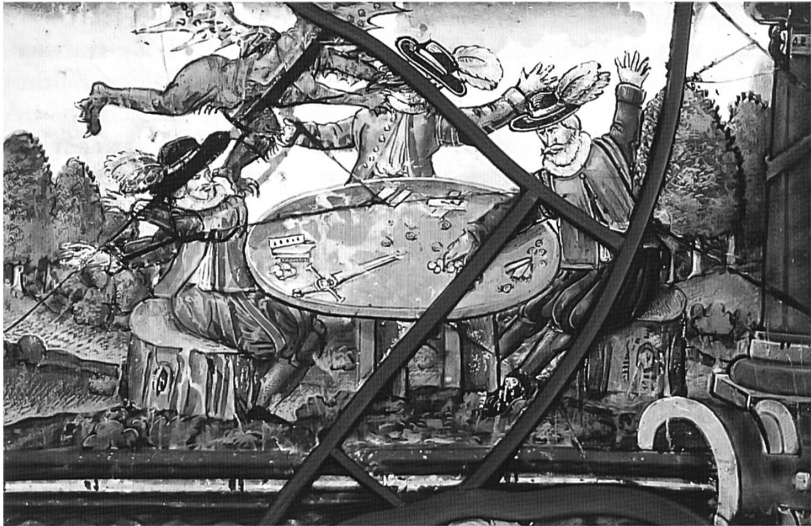
Wappenscheibe 1674: Die Abbildung zeigt die Spieler beim Jass; Schröter wird von einem Teufel in Drachengestalt geholt. Landvogteischloss, Willisau.

che Quellen überliefern. Der Würfelspieler erscheint daher auf mittelalterlichen Totentanzdarstellungen und symbolisiert die Nähe zu Tod und Verderben.