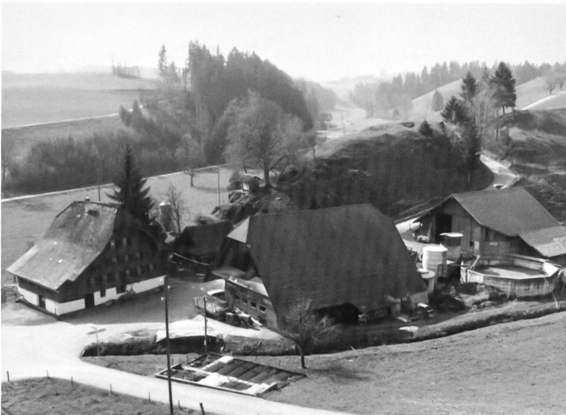
Die heutige Lochmühle als Landwirtschaftsbetrieb mit Burghügel. Ungefähr beim Einschnitt der Mühlemattstrasse befand sich früher die Burgstelle.

Wasserrades auf die horizontal laufenden Mahlgänge. Mit leiser Wehmut denke ich an die schweren eisernen Zahnräder, an die Mahlgänge mit ihren Mühlsteinen, an die eisernen und hölzernen Wellen, an all die kleinen und grossen Dinge und an all das, was aus den alten Räumen meiner Jugendzeit noch auftaucht.