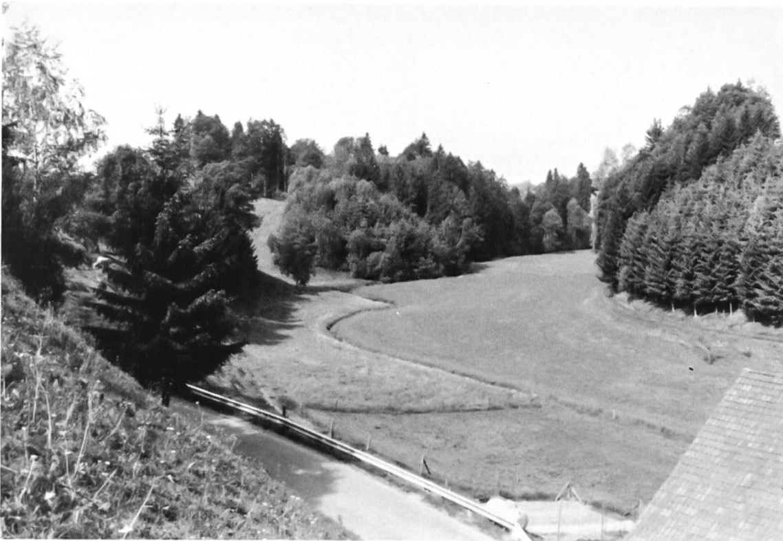
Heutiger Verlauf des Wydenlochbaches. Blick von der Lochmühle zum Wydenloch.

sich dem Unterhalt und den Schäden, z.B. durch Hochwasser zu entziehen. Alle Lasten eines Baches wurden also auf den Mühlebachbesitzer abgewälzt.