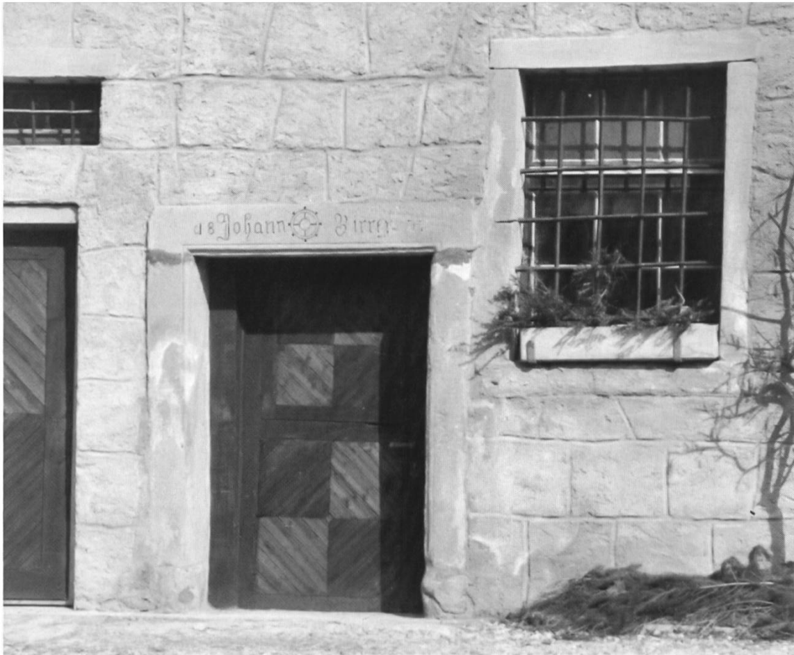
Eingang des «Mülali» mit Inschrift «18 Johann Birrer 37».

Aus dem baufälligen «Mülali» entsteht die «alte Mühle Warmisbach»