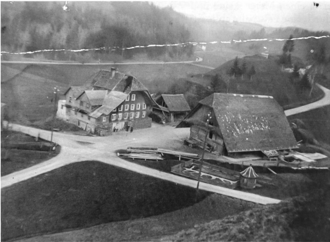
Die alte Lochmühle ums Jahr 1926.