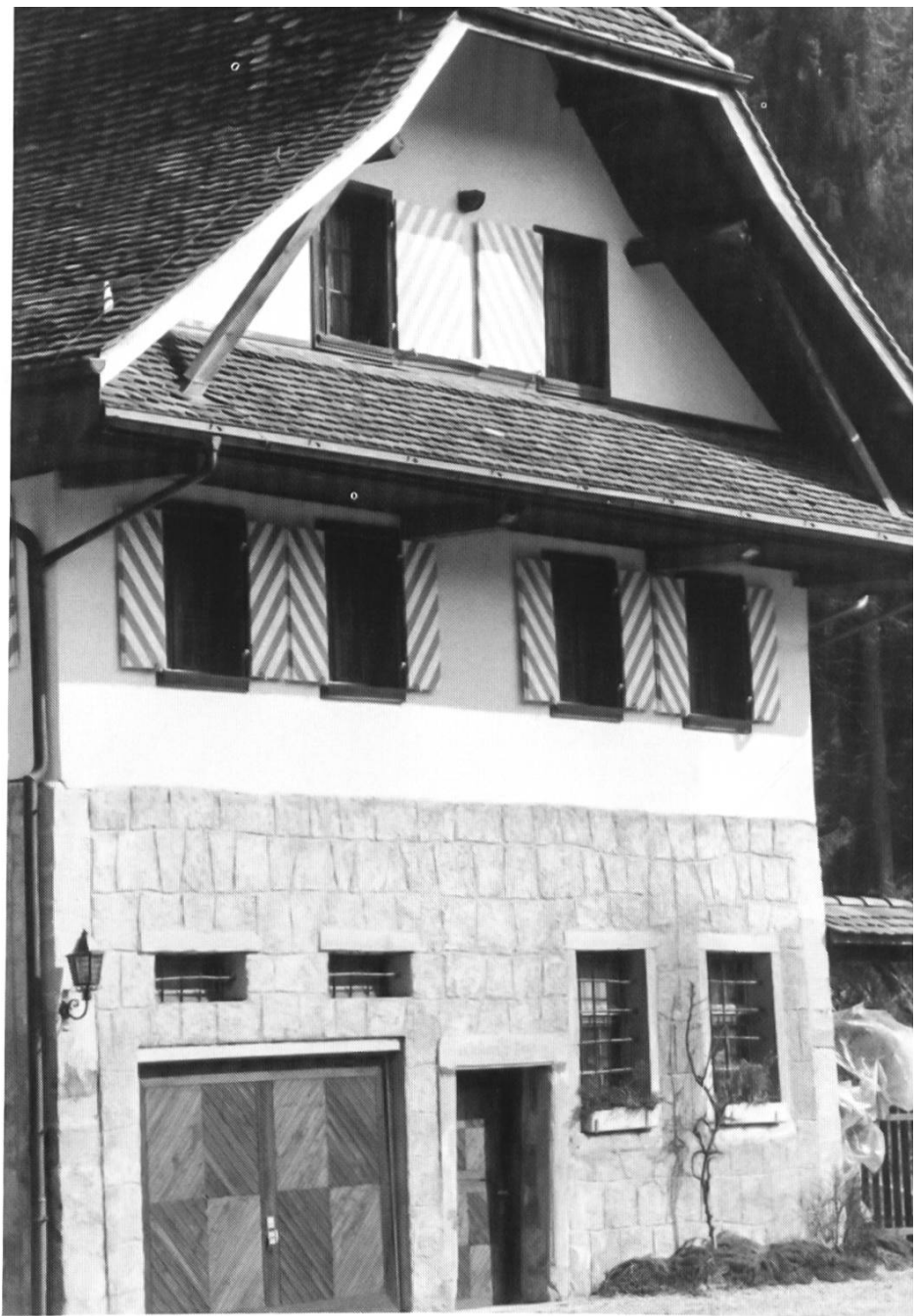
«Mülali» (Hintere Lochmühle), heute «Alte Mühle Warmisbach».

keines. Es gab auch keinen Brunnen mit Trinkwasser. Dieses stand in Mengen im Bach zur Verfügung. Dem «Getzme-Schuhmacher» und seiner Frau fiel es schwer, 1956 ihr langbewohntes, notdürftiges, aber dennoch glückliches Heim zu verlassen. Als es soweit war, versteckte er sich im Estrich unter dem Dach und glaubte, so dem Wohnungswechsel zu entkommen.