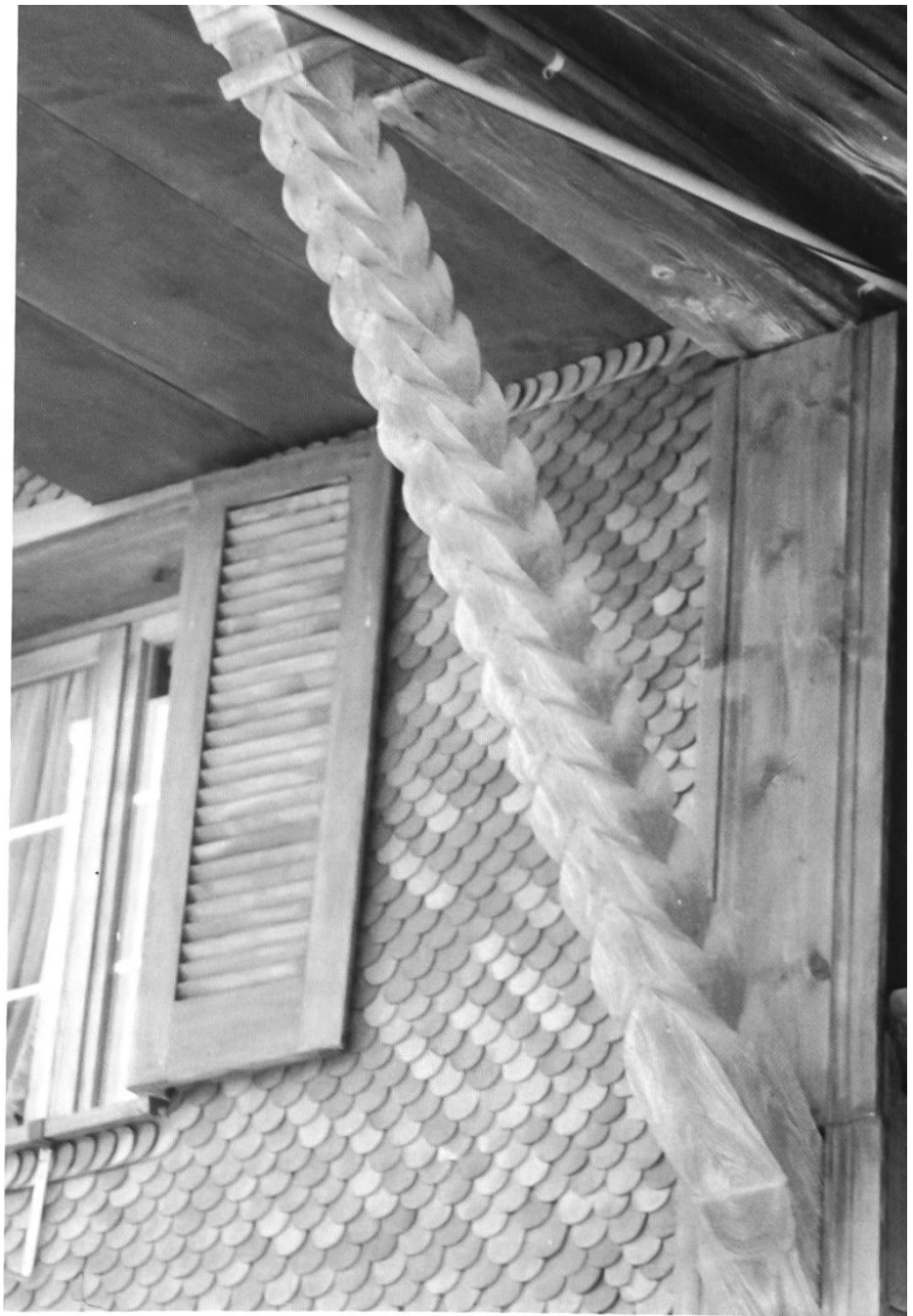
Alter Hausbug auf der Westseite der heutigen Lochmühle.

wird ihnen nachgesagt, sie seien unehrlich gewesen und sie hätten ihre Kunden durch überhebliche Lebensweise von damals als dumm behandelt. Um ihren Grossmut aufzupolieren, hielten sie Pfaue, die ihre Dächer schmückten. Ein von meinem Vater viel erzähltes Beispiel an Überheblichkeit der Süess möchte ich meinen Lesern nicht vorenthalten. In alten Zeiten fand die Flurprozession immer am 1. Mai statt. Sie führte von der Pfarrkirche über Lochmühle–Mühlematt–Bühl und wieder zurück über Bucherhof–Ellbach in die Kirche. (Die Flurprozession wurde übrigens in spätern Jahren am Auffahrtstag abgehalten.) So habe man am letzten Aprilabend den besten Mühlewagen auf dem Vorplatz der Mühle bereitgestellt, ihn mit einem mächtigen