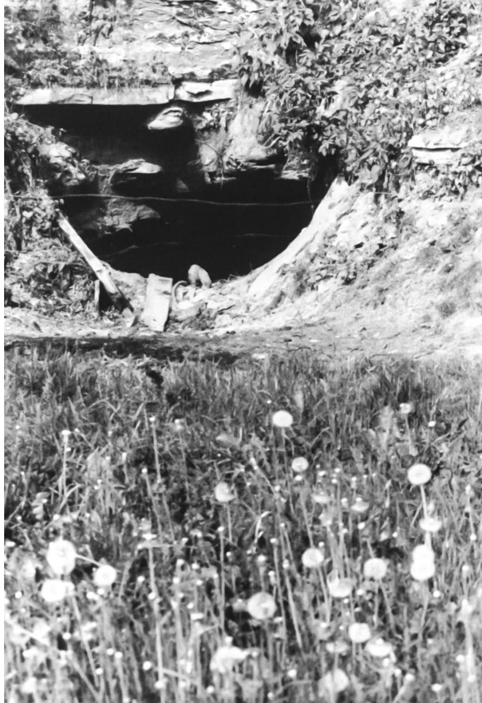
Eingang zum Sodbrunnen auf der Ostseite des Burghügels. Hier begann man mit den damaligen Ausgrabungen.

im «Burgessinnern». Mit dieser Arbeit kam man gut und unfallfrei voran. Schliesslich war ein runder, schön gehauener Raum im Sandstein nach oben frei.