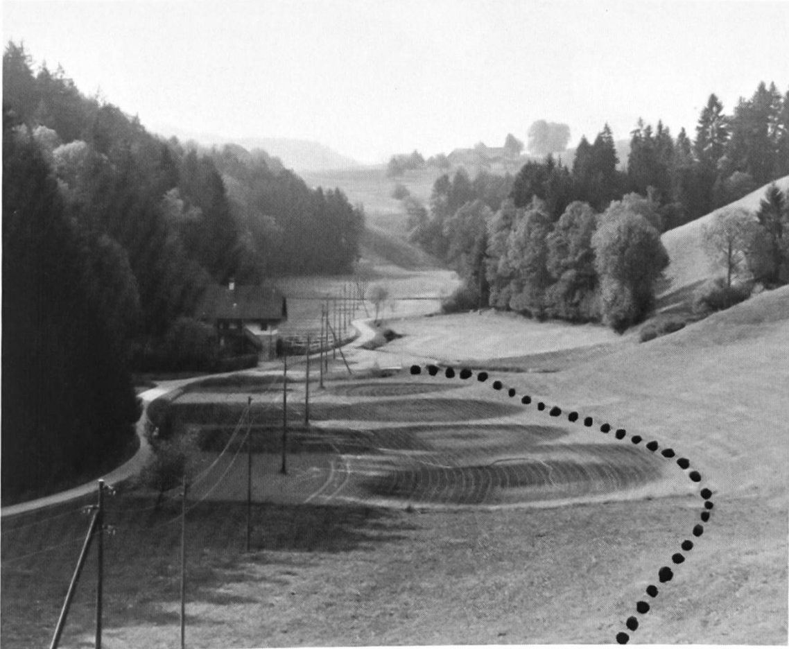
Blick von der Lochmühle zum «Mülali».

beide aus pferdesportlichen Gründen an diesem Objekt und seiner Umgebung interessiert waren, wechselte das «Mülali» den Besitzer. Das Gebäude wurde darauf unter nicht geringen Kosten für Wasser- und Stromzufuhr vollständig restauriert.