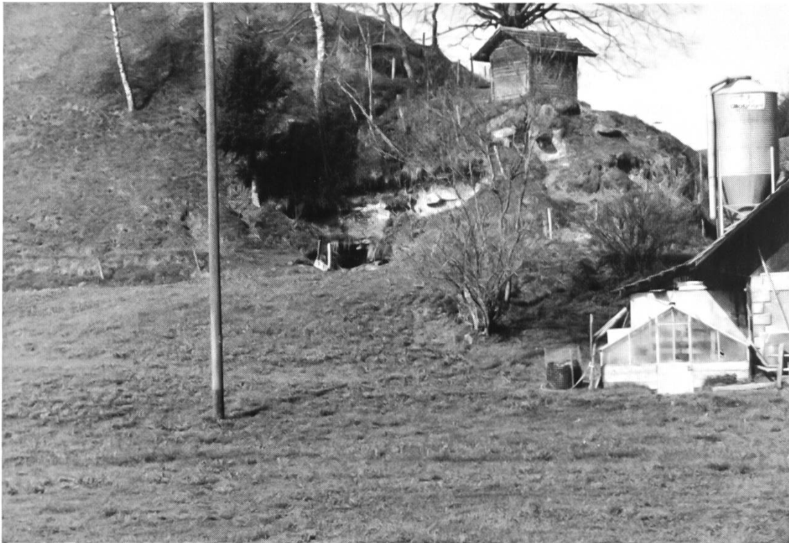
Ostseite des Burghügels bei der Lochmühle. Hier vereinigen sich die beiden Mühlebäche (von links derjenige vom Warmisbach, durchs Loch derjenige vom Wydenloch).

Moos gereinigt und, wenn nötig, mit Holzwehren neu repariert werden. Bei Tag und Nacht konnte es bei einem Gewitter vorkommen, dass die Schwelli zu viel oder zu wenig Wasser in den Mühlebach leitete, somit das Wasserrad nicht mit der gewünschten Wassermenge versorgt wurde. Bei wechselnden Witterungsverhältnissen musste man zur Schwelli gehen und dort die Wasserzufuhr regulieren. Diese Arbeitsgänge waren nachts bei Blitz und Donner alles andere als kurzweilige Spaziergänge.