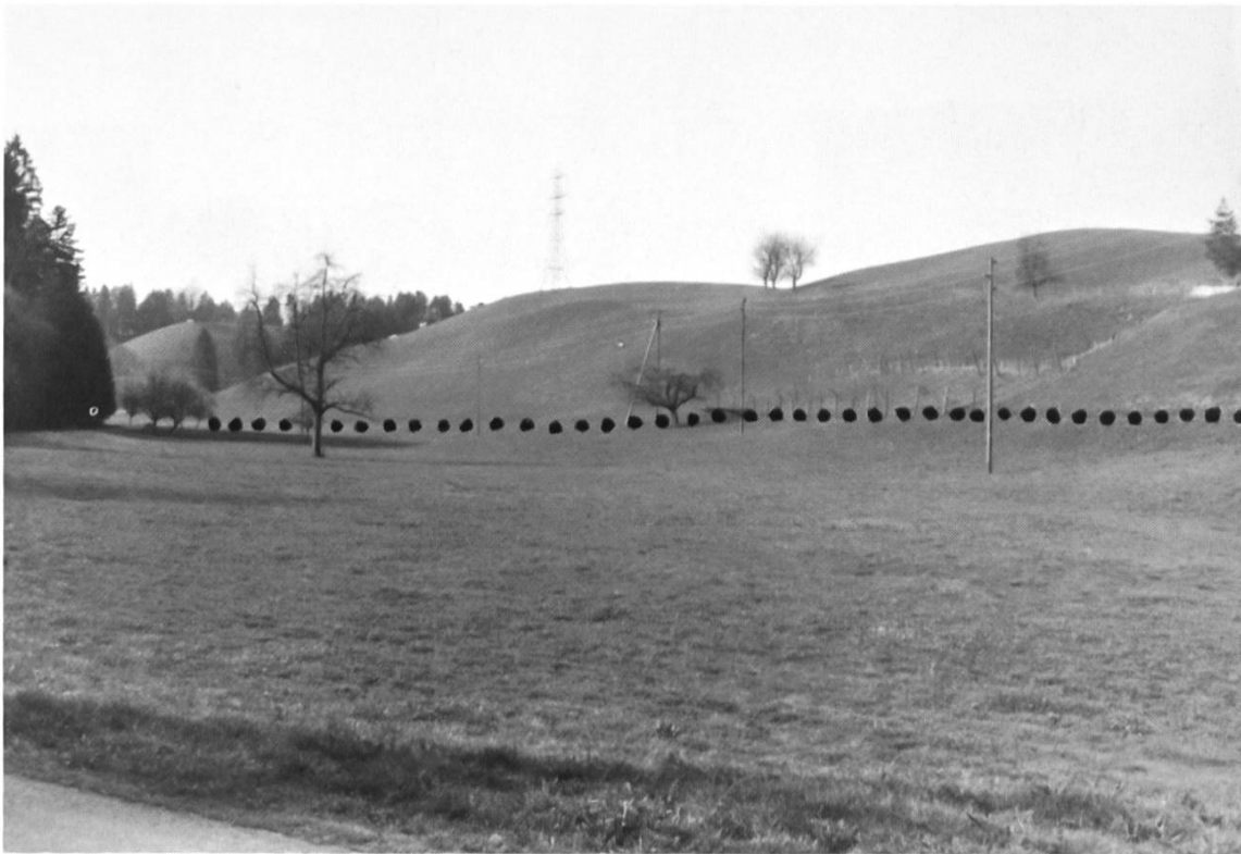
Verlauf des Mühlebaches zwischen «Mülali» und Lochmühle.

Wassermenge mittels etwa 15 cm breiten, starken Brettern reguliert. Das Restwasser des Warmisbachs nahm seinen Lauf unter der Strassenbrücke hindurch und anschliessend rechts der Strasse entlang. Der Mühlebach floss, um nicht an Gefälle zu verlieren, in weitem Bogen einige Meter über der Talsohle dem Lochmühlerain entlang. Dieser Abschnitt war zwecks Bewirtschaftung mit drei Übergängen versehen. Beim «Schlosshoger» vereinigte er sich mit dem Mühlekanal des Wydenlochs, der hier aus seinem geheimnisvollen, unterirdischen Lauf hervortrat.