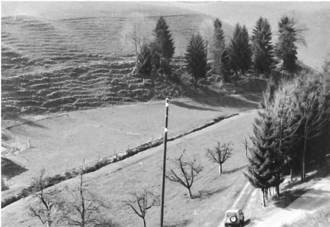
Heutiger Verlauf des Wydenlochbaches bei der Lochmühle. Dem Hang entlang floss der Mühlebach.

Scheibenstand (den Schützenveteranen noch bekannt), einen flachen Lauf an. In rundem Lauf floss er um den «Tannlihoger», wie wir Kinder diesen Wald nannten, und von dem ich folgendes erzählen möchte: Mein Vater, mein Onkel und die Dienstboten hatten diesen «Hoger» Ende der zwanziger Jahre mit den damals noch gebräuchlichen, schweren vierzinkigen 50 cm breiten Umschlagkärsten umgeschlagen (geackert). Das war eine schwere Arbeit. Ziel war besseres Streuland zu erhalten. An Stelle des ausgesäten Streue-Samens keimte ungewollt der Rottannen-Samen, so dass ein gutbestockter Wald mit ansehnlichen Rottannen und etwas Laubholz heranwuchs. Mitte der siebziger Jahre wütete hier ein orkanartiger Wirbelsturm, der innert weniger Minuten die Klunzenwälder buchstäblich zerfetzte und ein trostloses Bild übrigliess. Beim Aufräumen dieser Verwüstung durfte ich grosse, uneigennützigte Hilfe von meinen ehemaligen Feuerwehrkameraden erfahren.