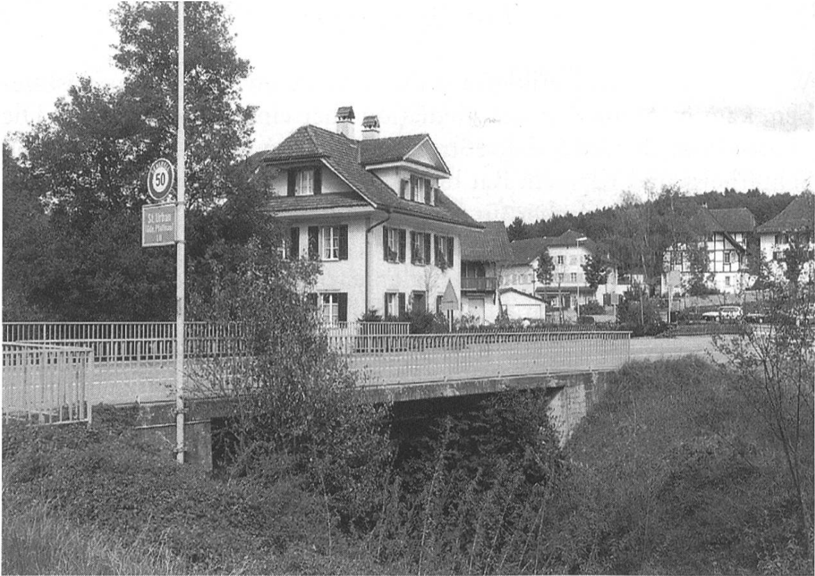
Diese Brücke über die Rot bei St. Urban stellte die Verbindung zwischen Bern/Solothurn und Luzern her. Das Gebäude in der Mitte war das Zollhaus.