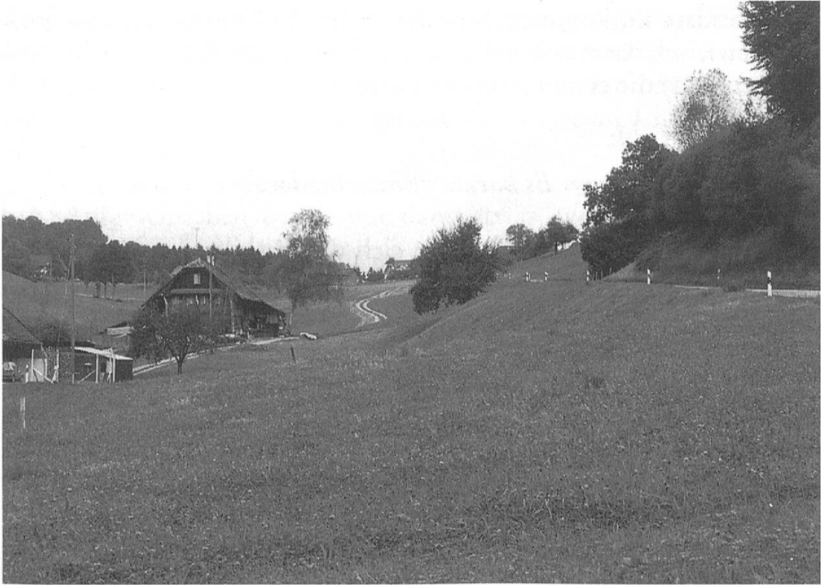
Von Zell gegen die Leimbütz. Rechts die heutige Kantonsstrasse. Die Güterstrasse links war der ursprüngliche Fahrweg.

auf Berner Boden geführt würde, könnte den «schädlichen Schleichhandel» begünstigen und die Zollabfertigung erschweren. Damit war endgültig entschieden, nur auf Luzerner Boden zu bauen. (Zur Diskussion stand in erster Linie ein Abschnitt zwischen St. Urban und Altbüron.)