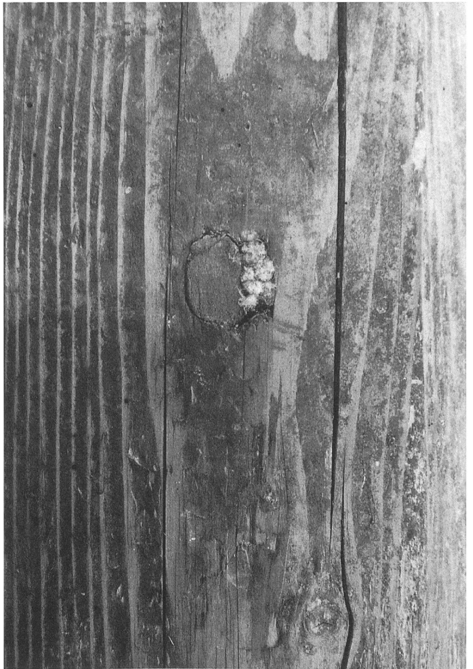
In Holzbalken verbannter Geist. Landwirtschafts- museum Burgrain.

kannte man den Hochsitzpfeiler, ein geschmückter und von den Seelen der Verstorbenen bewohnter Holzbalken, der im Ahnenkult eine wichtige Rolle spielte. Auch in unserem Volksglauben finden wir archaische Relikte vorchristlicher Totenkulte. Ruhelose Wesen bewohnen bestimmte Holzbalken oder werden in diese gebannt. In einem neuen Haus in Grossdietwil ging ein Geist um, der mit dem Bauholz eines abgebrochenen Gebäudes darin Einzug gehalten hatte. Der Leutpriester sperrte die umherirrende Seele in einen Balken. Dazu bohrte er ein Loch und verschloss die Öffnung mit einem geweihten Zapfen. 5