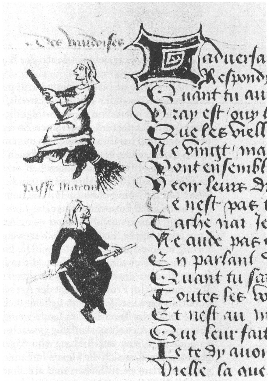
Besenreitende Hexen. Martin Le Franc, «Le Champion des Dames», 1451.

gen von seltsam und abnorm gestalteten Zweigen, die sich deutlich vom gesunden Teil der Bäume unterscheiden. Das dichte Gewirr verkrüppelter Zweige nannte man Hexenbesen, welche für die Schlupfwinkel von Feen und Hexen gehalten wurden. Entfernte man die Verwachsungen oder wurde das Bäumchen zurückgeschnitten, schadete man den darin wohnenden Wesen oder tötete sie. Die Astknäuel (wie auch die Misteln und Schmarotzerpflanzen an schlecht gepflegten Obstbäumen) nennt man Hexen- oder Donnerbesen. Ein alter Aberglaube besagt, sie seien aus dem Blitz entstanden. Ebenso soll das Haus, in dessen Ofen ein Donnerbesen verbrannt wird, vom Blitz getroffen werden. Die Hexenbesen, denen das Volk derart Respekt zollte, sind nichts anderes als die Folgen einer Pilzerkrankung, die