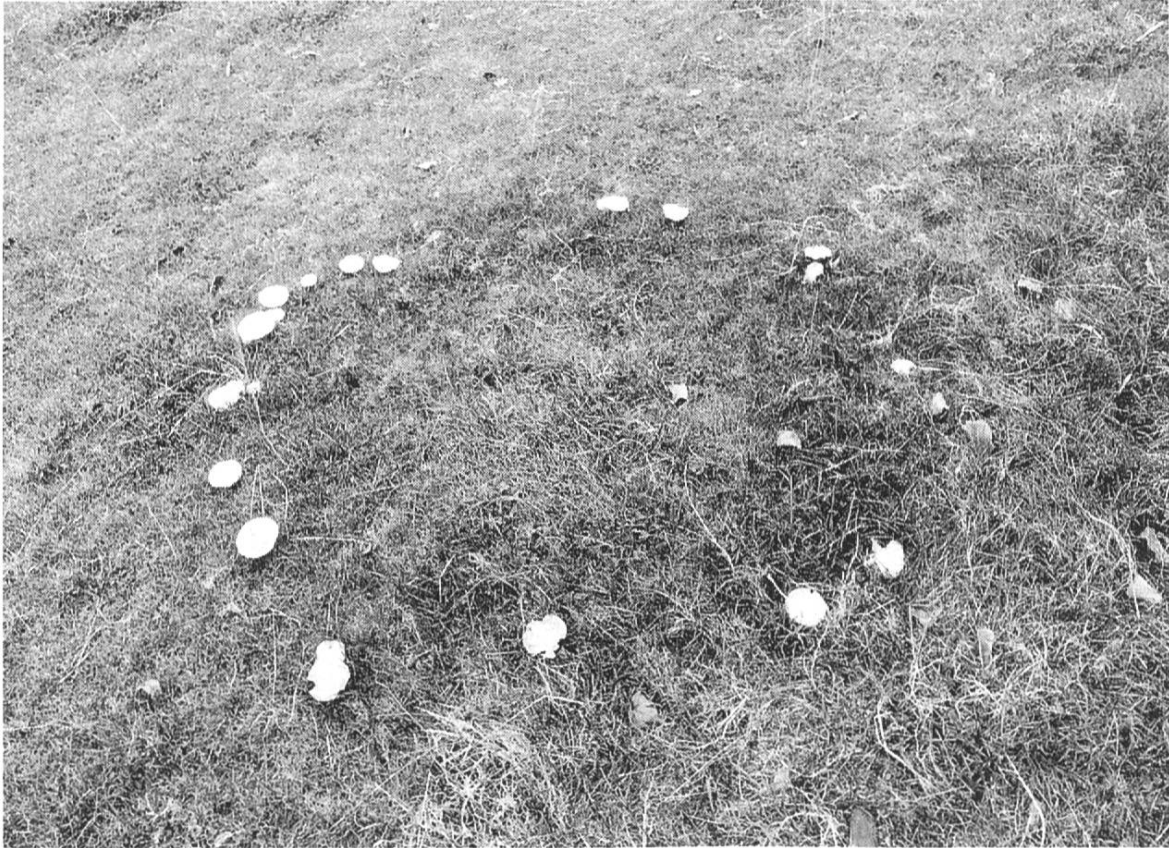
Hexenring. Mittler-Moos, Ruswil.

Auch andere Sagen geben uns Kunde von den Spuren nächtlicher Tänze, von roter und verbrannter Erde, dünnen Kreisen und dunklen Ringen, die sich an verwunschenen Plätzen um bestimmte Bäume ziehen. Es ist heute erwiesen, dass die seltsamen Ringe, von denen auch die Hexen in ihren «Geständnissen» so ausführliche Beschreibungen lieferten, mythisch umgedeutete Naturphänomene sind. Es handelt sich um Pilze, die im Spätsommer und im Herbst auf Wiesen und in Wäldern als «Hexenringe» oder «Hexenkreise» auftreten. Auch ohne Fruchtkörper (Pilze) fallen die Kreise dem Beobachter auf, da sich die Vegetation im Innern eines Hexenrings anders verhält als diejenige seiner Umgebung. Man hat den Eindruck, diese Stellen seien besonders gedüngt worden. Das Gras wächst höher und ist saftiger als es sonst der Fall ist. Im Jahre 1950 schilderte der Heimatforscher Dr. Hans Portmann, Escholzmatt, seine Beobachtungen: