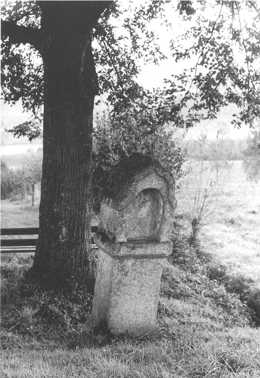
Baum und Bildstöcklein bei Ruswil. Symbol der Versöhnung von archaischer und christlicher Religion.

Im 18. und 19. Jahrhundert wurde ein Grossteil der Heiligen Bäume auf Geheiss der Regierung und gegen den Willen des Volkes weggeräumt. Nicht das Fällen eines von Feen und Ahnengeistern bewohnten Baumes erzürnte das Volk, sondern die Entheiligung einer Kultstätte, die man sich als eine christliche dachte. Den Geist der Aufklärung überdauert hat der Glaube, dass sich an diesen bevorzugten Stätten Gnade offenbart. Anstelle des Heiligen Baumes entstanden oft Bildstöcklein oder Kreuze: Die Weihe des Wallfahrtsortes geschah nicht durch das Heiligtum, sondern die besondere Bedeutung des Platzes hat es erst entstehen lassen.