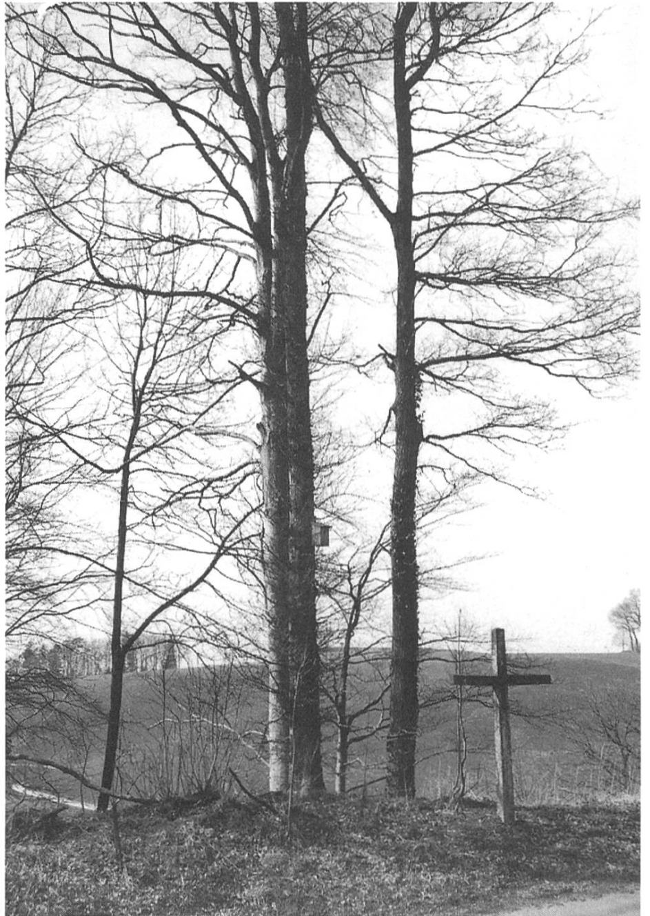
Kreuz bei der Ober-Gretti, Gemeinde Fischbach.

errichtete man ein steinernes Kreuz, an dem jenes Eisenkreuz angebracht wurde, das früher an der Tanne hing. Dieses Kreuz steht noch heute. Von einer besonderen Bedeutung im Volksglauben ist allerdings nichts mehr bekannt. Aber das in der Nähe stehende Wäldchen gilt immer noch als Aufenthaltsort unruhiger Seelen. Es wird erzählt, dass es in seiner Nähe mehrmals zu unliebsamen nächtlichen Begegnungen mit geisterhaften Wesen und gespenstischen schwarzen Hunden kam.