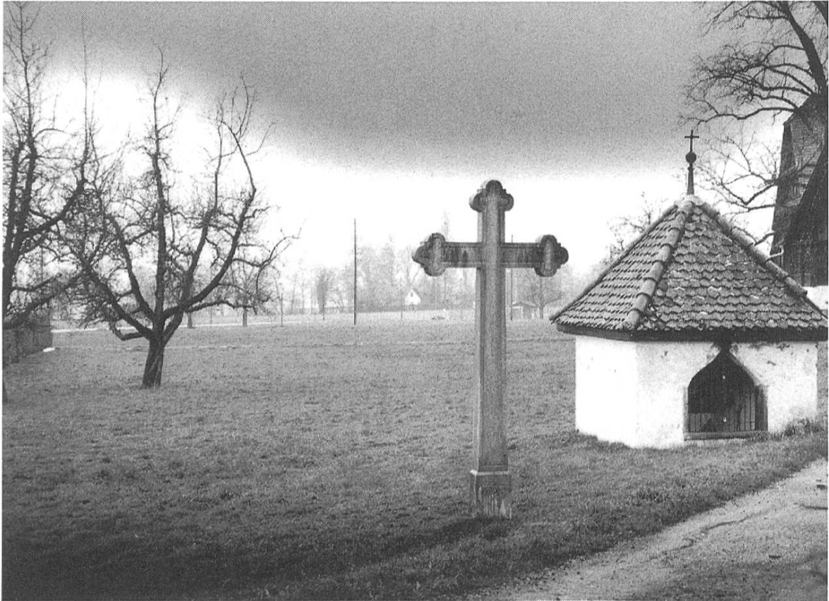
«Sträggelechäppeli» bei Sempach.

streckt, liefert es nicht der Nachthexe, sondern dem Tod aus. Das gleiche Motiv liegt auch dem bekannten Märchen Hänsel und Gretel zugrunde. Dort lauert die Hexe den verirrtten Kindern auf, die in der unbekanntem Wildnis absichtlich ihrem Schicksal, dem Tod, preisgegeben werden. Im übertragenen Sinn unternehmen die Seelen der Kinder eine Reise in eine Zwischenwelt. Sie entringen dem Tod (der Hexe) und kehren wieder ins Leben zurück.