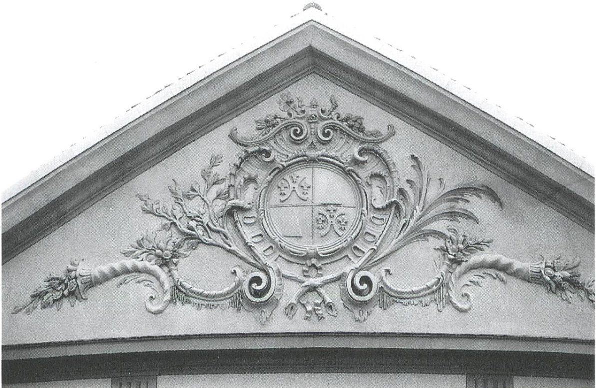
Das Tympanon des Gewächshauses, welches 1777–1780 von Abt Benedikt Pfyffer erbaut wurde.

Hauptmann Halbritter der Bewachungstruppen überwachte die Verpflegung in St. Urban.