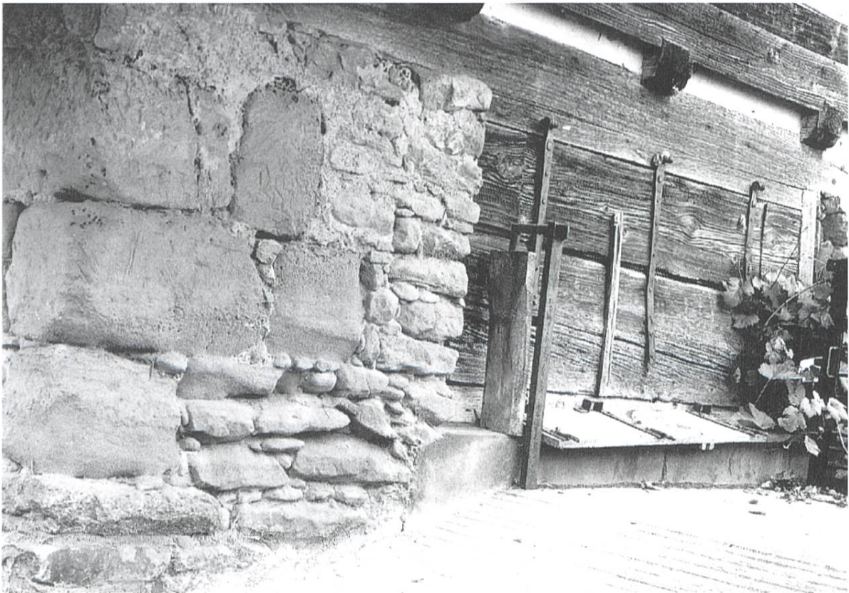
Abbildung 12: Äussere Teilansicht des Webkellers von der Westseite gesehen. Typisch für einen solchen Keller waren die seitlich in die Wände eingelassenen aufklappbaren Türen.

sein verdientes Lob gespendet. – Neben seiner Solidität und rechtlichen Aufführungen hat er sich noch wohltuend durch seinen Gewerbe als Leinwandfabrikant verdient gemacht, dass er in der Gegend von Altbüron durch Spinnen und Weben viele Hände in Bewegung setzte und so denselben ihr Stück Brod zu verdienen gab.» Hände, die davon offenbar besonders profitierten, scheinen der Familie Koffel in der Hintergasse gehört zu haben, denn bis auf den heutigen Tag trägt diese immer noch den Zunamen «s Wäber Möuke».