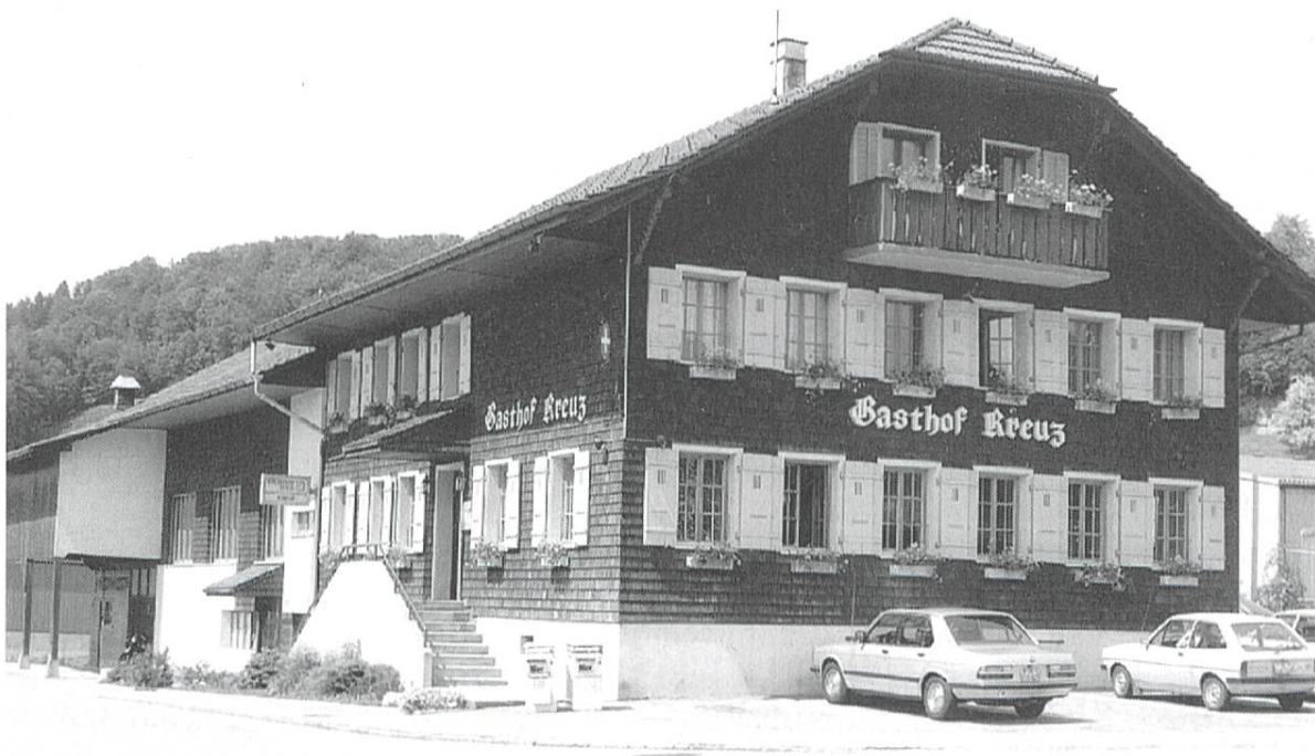
Abbildung 14: Der Gasthof Kreuz in Altbüron.

Der Schleichhandel suchte aber bald einmal die für die Kaufleute lästige Zollstätte zu umgehen und entdeckte rasch zahlreiche Schlupflöcher, was besonders für das im Norden und Westen grenznahe Amt Willisau galt. Zwischen 1677 und 1681 erhielt Hüswil (neben andern) und Ende der 1680er Jahre Mehlsecken eine Zollstätte. 1724 folgte Altbüron nach. Denn es war in Schwung gekommen, dass ausserkantonale Viehhändler ihr auf dem Markt in Geiss gekauft Vieh über den Bodenberg Richtung Altbüron und dann über die Grenze führten, um den Zoll in Reiden zu umgehen. Doch scheinen alle diese Massnahmen den Zollbetrug und die Nachlässigkeit der Zollaufseher nicht beseitigt zu haben. Deshalb wurde ab 1765 ein gestrafftes Zollregiment eingeführt. Entsprechend wurden in unserm Gebiet neu die Zollstellen von Luthern, Grossdietwil, Ludligen, St. Urban, Pfaffnau, Hinter- und Vordermoos (Reiden/Wikon) errichtet. Das Volk geriet darob in grosse Empörung. Als 1848 der Bundesstaat den Staatenbund mit seinen kantonalen Souveränitäten ablöste, fielen auch die kantonalen Zollstätten dahin. Ende des 18. Jahrhunderts waren es im gesamten Luzernbiet 36 (!) gewesen. Die Kartenskizze gibt davon ein sprechendes Bild (entnommen aus «Bevölkerung und Wirtschaft des Kantons Luzern im 18. Jahrhundert» von Hans Wicki).