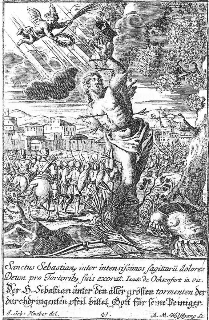
Abbildung 5: «Sanctus Sebastian». Barocker Kupferstich von Andreas Matthäus Wolfgang (1660–1736) nach einer Zeichnung von J. Seb. Hueber. Augsburg 1. Hälfte 18. Jh.

Ende des 17. Jh. wieder in den Hintergrund. Aus diesem Grund finden wir in den Andachtsbildern des 18. Jh. eine formenprächtige Bildsprache, die den Betrachter nicht nur aufrütteln und belehren, sondern das Erreichte auch vertiefen will.