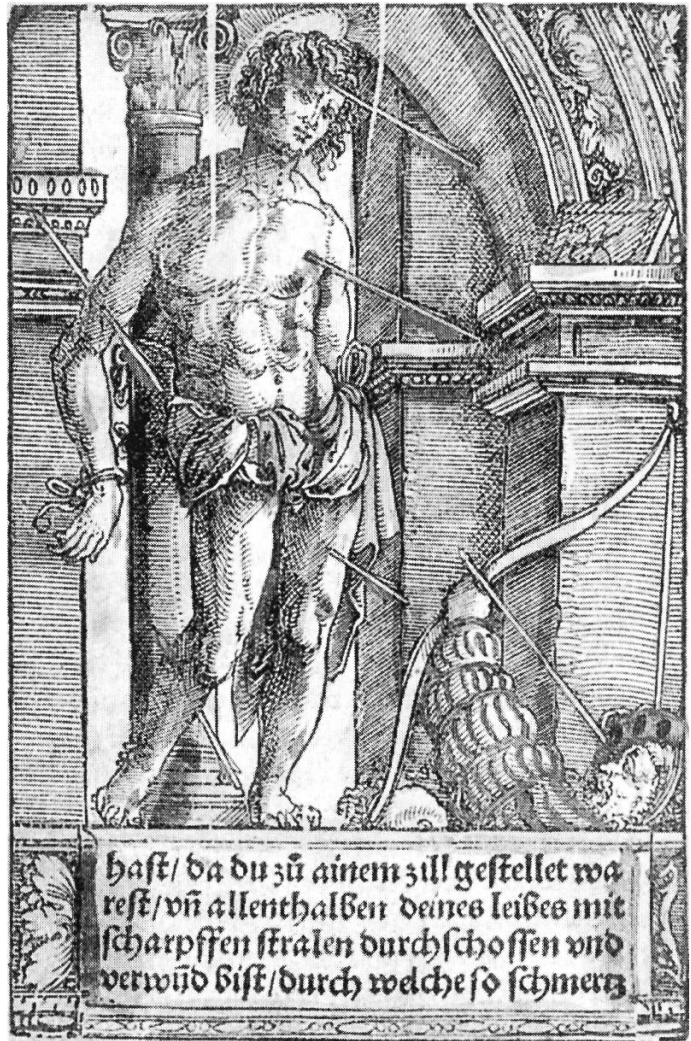
Abbildung 3: «Sankt Sebastian». Altkolorierter Holzschnitt aus dem «Hortulus Animae» von H. Springinklee. Druck von Friedrich Peypus für Johann Koberger. Nürnberg 1521. Beispiel für die naturgetreue Bildwiedergabe in der Renaissance.

bens, denen erst die Reformation ein Ende setzte. In den reformierten Orten führte die religiöse Erneuerung zur Loslösung von Rom; in den beim alten Glauben verbliebenen Gebieten mündeten sie in die innerkirchliche Gegenreformation. Das Konzil von Trient (1545 bis 1563) schuf auf katholischer Seite die Vorbedingungen zu einer langsamen Wiedererstarkung des alten Glaubens. Bereits im späten 16. und vor allem im frühen 17. Jh. lösten diese Bestrebungen eine neue Welle der Frömmigkeit aus, die sich in einer überschwenglichen Heiligenverehrung und einem aufblühenden Wallfahrtswesen äuserte. All das hat in der Druckgraphik seinen Niederschlag gefunden. Das Andachtsbild beschränkte sich jetzt nicht mehr ausschliesslich auf die bildliche Darstellung eines Heiligenlebens oder einer biblischen Szene. Obschon seine formalen Elemente schnell erstarrten und sich die verschiedenen Kunstrichtungen gegenseitig überschnitten, nahm das religiöse Kleinbild des 17. und 18. Jh. jetzt auch die Aufgabe der Glaubenserneuerung und Glaubensvertiefung wahr. Zur Erinne-