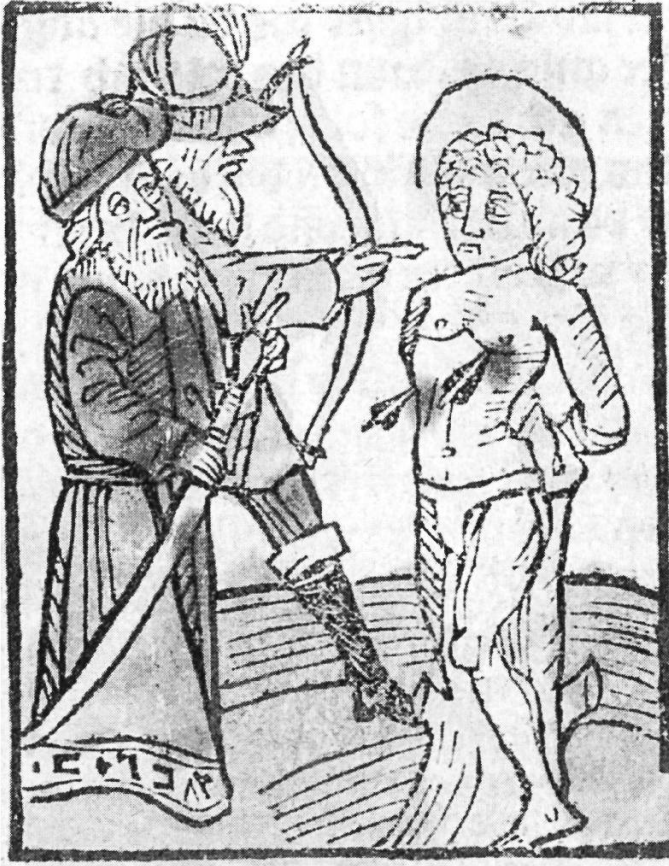
Abbildung 2: «Von sant Sebastiano». Altkolorierter spätgotischer Holzschnitt aus dem «Heiligen-Leben» des Jacobus a Voragine. Druck von Anton Sorg. Augsburg 1488.

Welt voll geistigen Zerfalls und religiöser Verflachung. Äussere Kennzeichen dieser Entwicklung waren die Abkehr vom mystischen Schrifttum des Mittelalters und die Hinwendung zur religiösen Gebrauchsliteratur, die sich in den Heiligenlegenden im wesentlichen auf die Schilderung von Lebensläufen und allgemeinen Belehrungen beschränkte. Da wird es verständlich, dass in diesem Umfeld das Andachtsbild keine seelische Erneuerung erfahren konnte, im Gegenteil. Die aus Italien und Frankreich kommende Ausrichtung auf die Antike bewirkte eine weitere Verflachung des religiösen Gehalts der Bilder. Dafür nahmen die naturalistischen Darstellungen überhand. Die Bevorzugung einer realen Formenwelt zeigt sich in einer detailgetreuen Abbildung des Geschehens; der hl. Sebastian erscheint nicht mehr als ein an einen Baumstumpf gefesselter, schemenhaft dargestellter Jüngling, sondern – anatomisch und historisch richtig – als kräftiger Soldat inmitten römischer Bauten. Im Vordergrund stand nicht mehr die spirituelle Aussage des Bildes, sondern die möglichst naturgetreue Darstellung der Handlung (Abb. 3).