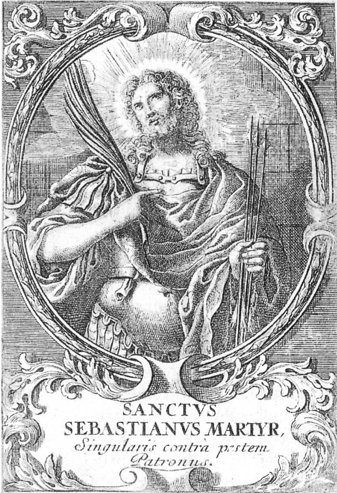
Abbildung 6: «Sanctvs Sebastianvs Martyr». Arbeit eines unbekanntes Stechers. Um 1780.

Ex 40,35 bedeutet die Wolke im Zelt die göttliche Gegenwart. (Adolf Reinle)