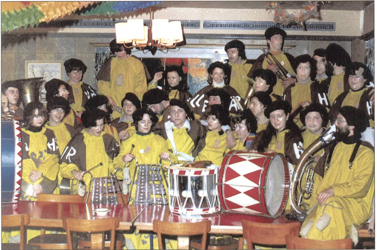
Die Gründungsmitglieder der Häppereschweller im Jahre 1978.

Dagmersellen die Umzüge der Uffiker und Buchser, welche jeweils am Gütisdienstag mit ihrem Umzug bis nach Dagmersellen kamen, eine Tradition. Bekannt waren schon in dieser Zeit der Umzug in Altishofen, der jeweils am Fasnachtssonntag stattfand, und jener in Reiden am Gütisdienstag. In diesen Jahren entstanden in den Nachbardörfern die ersten Guuggemusigen. Bekannt für uns Dagmerseller waren die «Schlömpf» von Reiden und ihr Fasnachtball, aber auch die Schötzer Guuggemusig «Latärnegugger» oder die Altishofer Guuggemusig, eine Gruppe aus der Pfyfferzunft.