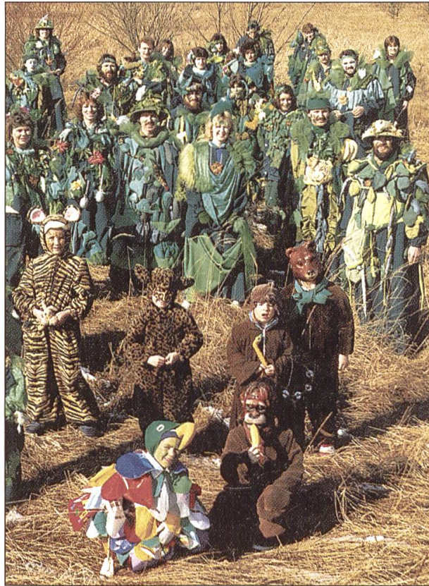
«Dschungel» hiess 1988 das Motto der Häppereschweller .

Adresse des Autors: Toni Huber Länggassstrasse 20 3012 Bern