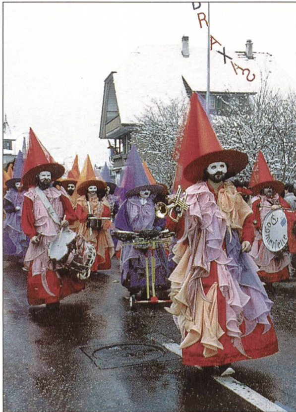
Abraxas Zauberwelt, 1991.