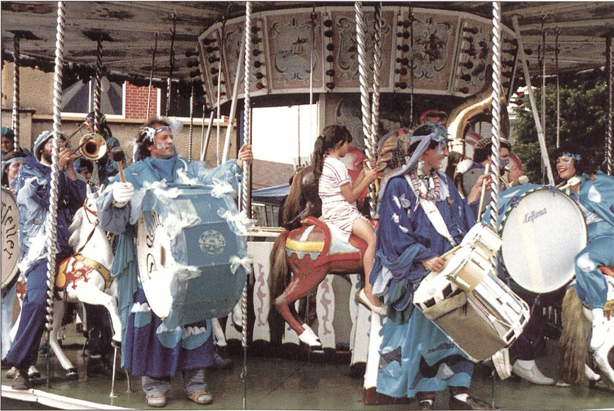
Die Häppereschweller auf dem Karussell in Poligny (Frankreich), 1986.

pereschweller waren an ihrer ersten Fasnacht an jedem Ball in Dagmersellen dabei. Am Schmutzigen Donnerstag organisierten sie zudem die erste Tagwache in Dagmersellen und am Güdisdienstag machten sie als einzige Guuggemusig am Umzug der Fasnächtler aus Uffikon und Buchs in Uffikon, Buchs und Dagmersellen mit. Natürlich durfte auch eine Plakette 4 nicht fehlen, denn sie sollte der Guuggemusig helfen, finanziell über die Runden zu kommen. Die erste Fasnacht war ein Erfolg für die Häppereschweller . Sie wurden als Guuggemusig in Dagmersellen sehr gut aufgenommen und hatten sich in geselliger Runde gefunden.