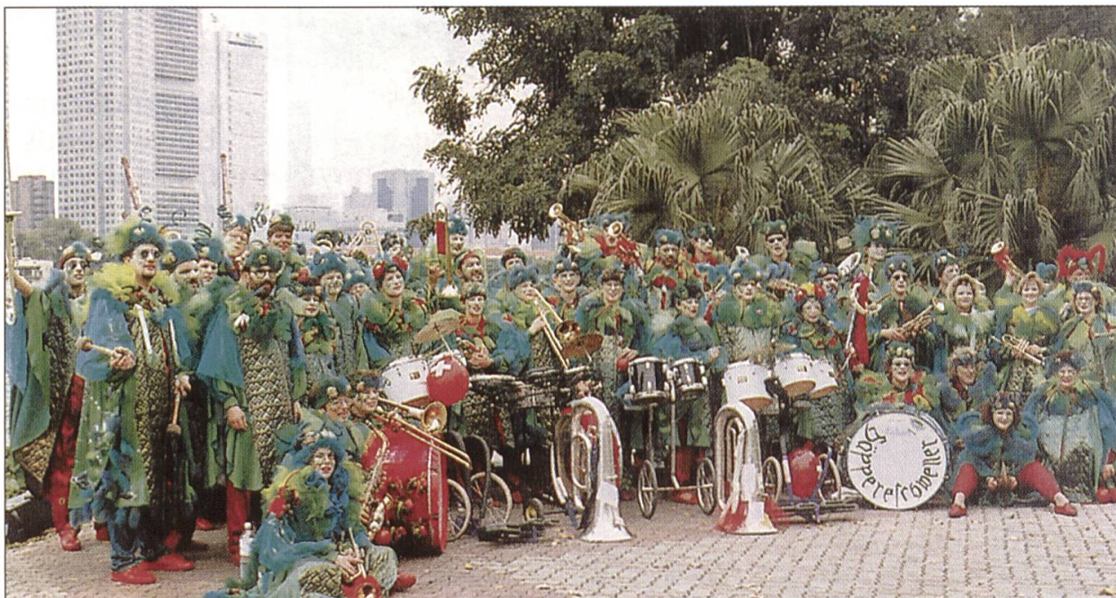
Häppereschweller in Singapur, 1995.