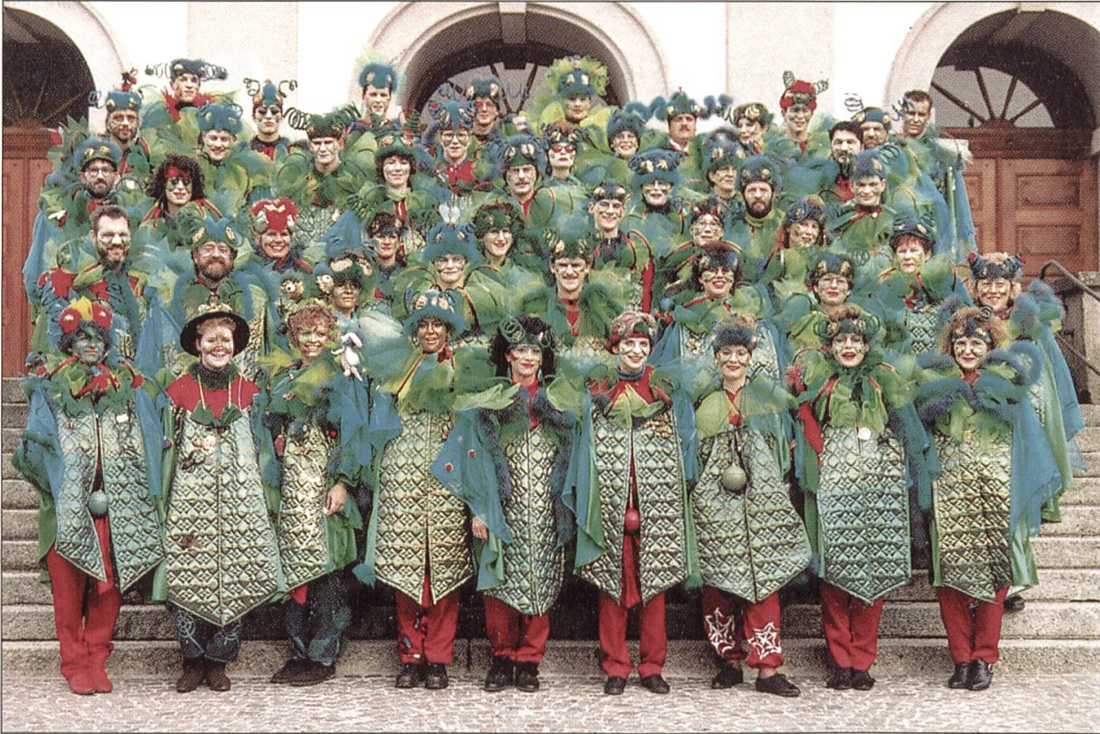
Die Häppereschweller im Jahre 1994.

ten sich zudem für die Wiederbelebung eines alten Brauches ein. Bis 1995 stellten die Häppereschweller allen Erstgeborenen in Dagmersellen ein Bäumli. Heute hat sich diese Tradition im Dorf gefestigt und wird von anderen Gruppierungen oder Vereinen fortgeführt. Nachdem mehrere Zünftlerinnen und Zünftler in die Häpperezunft aufgenommen worden waren, regelte die Guuggemusig Häppereschweller das Verhältnis zur Häpperezunft anders. Am 24. Januar 1987 wurde die Fasnachtsgesellschaft Häppereschweller mit den beiden Gruppierungen Guuggemusig Häppereschweller und Häpperezunft gegründet. 6 Mit dieser Änderung wurden die Zünftler und Zünftlerinnen zu gleichberechtigten Mitgliedern im Verein. Als Präsident der Fasnachtsgesellschaft wurde Ruedi Peter gewählt. An