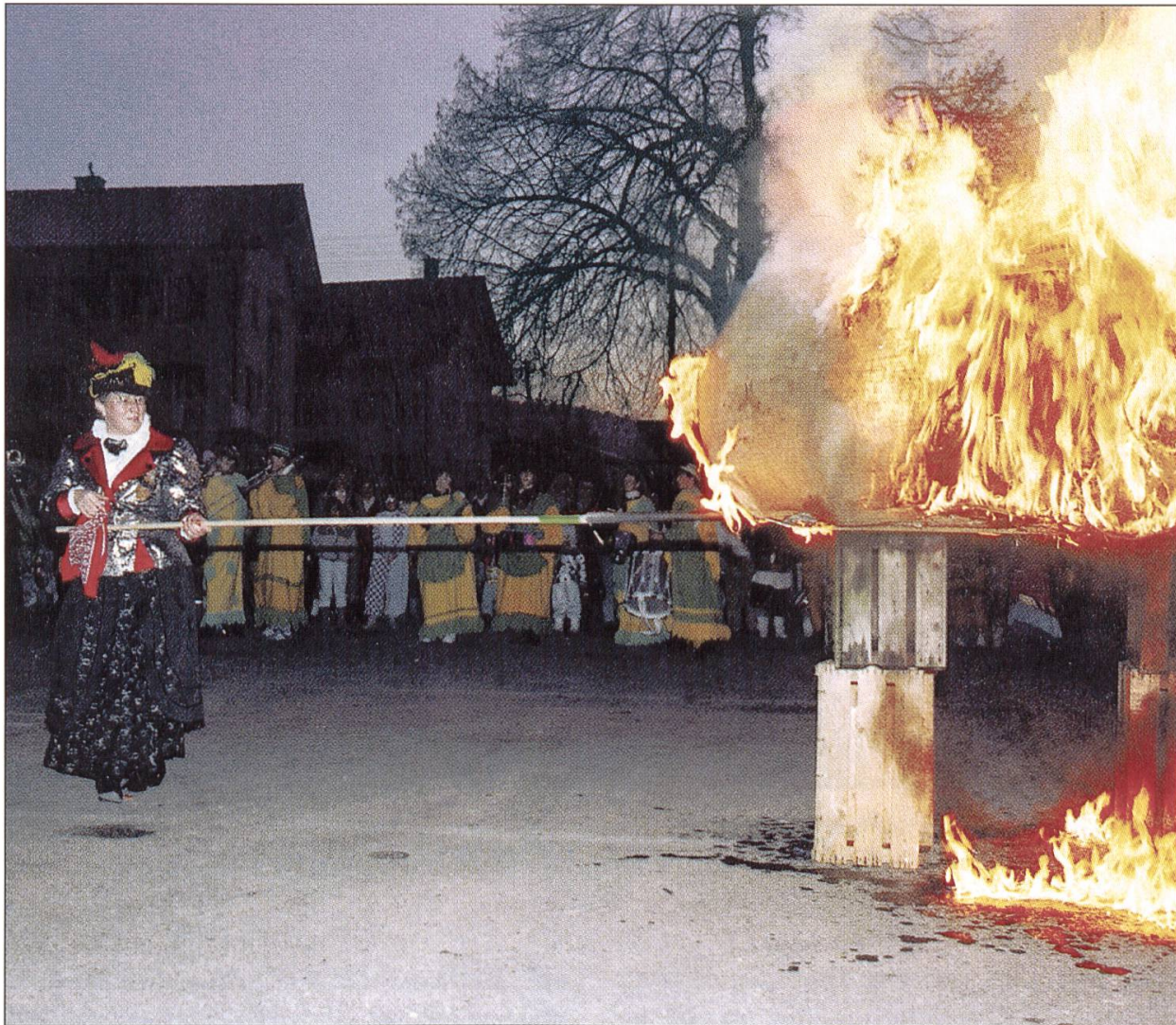
Palma I.: Häppereverbrennung 1988.

und brachten in Versform Geschichten vor. Offenbar sind diese nachbarschaftlichen Faschnachtsbesuche nicht immer friedlich verlaufen. Wenn der Alkohol die Zunge löste, begannen die Burschen sich gegenseitig aufs Korn zu nehmen, was oft Schlägereien auslöste. Von der Fasnacht in Dagmersellen in der ersten Hälfte des 20. Jahrhunderts ist uns wenig bekannt. Am bekanntesten war offenbar der grosse Turnerball der Nachkriegszeit, der Vorläufer des traditionellen Turnerballes. Seit Jahren führte auch die Musikgesellschaft einen Ball durch. Neueren Datums war der Skiball, er wurde in den 70er-Jahren