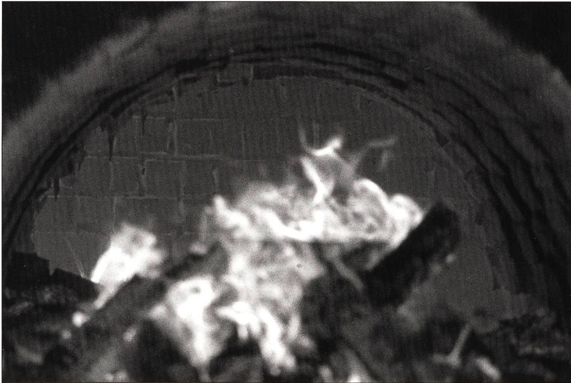
Abbildung 14: Das Gewölbe der Feuerungskanäle schmilzt an.

Am 8. September zündete er morgens den Ofen an, der nun zwei bis drei Tage lang mit ziemlich kleinem Feuer brennen sollte, um die Restfeuchte aus den Rohlingen auszutreiben. Bei diesem Vorgehen wandert der Verdampfungshorizont in den Rohlingen nach innen. Das Wasser darf aber nicht zu schnell ausgetrieben werden, da sonst die Gefahr besteht, dass die Stücke zerreißen. Je feuchter die Stücke sind, desto länger muss vorgeheizt werden. Die Verdampfung des Wassers wird dadurch sichtbar, dass Wasserdampfwolken über dem Ofen entstehen.