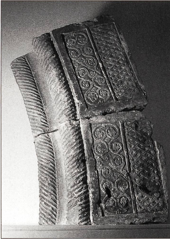
Abbildung 1 (links): Keilsteine mit Taustäben, vermutlich Gewändesteine. Hergestellt im ehemaligen Zisterzienserkloster St. Urban, Backsteinform «Typ 72», 13. Jahrhundert.