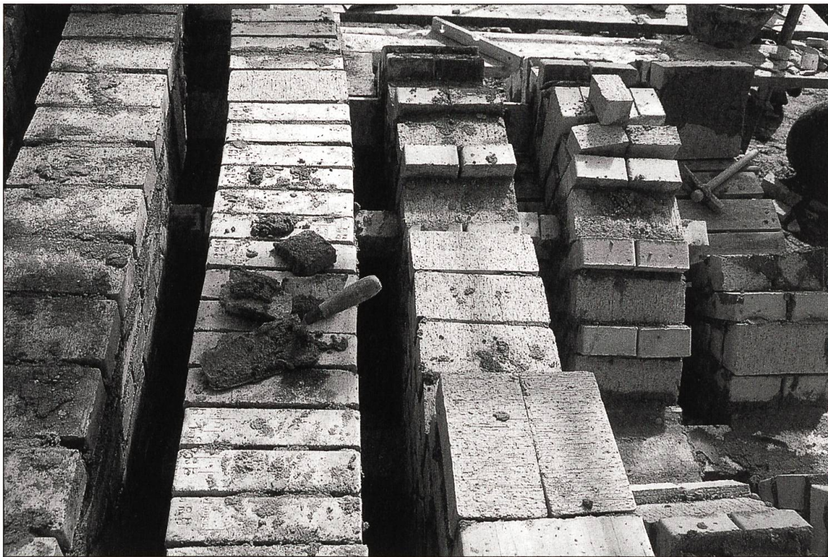
Abbildung 6: Der Kammerofen während des Baus. Blick auf den Herd. Rechts im Bild sind die Zwickel zwischen den das Gewölbe der Feuerungskanäle bildenden Bögen noch nicht ausgemauert.

genden Brennraum mit dem Brenngut durchschlagen konnten (Abb. 5). Damit ein ebener Herd, auf dem das Brenngut aufgeschichtet werden konnte, entstand, mussten die Zwickel zwischen den Längswänden und den Bögen so ausgemauert werden, dass die verschiedenen parallel laufenden Mauern waagrecht in gleicher Höhe abschlossen (Abb. 6). Von oben gesehen bestand der Herd aus den Maueroberkanten über den einzelnen Gewölbesegmenten mit dazwischenliegenden breiten Schlitten. Die Errichtung der Gewölbe und des Herdes waren der komplizierteste Teil des Ofenbaus. Danach mussten nur noch die Aussenmauern weiter hochge-