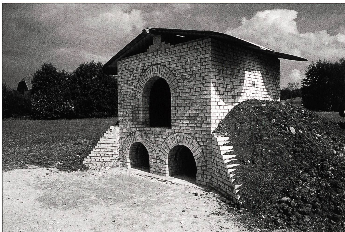
Abbildung 4: Der für das Experiment beim ehemaligen Kloster St. Urban nach mittelalterlichen Vorbildern erbaute zweizügige, oben offene Kammerofen.