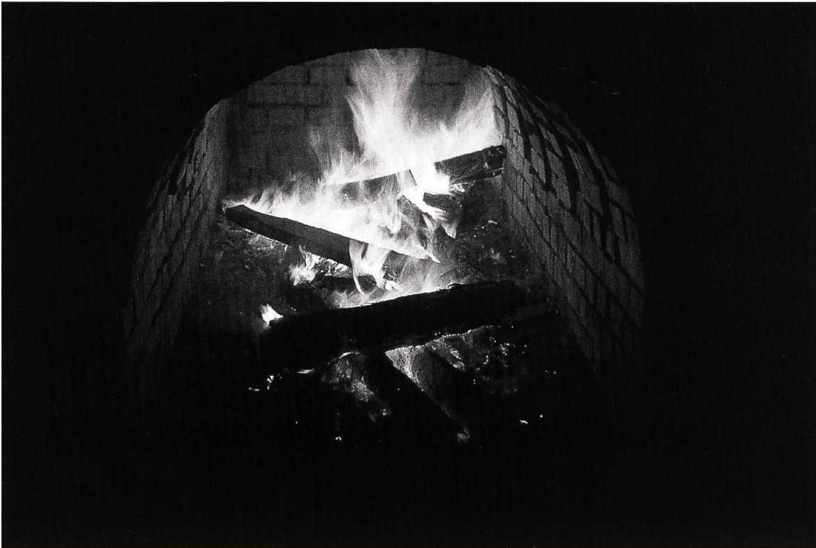
Abbildung 12: Das Brennholz sollte in einer Zickzacklinie im Feuerungskanal liegen.

Rohlinge stellten wir ausserdem 39 Bodenplatten 12 (30 cm × 30 cm × 6 cm) hochkant hinein, und zwar ordneten wir diese in der zweiten und dritten Lage an, um sie nicht direkt dem Feuer und den hohen Hitzeschwankungen auszusetzen (Abb. 10).