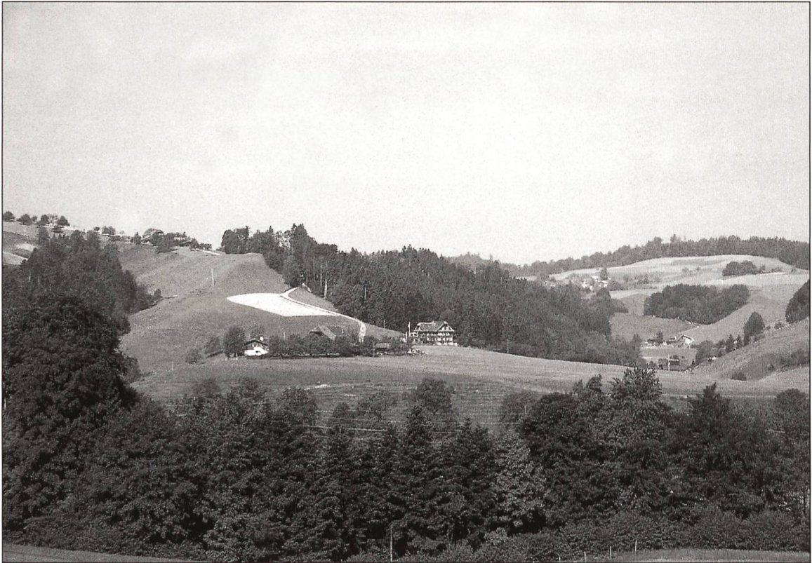
Lüttenberg. Das grosse Haus in der Bildmitte ist das ehemalige Schulhaus, wo die Waisenkinder der Breiten zur Schule gingen.

Tätigkeit der Schwestern zu kontrollieren: