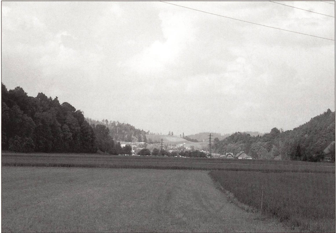
Blick von der Breiten Richtung Willisau.

Es mag Ihnen bekannt seyn dass in hiesiger Gemeinde ein Armenhaus mit ca. 9 Jucharten dabei befindlichen Lande besteht. Zu diesem Hause konnte aber, besonders in letzern Jahren, nicht einmal der vierte Theil der Unterstützungsbedürftigen aufgenommen werden, zumal schon im Jahre 1843 ca. 300 Personen ganz und theilweise unterstützt werden mussten, folglich eine grosse Summe für Hauszinsen etc. zu leisten war.