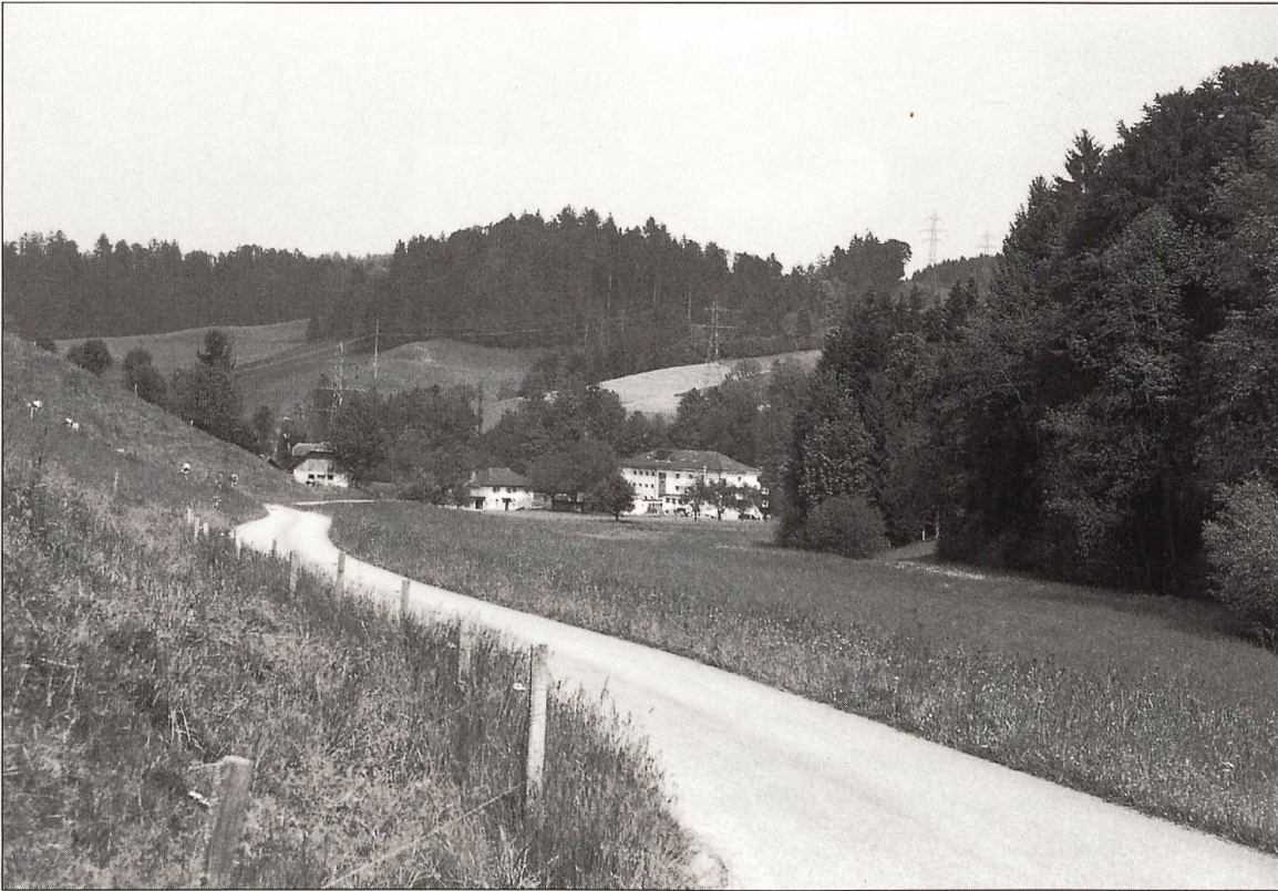
Das Heim Breiten von der nordwestlichen Talseite her gesehen.

auch Arbeit finden, das heisst, dasjenige was sie geniessen, selbst auch bepflanzen müssen. Auf diese Weise steht die Anstalt nicht nur da, um Leute darin aufzunehmen, sondern sie dient als Schreckmittel, die Leute vom Müssiggang und des Leichtsinns abzuhalten.