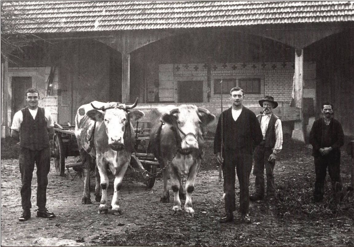
Ochsengespann vor der Breiten-Scheune, um 1930.

gerspital begeben. An der Krätze leidend (= Hautkrankheit, Scabies) war Theresia Kronenberg ins Spital verbracht worden. Der Gemeinderat verlangte vom Spitalarzt sofortigen Bericht über den Verlauf der Behandlung. Im Falle längeren Andauerns wolle man die Kranke in das Armenhaus bringen. In Zukunft dürften Krätze-Kranke und andere leicht Erkrankte nicht mehr ins Spital aufgenommen werden.