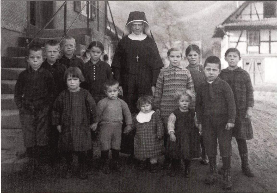
Die Kinderschwester mit ihren Zöglingen, um 1930.

des selbstgepflanzten Gespinnstes, sie sorgt für die standesgemässe Kleidung der Anstaltsgenossen, sowie für die religiös sittliche Haltung derselben, unter Beihilfe und Mitwirkung des Haushälters, überhaupt sorgt sie für alles, was im Interesse eines guten und weisen Haushaltes liegt, endlich erstreckt sich ihre Besorgung auch auf die Wäsche und den s. v. (= salva venia, mit Verlaub zu sagen) Schweinestall. Zur Bestreitung kleinerer Hausbedürfnisse wird der Vorsteherin durch den Direktor ein Vorschuss gemacht, worüber sie vierteljährlich Rechnung zu stellen hat. Bei Übernahme der Ökonomie wird ein Inventarium aufgenommen, das jährlich auf den 1. Jänner wieder ergänzt und so oft es beliebt, nachgesehen werden kann. Sie führt jedem Anstaltsgenossen