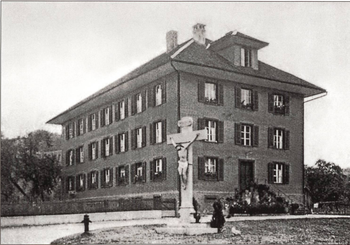
Die alte Armen- und Waisenanstalt. Abgebrochen 1959.