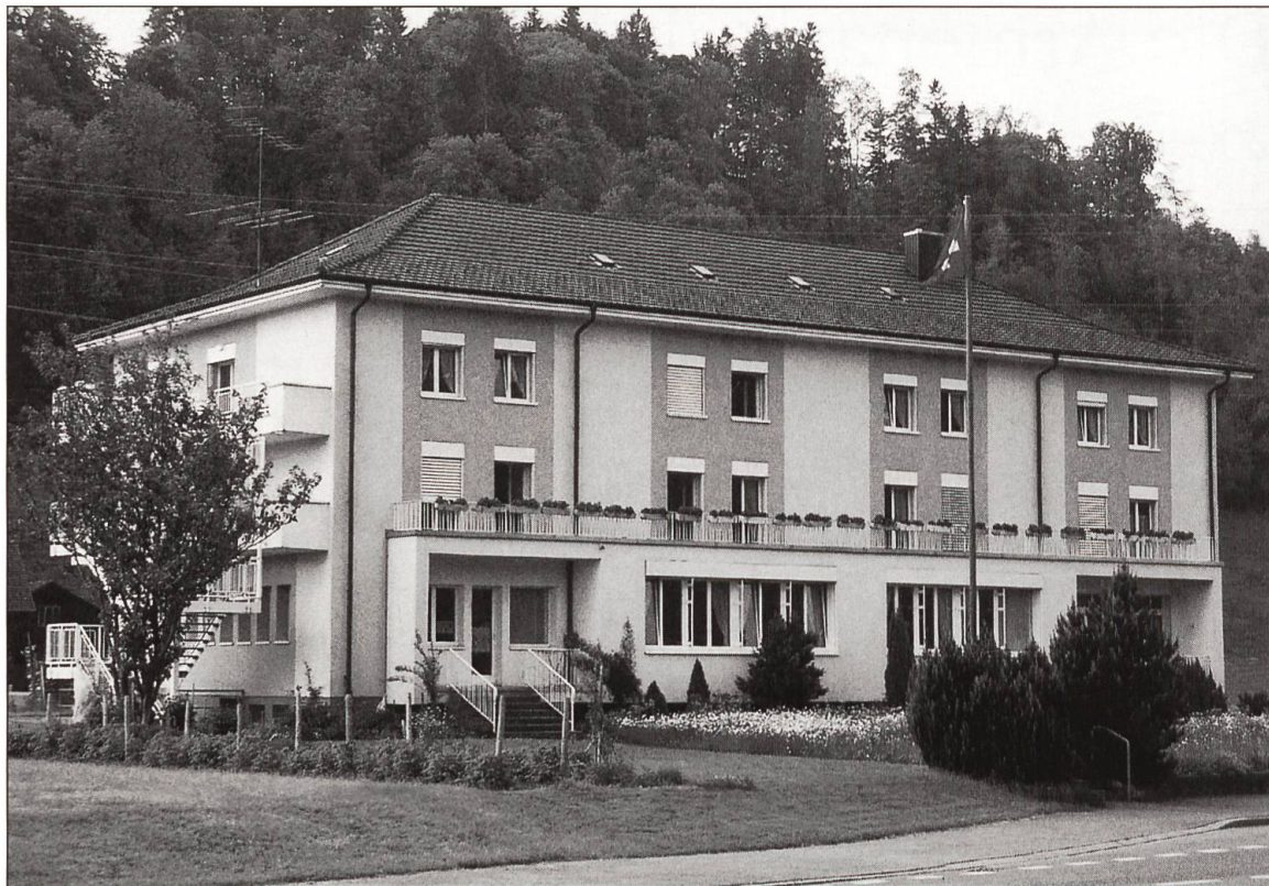
Das heutige Altersheim Breiten (2001).

endlich Grossrath Bättig, sog. Bättig Scheimatt. Gegen obigen Beschluss oder vielmehr gegen Erbauung eines Waisenhauses werden Unterschriften gesammelt, welche verlangen, es sollen beyde Waissenhäuser oder Liegenschaften beybehalten, und nicht gebaut werden, also doppelte Haushaltung führen, doppelte Aufsicht und Rechnung, o welcher Unsinn und Unvernunft! Ein gut gesinnter Geistlicher, Pfarrer, könnte doch viel Gutes wirken, wenn er nur wollte, schade, dass der gegenwärtige ein aristokratischer, herrschsüchtiger und gegen Gemeinnützigkeit handelnder Pfaff 1) ist.