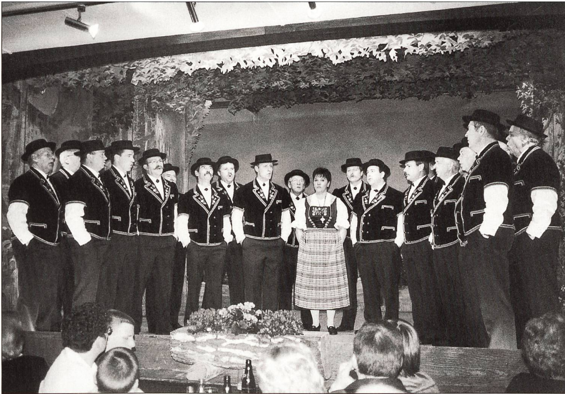
...und beim konzertanten Teil. Freude und Konzentration sind sicht- und spürbar.

Theaterspielen Individualisten. Und das Publikum lacht nicht nur wegen den Pointen, es amüsiert sich auch, weil es den Sepp, den Kari, s Marie und s Lisbeth aus dem ganz normalen Dorfleben her kennt, weil es beim einen oder anderen Monolog oder Dialog sogar Assoziationen zum tatsächlichen Alltag herstellen kann. «Typisch Sepp, genau e so verzöüt er amigs ou deheime, wenn er in Form esch», oder «s Marie bringt die urchige Froueytpe eifach guet, die wird ou deheime d Hose ahaa.»