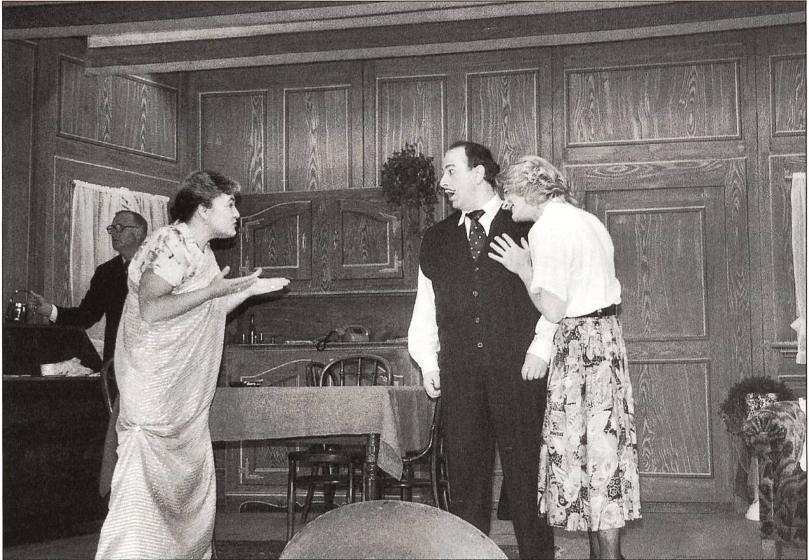
Die Gesten sitzen – der Jodlerklub Daheim, Hüswil, beim Theaterspielen ...