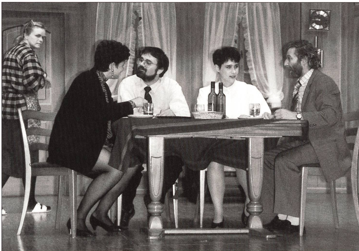
Typische Szene aus einem typischen Konzertabend: Hier spielen die Theaterleute des Jodlerklub Heimelig, Reiden, den Schwank «Ine gheit».