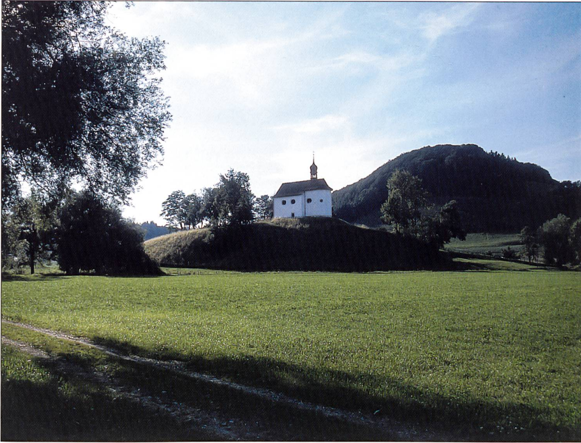
Architektur • Denkmalpflege