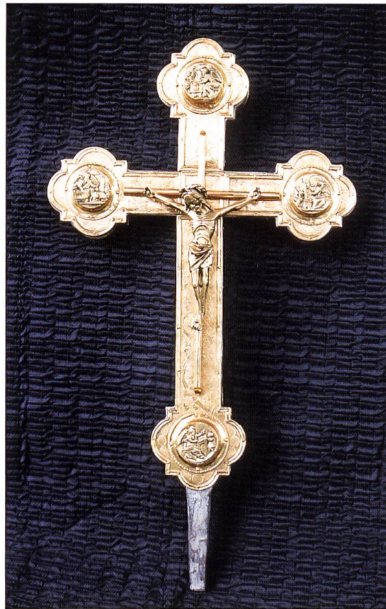
Auf dem gotischen Vortragekreuz sind in Medaillons die vier Evangelisten und Kirchenlehrer abgebildet.