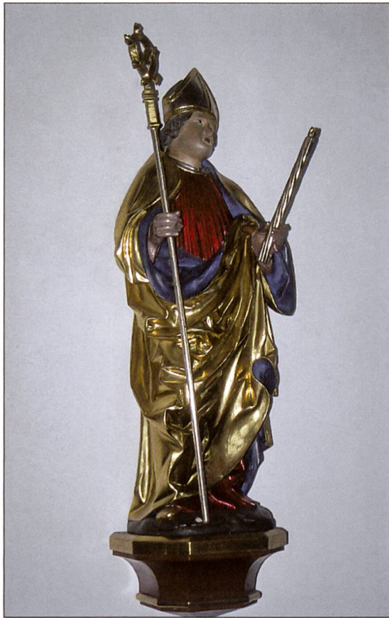
Die gotische Statue auf der Südseite zeigt den heiligen Blasius.

festgehalten: Man sieht, wie ein Pferd «durchbrennt», wie ein Holzfäller unter eine stürzende Tanne gerät, wie das Hochwasser kommt, wie ein brennendes Haus die Nachbarschaft gefährdet. Es wurden aber auch Situationen im menschlichen Leben dargestellt, die nicht mit einer akuten Gefahr zu tun haben, zum Beispiel Wöchnerinnen mit ihren Neugeborenen. Nicht nur für Menschen machte man Gelöbnisse; auch der Viehbestand wurde miteinbezogen.