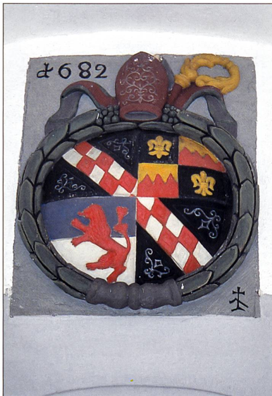
Die Tafel über der Eingangstüre aus dem Jahre 1682 verweist auf den Erbauer der Kapelle, das Kloster St. Urban.