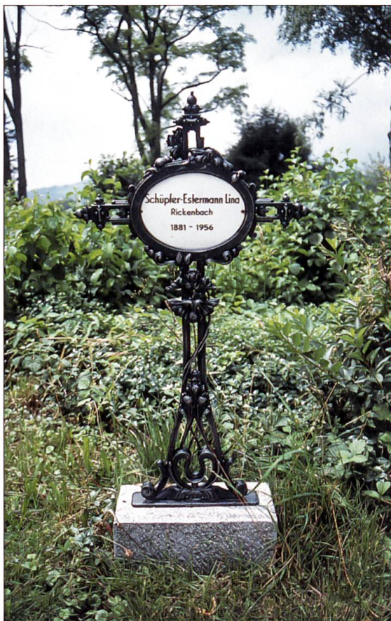
Eines der beiden noch erhaltenen Grabkreuze aus Gusseisen. Das auswechselbare Emailschild ermöglichte eine mehrmalige Verwendung.

Friedrich Stirnimann, Ettiswil. Das ursprüngliche Hauptblatt mit einer für Hügel- und Burgkirchen typischen Darstellung des heiligen Michael ist verschollen.