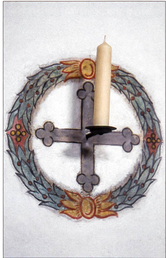
Einer der zwölf Wandleuchter im Kirchenschiff, welche die zwölf Apostel versinnbildlichen und in ihrer Ornamentik das Wesen der Wallfahrt zusammenfassen.