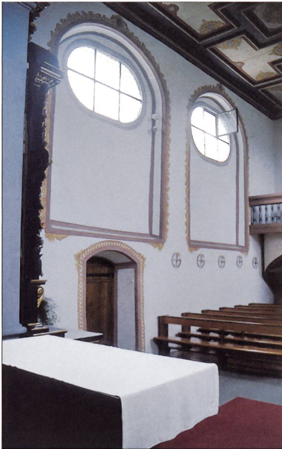
An den Längsseiten des Schiffes liegen in hohen Nischen mit gedrücktem Bogen die querovalen Fenster, auch «Okuli» genannt.

lich in seinem Namen eine Kerze zu seinem Gedächtnis zu opfern. Kreuzfahrer sollen später seine Reliquie ins Abendland gebracht haben. Das Haupt des Heiligen wird in der Domkirche von Trier in einem Schrein aufbewahrt und jeweils am 3. Februar zur Verehrung ausgestellt. Reliquien kamen auch nach St. Blasien im Schwarzwald. Die dortige Benediktiner-Abtei hatte viele grundherrliche Beziehungen zum Luzerner Hinterland. Es ist deshalb nicht ausgeschlossen, dass das Luzerner Hinterländer Blasiusheiligtum in Alberswil sein Patrozinium diesen Beziehungen verdankt.