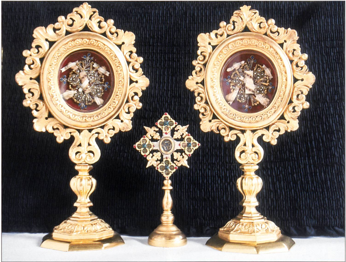
Bild oben: Zwei Reliquiare und ein Wettersegenkreuz sind Zeugen der Volksfrömmigkeit.

Bild rechts oben: Das «Bläsi» steht auf einem Moränenhügel unterhalb der Burgruine Kastelen und dem Schloss Sonnenberg sowie in unmittelbarer Nähe des Schweizerischen Landwirtschaftsmuseums Burgrain.