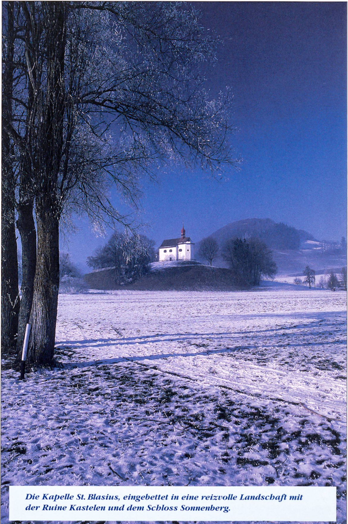
Die Kapelle St. Blasius, eingebettet in eine reizvolle Landschaft mit der Ruine Kastelen und dem Schloss Sonnenberg.