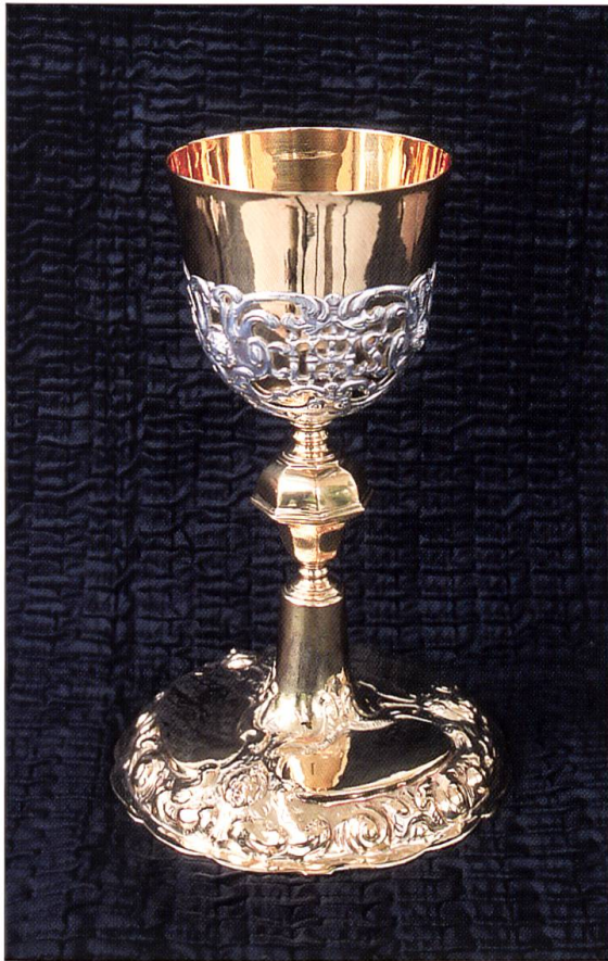
Der frühbarocke Kelch mit silbernem Korb stammt aus der Mitte des 17. Jahrhunderts.