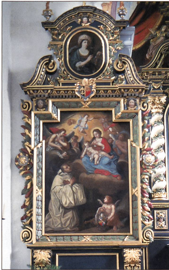
Der nördliche Seitenaltar zeigt den heiligen Bernhard und eine Erscheinung der Muttergottes, im Oberblatt die heilige Katharina.

men. Die Geschichte des Ordens belegt ohnehin, dass die zisterziensische Innerlichkeit ganz im Zeichen der Mystik, der Askese und der ‚Ecce-Homo‘-Frömmigkeit stand.»