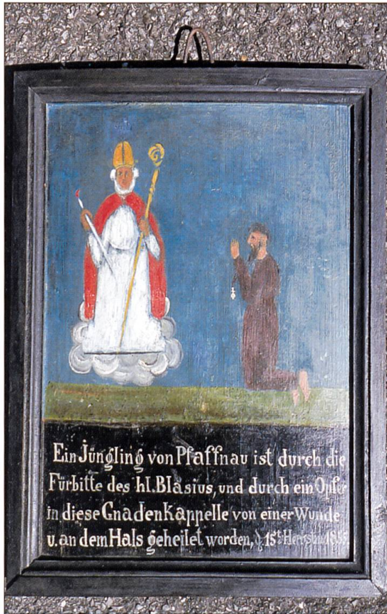
Eine der wenigen erhaltenen Votivtafeln, 1855.