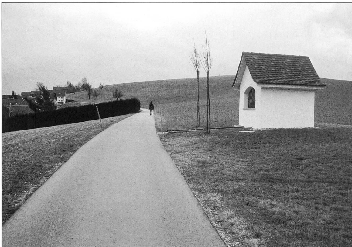
Abbildung 21: Die heutige Wegkapelle am asphaltierten Verlauf der Altstrasse.

rich von Augsburg. Hrsg. von M. Weitlauff. Verein für Augsburger Bistumsgeschichte. Jb. 26/27: 391 bis 404. [Weissenhorn].