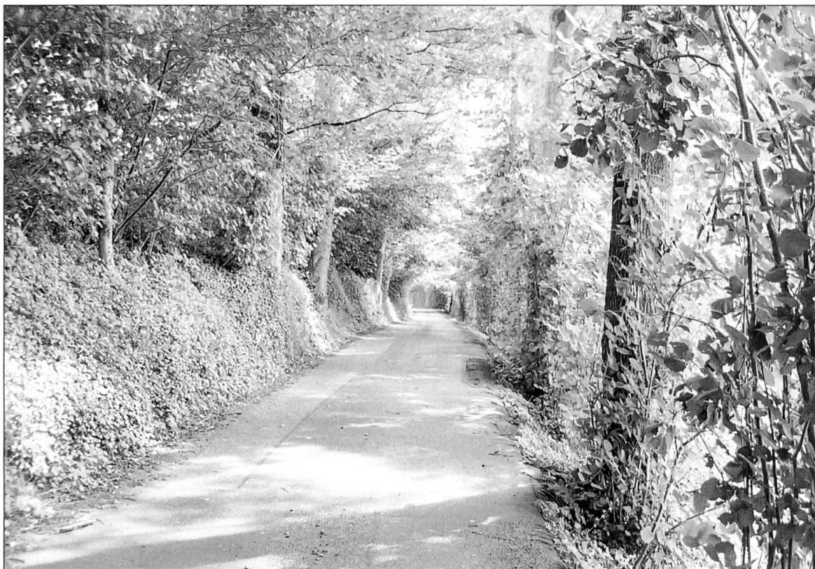
Abbildung 5: Blick in das asphaltierte Teilstück der alten Landstrasse. Eichen und Heckensträucher bilden gleichsam ein Dach über dem Strassenverlauf.

de. «Es ist dies das gleiche Jahr, in dem der Kreuzgang der Stadt Luzern nach Ettiswil stattfand. Dieses Zusammentreffen scheint mir nicht ganz zufällig zu sein. ... Dass es sich bei diesem Kreuzgang ganz offensichtlich um eine Massenwallfahrt handelte, geht daraus hervor, dass auch aus anderen Kantonen anscheinend offiziell nach Ettiswil gewallfahrtet wurde» (Glauser 1974: 61, 59). Anders als Glauser kommen wir jedoch zum Schluss, dass im Spruch von 1456 lediglich die Strasse von Luzern über Ruswil nach Willisau (LU 26.1) explizit zur Landstrasse erhoben wurde und noch nicht die Fortsetzung von Ruswil nach Ettiswil (LU 27.1). Denn im Spruch wurden die Rothenburger angehalten, dass, wenn sie diesseits von Willisau, in Buttisholz, Grosswangen oder