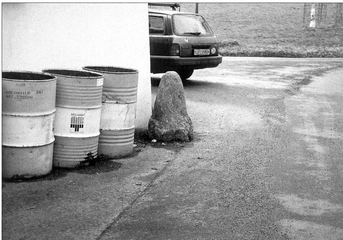
Abbildung 10: ... und der Radabweiser in Breiten an der gleichen Strassenlinie.

gegebene, grosszügig ausgestaltete Kapelle und gilt als einer der reizvollsten sakralen Kleinbauten, welche das 17. Jahrhundert in der Innerschweiz geschaffen hat. Als Ort einer lokalen bis regionalen Wallfahrt steht seit Beginn insbesondere die Heilung von Sehbeschwerden und Augenkrankheiten im Vordergrund (Raeber 1989).