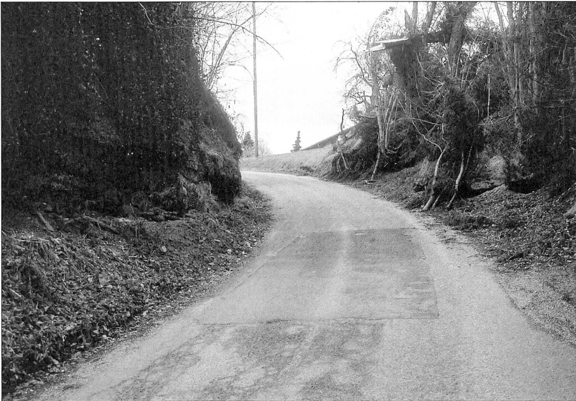
Abbildung 20: Blick in das Hohlwegsegment bei Ober-Wellbrig. Die Passage ist vermutlich künstlich erwirkt. Im 20. Jahrhundert dürfte sie verbreitert worden sein (Kreuzungssituation).

Jahrzeitbuch Altishofen 1500: Staatsarchiv Luzern, FA 29/9.