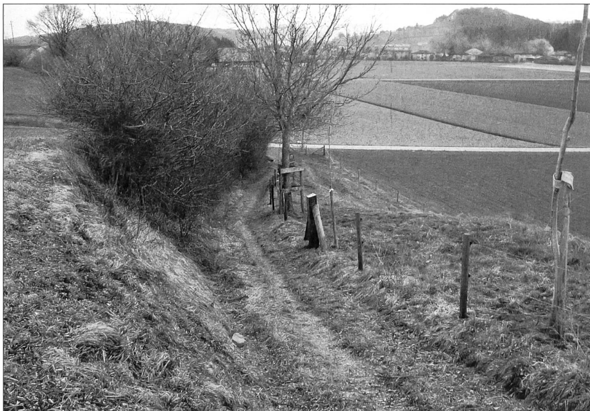
Abbildung 17: Das reaktivierte Teilstück im Aufstieg vor Moos. Ausser dem Verlauf ist auch die talseitige Böschung durch eine Anpflanzung aufgewertet worden.

ris (Abb. 18) und ein undatiertes Holzkreuz zwischen Moos und Bifig auf.