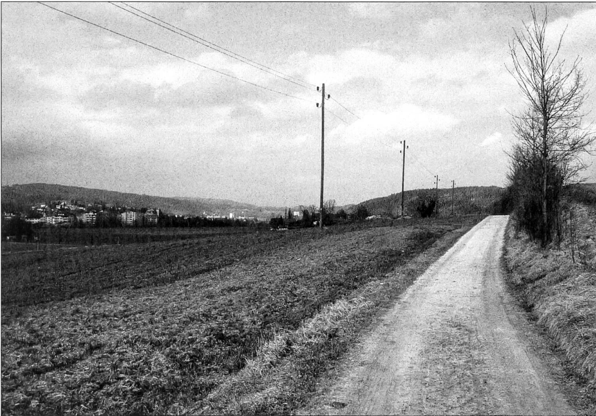
Abbildung 16: Die alte Landstrasse in ihrem Verlauf Richtung Schötz, zur Zeit der Vegetationsruhe.

Geschehen mit einem Aufruf zu Rechtgläubigkeit, Pfarrherrengehorsam, Rutenzucht und gegen die Hurerei beendet (Mitteilung des Ettiswiler Vikars in Lütolf 1862: 28 f.), in eine zweite, die das pralle, vieldeutige Ereignis bei der Beschlagung stehen lässt (vgl. Vertonung des Liedes in Hostettler, Mentha, Diem 1994), und in eine dritte, die die Handlung im Umfeld der sexuellen Gewalt, der Unterdrückung der Frau, aber auch der Sinnlichkeit neu erzählt und verschlüsselt die Frage stellt, warum das Opfer auch noch die Schuld einsehen müsse (Ineichen 1990: 167 f., 220 f.).