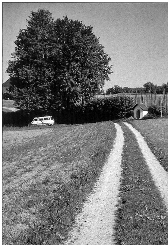
Abbildung 8: Landstrasse und die Wegkapelle vor Ober-Rot, die mit der Jahrzahl 1612 datiert ist. Sie bildet eines der vielen sakralen Kleinelemente, die sich entlang der alten Landstrasse und der Ettiswiler Wallfahrt gleichsam aufgereiht haben.

telbarem Zusammenhang mit der im 15. Jahrhundert einsetzenden Ettiswiler Wallfahrt entstanden.