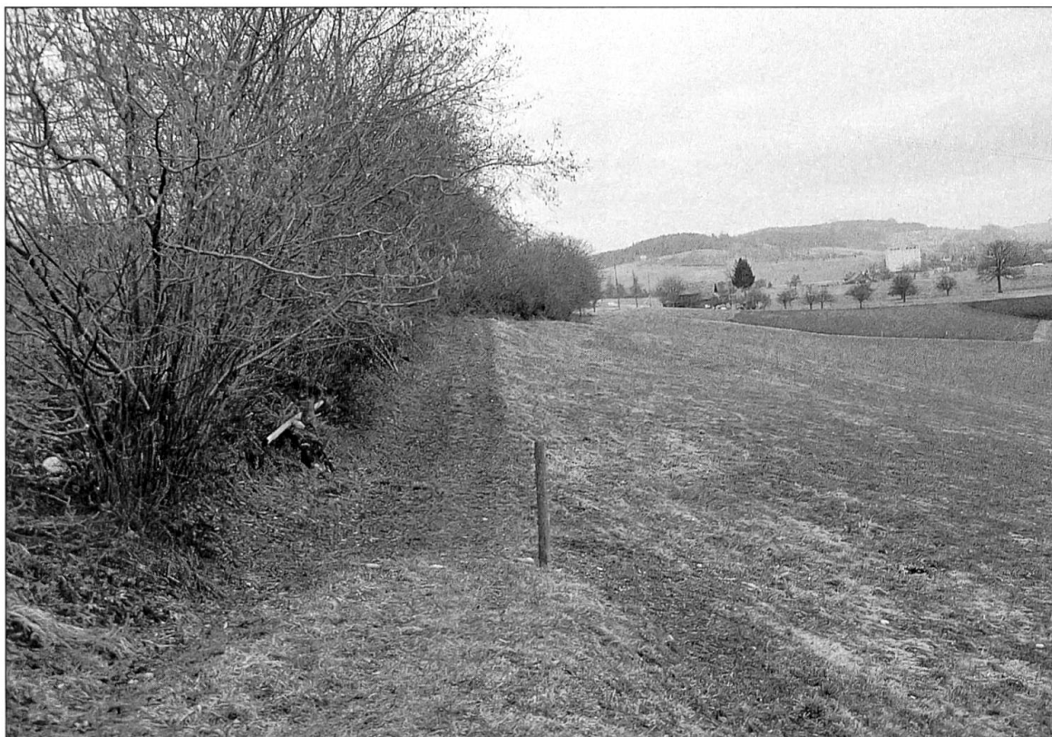
Abbildung 11: Blick auf die gegenüber der Ebene erhöht verlaufende alte Landstrasse vor Gishubel.

Eichenbestand stabilisiert mit ausholendem Wurzelwerk die erdigen Böschungen. Das Trassee weist eine Breite von 2,5 Meter auf und ist asphaltiert. Ausprägung und Erscheinungsbild erinnern stark an das Segment der alten Landstrasse in LU 26.1.7.