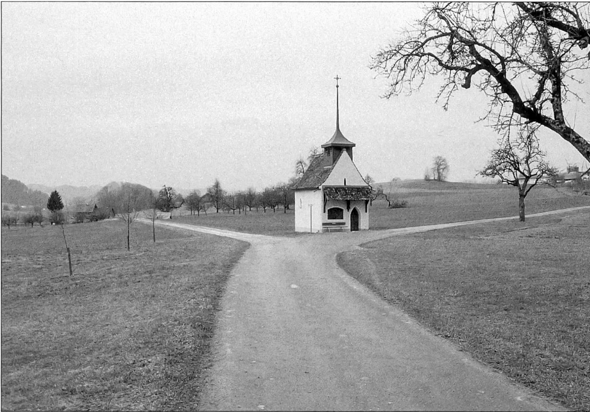
Abbildung 12: Die Kapelle St. Anna, eine weitere Station an der alten Landstrasse. Der Abschnitt LU 27.1.7 zieht in Blickrichtung links an der Kapelle vorbei.

Bezug auf die Wegachse nehmen die Kapelle St. Gallus und Othmar in Oberrot (Abb. 9) und ein undatiertes, steinernes Kreuz bei Breiten. In der Hofgruppe von Rot, die im 13. Jahrhundert nachgewiesen ist, wird im Jahre 1275 die Kirche von Rot als eigene Pfarrei erwähnt. 1575 fand eine Neueinweihung, 1690 ein vollständiger Neubau oder Umbau statt (KDMLU IV: 217; zur Frage des römischen Gutshofes im Bereich der Kapelle siehe LU 27.1).