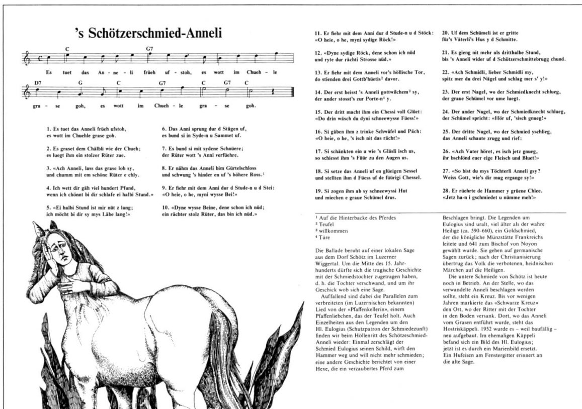
Abbildung 15: Die zweite Version der Schötzerschmied-Anneli-Geschichte (Hostettler 1979: 24 f.).