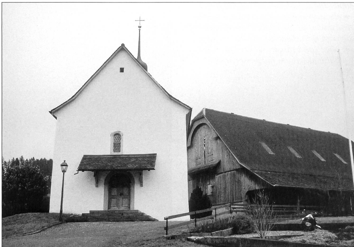
Abbildung 9: Die Kapelle von Ober-Rot, ein sakraler Wegbegleiter am Verlauf der alten Landstrasse...