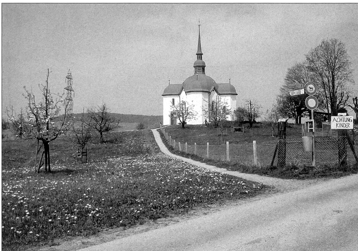
Abbildung 4: Die Wallfahrtskapelle St. Ottilien und die in ihrem Verlauf an ihr vorbeiführende Landstrasse, die hier in ihrer Breite auf eine Fusswegverbindung verschmälert ist.

werden. Festzustellen ist, dass die Bezeichnung als «Hochstrass» von der Ersterwähnung im Jahre 1456 an als Flurbezeichnung und nicht als Strassenname erfolgt. Ein erster Beleg für eine eigentlich Strasse auf dem Hoostris liegt im Jahre 1500 vor: In einem Jahrzeitbuch ist von der «stras die uff das hostris gatt» die Rede (Jahrzeitbuch Altishofen 1500: 36a). Knapp hundert Jahre später ist auf dem Hoostris von der «Landtstrass die Rede (Bodenzinsurbar Rathausen 1593/94: 32b). Ebenfalls im Jahre 1500 ist beim anderen Höhenzug, dem Ober-Wellbrig zwischen Schötz und Nebikon (LU 27.1.10), von einer «stras die Rede (Jahrzeitbuch Altishofen 1500: 51b). Punktuelle Belege für die Strassenlinie sind in der Folge mit Hilfe der Unterlagen von Rimoldi (1988) gehäuft