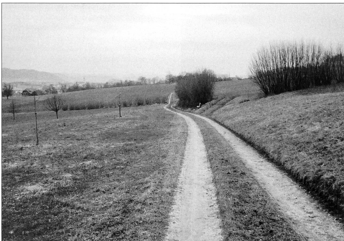
Abbildung 6: Die Fortsetzung der alten Landstrasse im substanziellen Gehalt einer Schotterstrasse, kurz vor dem Einsetzen der bergseitigen, beckenbewachsenen Böschung...

sie zu einer namhaften Einnahmequelle geworden war» (Wicki 1992/93: 393).