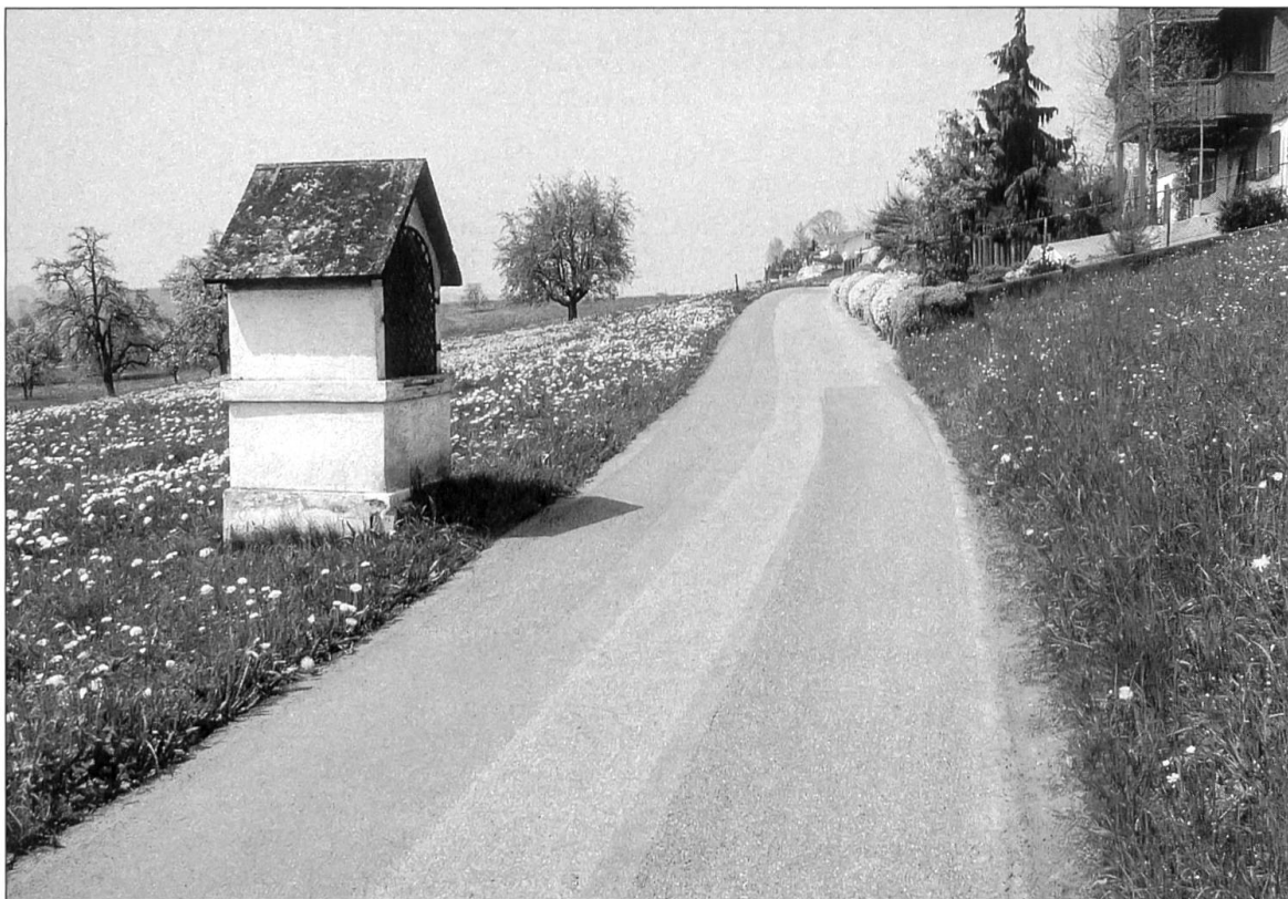
Abbildung 1: Blick auf den Verlauf der alten Landstrasse Richtung Wigarten mit dem Bildstock, der in seiner heutigen Ausführung 1855 errichtet wurde.