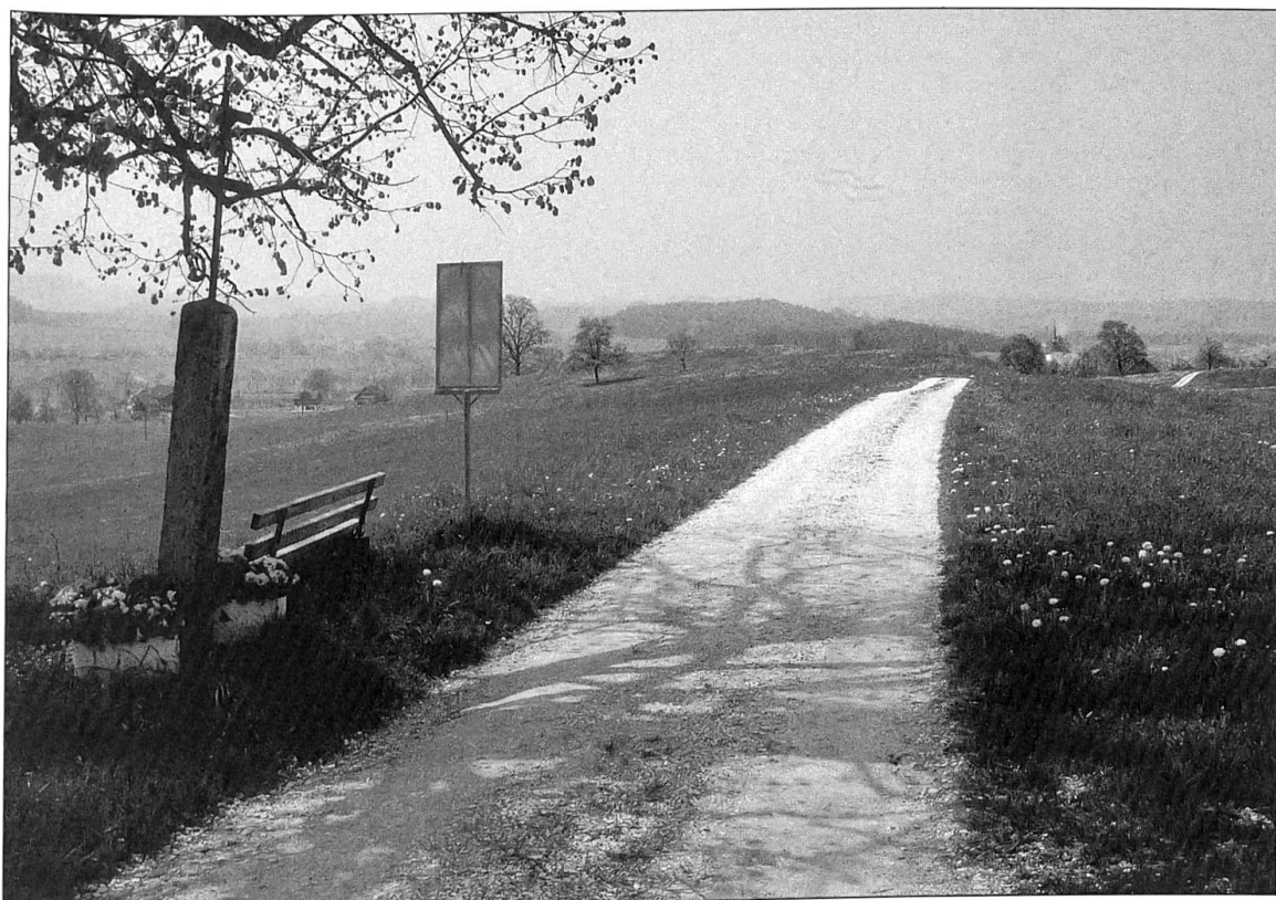
Abbildung 2: Die Landstrasse, mit undatiertem Wegkreuz, auf dem Höhenverlauf zwischen Wigarten und den Kapellen St. Ulrich und St. Ottilien. Als Güterstrasse verläuft sie als 2,5 Meter breite Schotterstrasse und wird als Wanderweg benutzt.

hauses ist 1270 erwähnt (Beleg siehe LU 27.1.4). Als Gut bereits früher erwähnt, erscheint Ettiswil im 13. Jahrhundert in den schriftlichen Quellen. Gemäss Überlieferung sind 1262 ein Gasthaus und 1326 ein Markt bezeugt (KDMLU V: 64). Ursprung und Geschichte der Sakramentskapelle von Ettiswil, die auf einem Hostienraub im 15. Jahrhundert gegründet, ist andernorts ausführlich dokumentiert (vgl. KDMLU V: 81 ff.). Güter in Schötz werden im 12. Jahrhundert erwähnt. Im Jahre 1489 kam im Bereich einer der beiden Kapellen von Schötz ein Gräberfeld zu Tage. Die Gebeine wurden für Überreste einer Gruppe thebäischer Märtyrer aus der Schar des heiligen Mauritius erklärt (KDMLU V: 204 ff.). In der Folge entwickelte sich eine regelrechte Wallfahrt, die im weite-