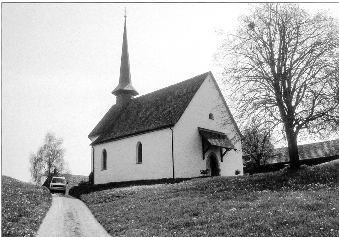
Abbildung 3: Ansicht der Kapelle St. Ulrich am Verlauf der alten Landstrasse. Im steilsten Bereich ist eine geringfügige Hohlwegausprägung festzustellen.

Stadt Luzern aus dem Jahre 1456 als ‚Hogestres‘ und ‚Hochsträs‘ und die Nennung eines ‚Uoly am hochsträs‘ anführt und daraus schliesst, dass «...kein Zweifel übrig bleibt, dass einst hier die Hochstrasse vorbeilief» (Lütolf 1864: 277). Ein zweiter Faktor besteht darin, dass spätestens seit den 1840er-Jahren das ausgedehnte, immer wieder vom Pflug erfasste Mauerwerk im Umfeld der Kapelle von Ober-Rot (LU 27.1.6) im 19. Jahrhundert als römisch erkannt wurde; in diese Zeit fallen auch Einzel funde römischer Münzen. In den 1940er-Jahren schliesslich wurden Mauerzüge eines römischen Gutshofes in Ober-Rot erstmals ansatzweise freigelegt (Speck 1993: 15 ff.). Der dritte Faktor, der Fund einer römerzeitlichen Siggillatascherbe in Ettiswil, machte aus