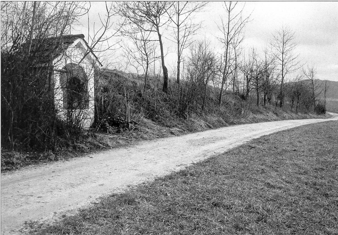
Abbildung 18: Die Wegkapelle Hoostris an ihrem heutigen Standort (Blickrichtung Hoostris). Aufgrund einer Gesamtmelioration hierhin verschoben, soll sie in ihrem alten Standort auf die Überlieferung rund um das Schötzerschmied-Anneli zurückgehen.

achtet der neuen Strasse – nicht eingehen lassen (Marti 1993: 79 ff.). Der Name blieb ihr noch eine Zeit lang erhalten: im Jahre 1860 wird sie als alte Landstrasse bezeichnet (Marti 1993: 84).