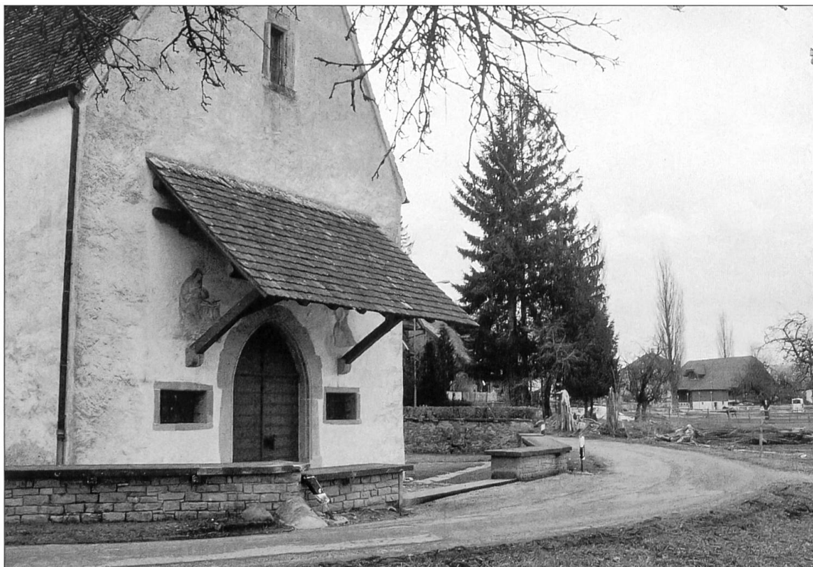
Abbildung 13: Von der Ettiswiler Wallfahrtskapelle führt die alte Landstrasse...

wurde um 1570 errichtet und in den Jahren 1887 und 1929 jeweils wieder neu erbaut (KDMLU IV: 221).