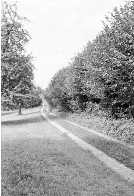
Abbildung 7: ... und ihre Einfügung in die Landschaft während der Vegetationszeit.