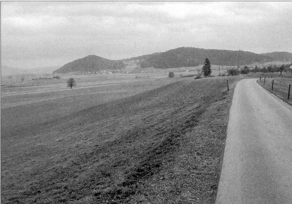
Abbildung 14: ... auf den Endmoränenwall der Wauwiler Ebene (linke Bildhälfte) und läuft über diesen Geländerrücken Richtung Schötz.

Richtung angelegt, führt ebenfalls über Hügel, dann über die Wässermatten und auch über die Wigger. Wird in den Matten gewässert, so liegt der Fussweg unter Wasser und ist ungangbar. Läuft die Wigger an und tritt das Wasser in der Gegend der Brücke aus, was nicht selten geschieht, so sind Fussweg und Strasse für Fussgänger vollständig unbrauchbar, und wir wären von der Pfarrkirche in Schötz und vom Priester abgeschnitten. Beide Wege sind im Winter so verschneit, dass es kaum möglich ist, eine offene Bahn zu behalten. Da wir zur Pfarrkirche in Ettiswil näher gelegen sind und dorthin weit bessere Wege haben, kann uns niemand zumuten, der Pfarrei Schötz beizutreten. Die Bewohner des Dorfes Schötz und jene von Ohmstal wünschen eine eigene Pfarrei