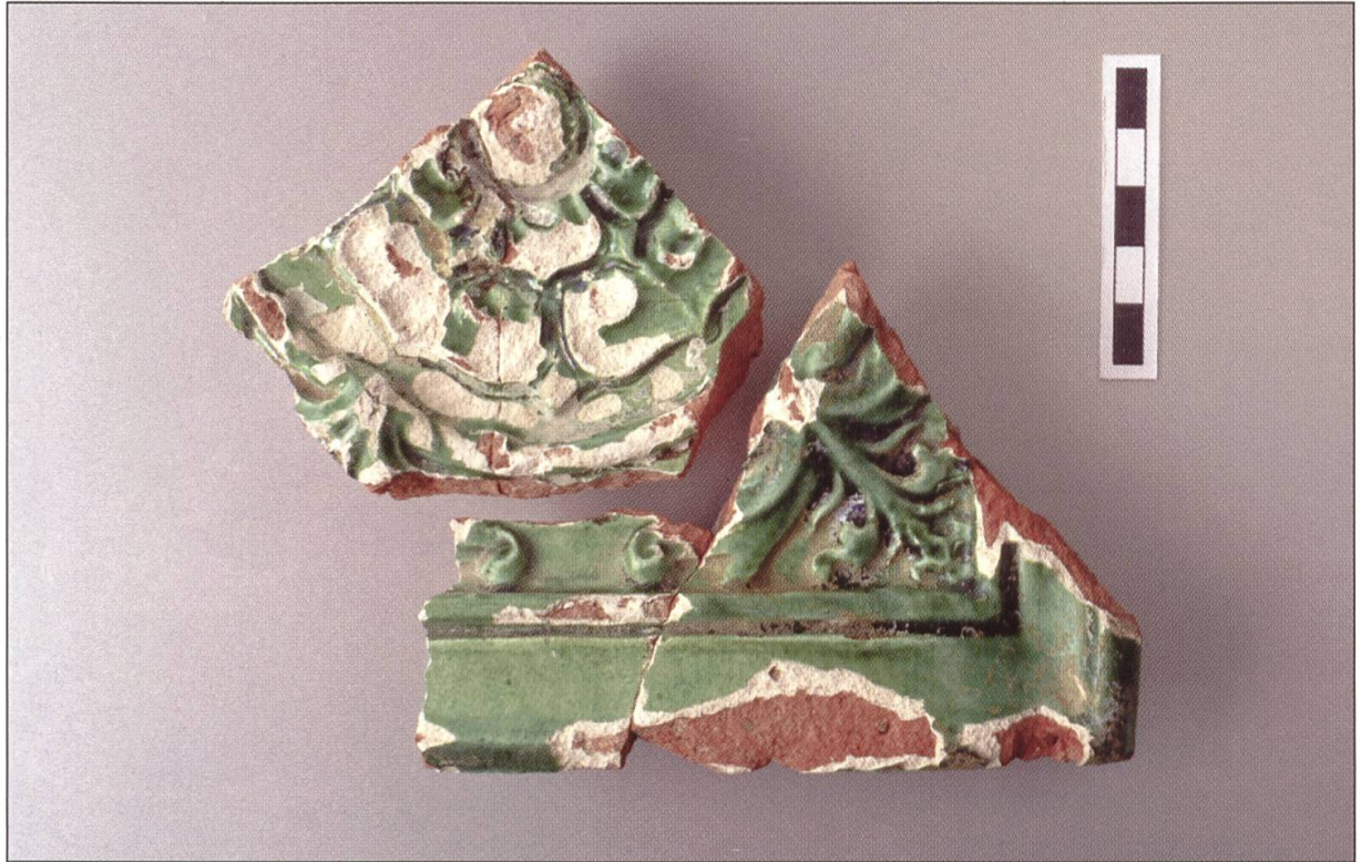
Fragmente einer Blattkachel mit Rosettenmotiv, zweite Hälfte 15. Jahrhundert.

nem sehr schlechten Erhaltungszustand, deshalb ist eine zeitliche Einordnung schwierig. Die ersten Analysen weisen aber auf eine mittelbronzezeitliche Zeitstellung der Siedlung hin. Diese Phase ist ja auch unter den Lesefunden besonders gut vertreten.