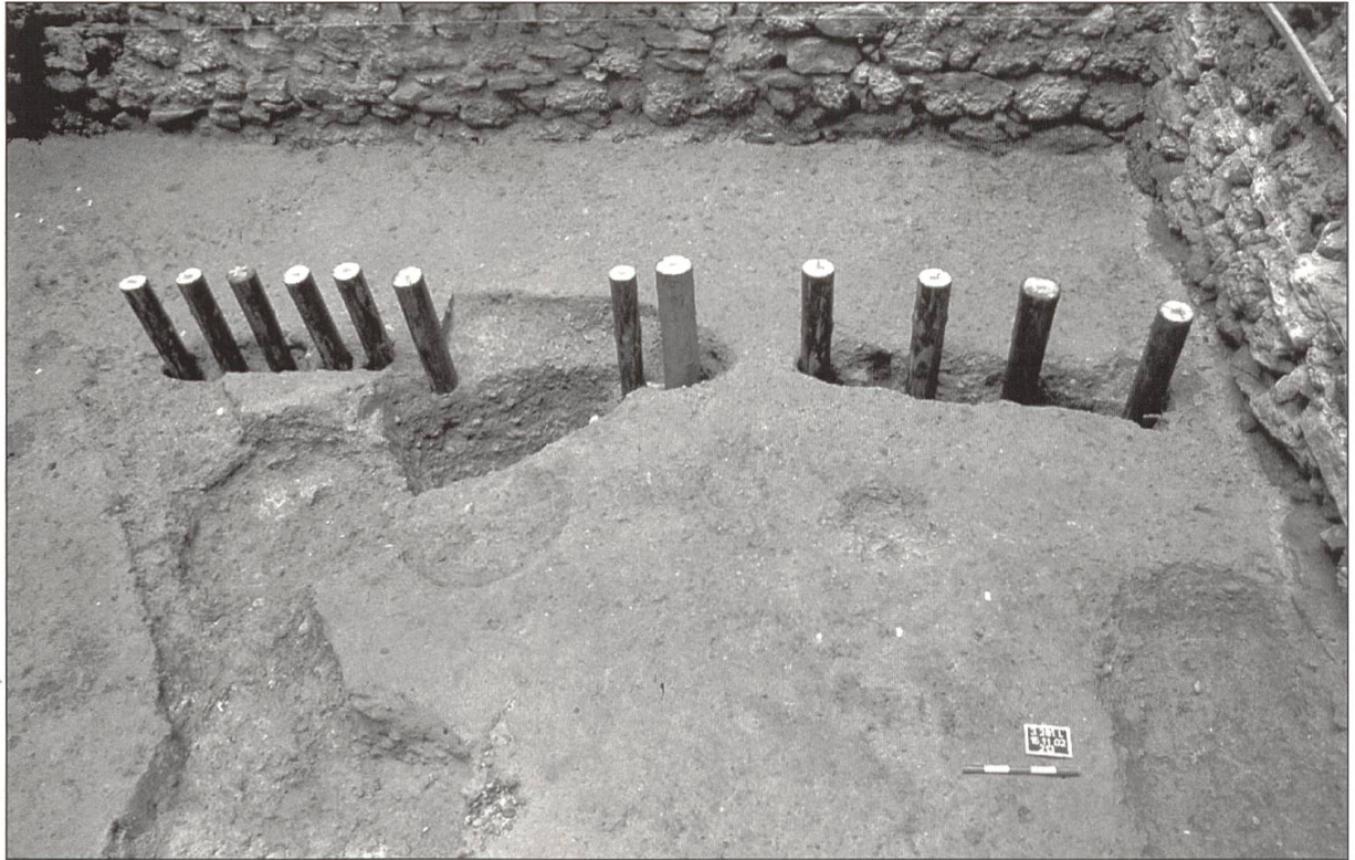
Die Pfostenlöcher der Palisade der hochmittelalterlichen Burganlage sind mit Pfählen markiert. Die Zwischenräume zwischen den Pfählen dürften mit Flechtwerk ausgefüllt gewesen sein. In den grossen Zwischenräumen war die Palisade aufgrund jüngerer Störungen nicht mehr nachweisbar und ist zu rekonstruieren.

stellungen liessen sich dank der dunkleren Verfüllung deutlich ablesen. Insgesamt konnten noch 14 Pfähle mit einem Durchmesser von 20 bis 30 Zentimetern dokumentiert werden, die in einen schmalen Graben eingesetzt und durch festgestampftes Erdreich fixiert worden waren. Vergleichbare Befestigungen, die zum Standard einer Holz-/Erdburg gehörten, konnten im Kanton Luzern auch auf der Burgstelle Salbüel in der Nähe von Hergiswil bei Willisau und auf dem Kottwiler Gütsch nachgewiesen werden. Die recht grossen Abstände zwischen den Pfosten lassen auch auf Kastelen auf eine Kombination von Pfählung und Flechtwerk schliessen. Ein Unterbruch in der Pfahlreihe bei der Gebäudeecke könnte, in Verbindung mit einem eher rechteckigen Pfosten, auf ein mögliches Tor hinwei-