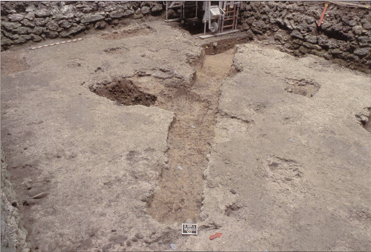
Im Mörtelboden, der den ganzen Keller des Burgturms Kastelen bedeckt, zeichnen sich die von Schatzgräbern angelegten Sondiergräben deutlich ab. Blick aus südöstlicher Richtung.

nun auch archäologisch erfasst werden. Im nordöstlichen Teil der Grabungsfläche konnten zwei Fundamentgruben nachgewiesen werden, die einen rechten Winkel bilden. Sie bezeichnen die südwestliche Ecke eines Gebäudes, dessen ursprüngliche Grundfläche nur mit einer Ausgrabung nördlich und östlich des bestehenden Turms bestimmt werden könnte. Der bestehende Turm ist somit Mitte des 13. Jahrhunderts gegenüber diesem älteren Gebäude gegen Südwesten verschoben worden. Er weist jedoch die gleiche Orientierung auf, wie die parallele Ausrichtung der Turmmauern und der Fundamentgruben des ergrabenen Gebäudes zeigen. Besonders auffallend ist die unterschiedliche Breite und Tiefe der Fundamente des Vorgängergebäudes. Die westliche Fundamentgrube ist rund 0,7 Meter breit, die südli-