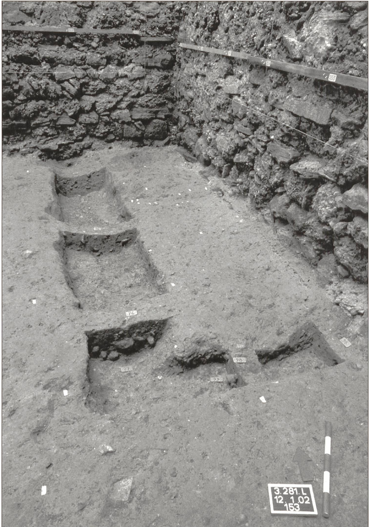
In der nordöstlichen Ecke des Burgturms kamen die Fundamentgruben eines zur hochmittelalterlichen Burgranlage gehörenden Gebäudes zum Vorschein.