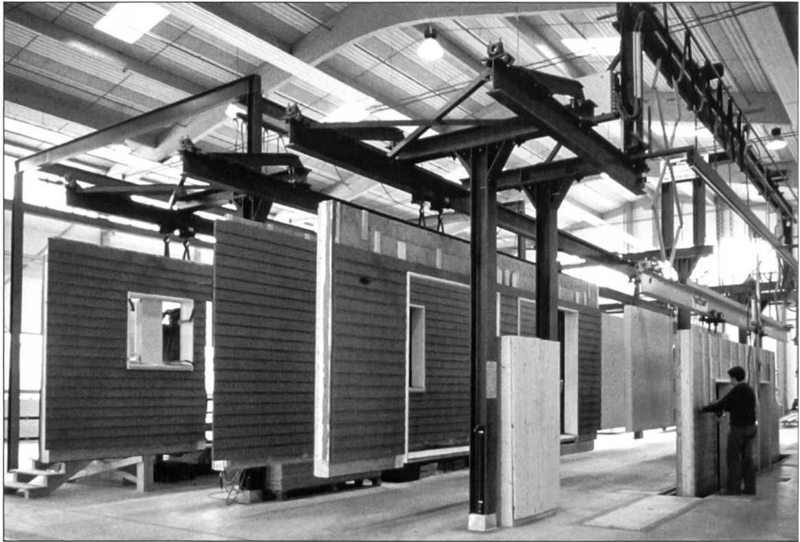
Produktionswerk in Schötz.