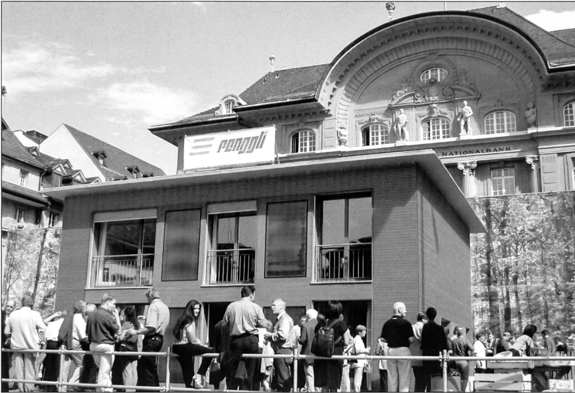
Das Solarhaus «Futura» auf dem Berner Bundesplatz. Baujahr: 2000. Bauherrschaft: Renggli AG. Architektur: Renggli AG.

Mit dem Solarhaus auf dem Bundesplatz wollte die Renggli AG gemeinsam mit Solar91 (heute Solar Agentur Schweiz) anhand eines konkreten Beispiels die Leistungsfähigkeit der Bauwirtschaft aufzeigen und die Öffentlichkeit für die Optimierungsmöglichkeiten im Hausbau sensibilisieren. Das Solarhaus weist ein Energieäquivalent von insgesamt bloss 350 Liter Heizöl pro Jahr auf. Diese Energie wird dem Solarhaus aber nicht durch Öl, sondern durch natürlich vorhandene und erneuerbare Energieträger zugeführt. Wäre dieses Haus nach geltenden Gesetzesvorschriften erstellt worden, würde es 2400 Liter Öl, also siebenmal mehr verschleudern. Mit dem Solarhaus, das sowohl den schweizerischen Minergie-Standard als auch den internationalen Passivhausstandard erfüllt, können – gerechnet auf 80 Jahre Nut-