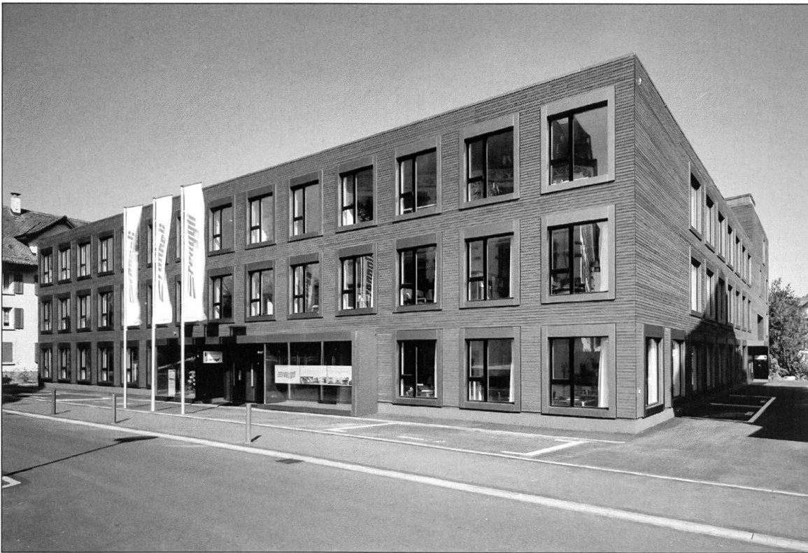
Wohn- und Geschäftshaus Renggli, Sursee. Baujahr: 2002. Bauberschaft: St.-Georg-Immobilien AG, Sursee. Architektur: Scheitlin-Syfrig & Partner Architekten AG, Luzern.

die optimale Zugänglichkeit der zu Gruppen zusammengefassten Räumen sicher.