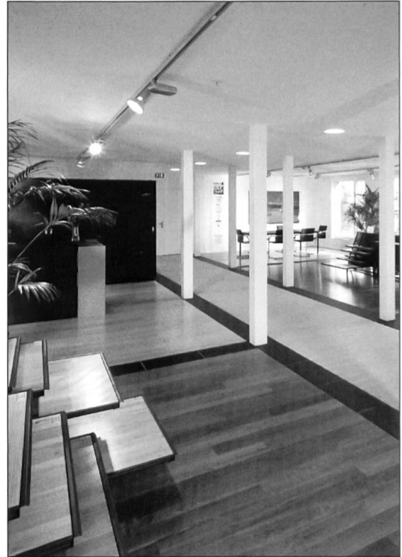
Renggli-Parkettausstellung in Sursee.

wurden mit einer Fassade aus hochwertigem Edelkastanienholz versehen. Das Kastanienholz in der gewählten Anwendung widerspiegelt die Ansprüche an die Bauweise und an die Qualität der Konstruktion. Sie zeigt die Leistungsfähigkeit des modernen, industriell vorgefertigten, massgenau montierten Holzsystembaus.