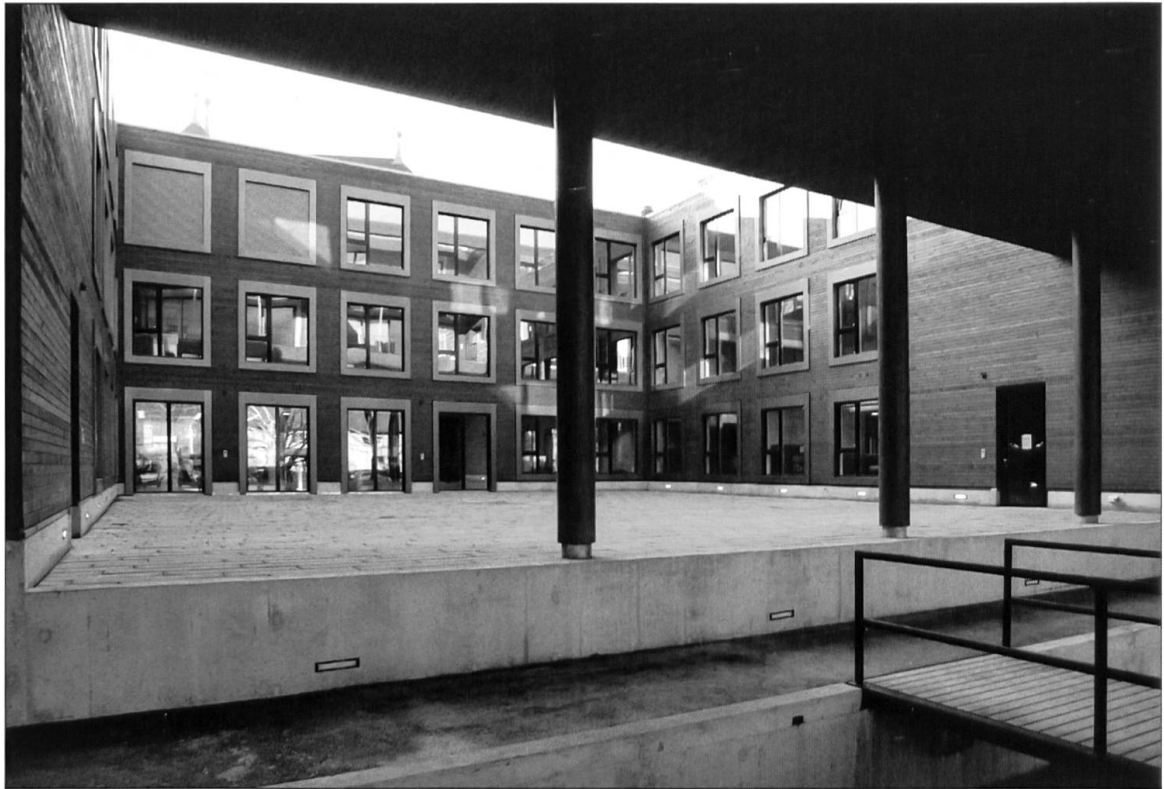
Innenhof des Wohn- und Geschäftshauses Renggli in Sursee.

kenntnisse in die weitere Entwicklung einfließen können. Davon werden nicht nur Renggli-Kunden profitieren, sondern die Branche generell.