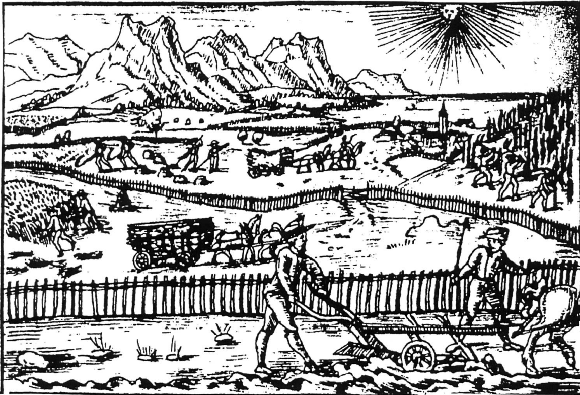
Landbau in der zweiten Hälfte des 16. Jahrhunderts.

Rechtsquellen des Kantons Luzern, Zweiter Teil, Rechte der Landschaft, Zweiter Band Vogtei Willisau (1407–1798), Erster Halbband: Freiamt, Grafenschaft, Landvogtei Willisau, 2002 (RQ Vogtei Willisau I).