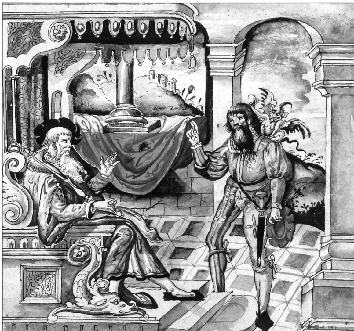
Eidesleistung vor dem Twingherrn.

Folgenden wiedergegeben. Die Titel und die Bestimmungen werden möglichst originalgetreu (Kursivschrift) angeführt, wobei einige Begriffserklärungen in Klammern eingefügt werden. Das Übrige sowie der Kommentar dazu erfolgen in Normalschrift. Einige der Vorschriften sprechen für sich, sie bedürfen keines Kommentars. Die bei Nichtbeachtung der Gebote und Verbote angedrohten Strafen sowie die Regelung, wem diese Strafgeelder gehörten, sind Vorschriften, deren Aufnahme in die Twingordnung zweifellos in erster Linie die Twingher-