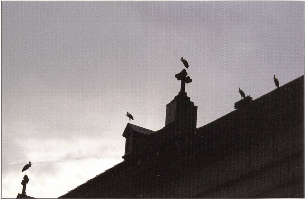
Jeder Storch hat seinen Übernachtungsplatz auf der Schötzer Kirche gefunden.