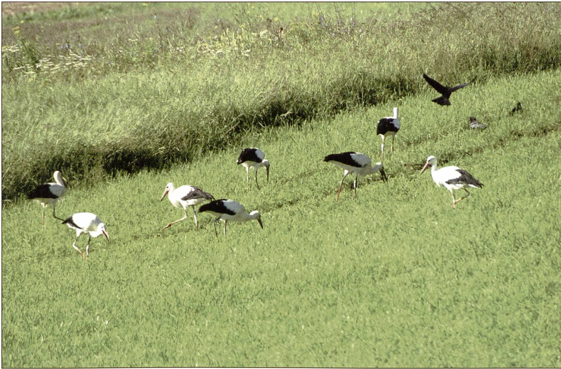
Die extensivierten Wiesen im Wauwilermoos bieten Futter für die grosse Gruppe während mehrerer Tage.

zeit wieder vermehrt durchziehende und rastende Störche im Wauwilermoos. Wie deren Truppgrösse wieder zunahm zeigt die folgende Tabelle mit den grössten Trupps (> 9) in den einzelnen Jahren: