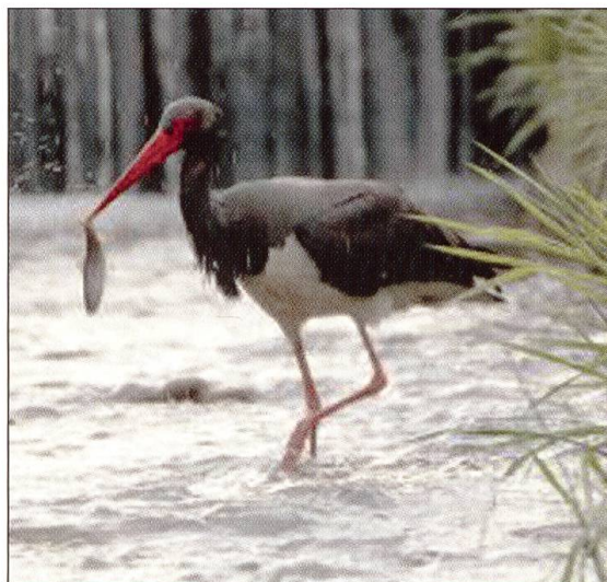
Ein Schwarzstorch hat im Rickenbach gerade einen Fisch erbeutet.