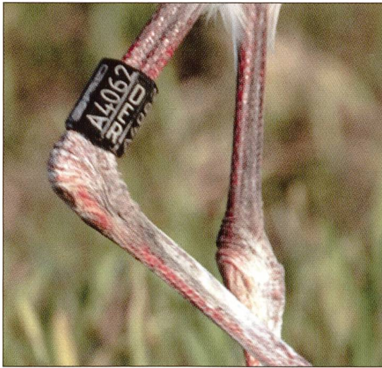
A 4062 wurde am 17. Juni 2004 in Südbaden (D) beringt und hielt sich mindestens vom 15. bis 18. August 2004 im Wauwilermoos auf und übernachtete auf der Kirche Schötz.