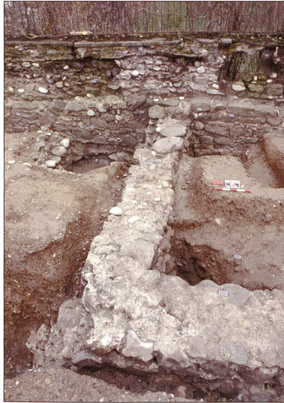
Abb. 6 (rechts) Die Nordwestecke des Raumes 4. Im Hintergrund links der an die Stadtmauer stossende Sodbrunnen. Ansicht von Westen.

Abb. 5 (links) Das Hauptgebäude auf der Nordseite der Burg (Raum 8) umfasst einen Raum von sechs auf zwanzig Meter. Ansicht von Nordwesten.