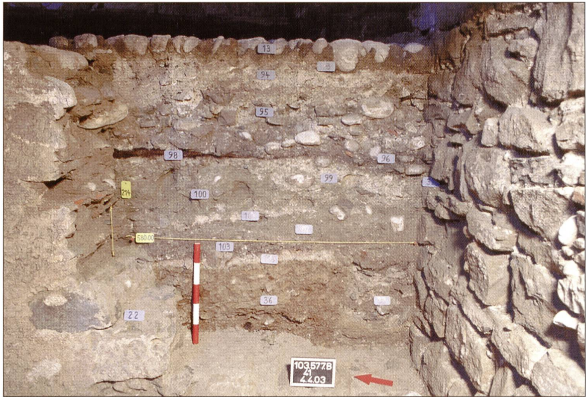
Abb. 3 Nach Entfernung der neuzeitlichen Kellerwand im Haus Bergli (links) zeichnete sich eine reiche Schichtabfolge ab, die vom Bau der Stadtmauer (rechts) bis in die jüngste Vergangenheit reichte. Deutlich erkennbar ist insbesondere die schmale Baugrube zur Stadtmauer. Ansicht von Südwesten.

Jahrhunderts in Mitleidenschaft gezogen wurde, sei es im Guglerkrieg 1375, bei der Zerstörung von Willisau durch Leopold von Österreich im Juli 1386 oder beim Feldzug der Berner im August 1386. Die älteste direkte urkundliche Erwähnung der Burg stammt aus dem Jahr 1406/1407, als Graf Willhelm von Aarberg die Stadt an Luzern verkaufte. 1420 sind Unterhaltsarbeiten an der Burg durch die luzernischen Vogteirechnungen belegt, indem der Schultheiss von Willisau «ze deken von der schal und der vesty» 7 Pfund 2 Schilling ausgegeben hatte. (Quelle des Zitats: StALU Cod. 6855, 122, August Bickel, Willisau, Luzerner Historische Veröffentlichungen 15/1, 1982, S. 128, Anm 9). Während die Schal auch noch in