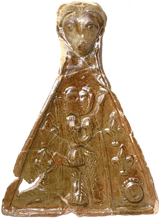
Abb. 10 Dreieckige Kranzkachel mit küsendem Paar, zweites Drittel 14. Jahrhundert. Massstab 1:3.