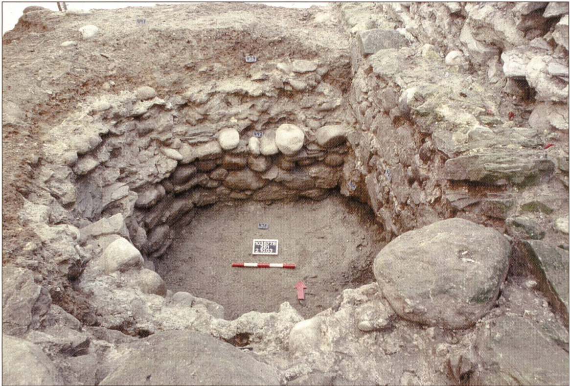
Abb. 7 Der Schacht des Sodbrunnens kann aus Sicherheitsgründen erst nach der statischen Sicherung des Brunnenkranzes im Rahmen der Restaurierung der Ruine ausgehoben werden. Ansicht von Süden.

früherer Jahre auf der West-, Nord- und Ostseite der Stadt Willisau gezeigt hatten, bestätigte sich auch auf der Südseite. Der Stadtmauer war auch auf dieser Seite ein Wehrgraben vorgelagert. Ein maschinell ausgeführter Sondierschnitt ergab eine Grabentiefe von vier Metern. Die Breite konnte wegen der Begrenzung der Ausgrabungsfläche nicht bestimmt werden.