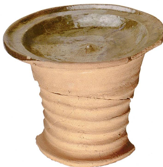
Abb. 12 Tellerkachel, zweites Drittel 14. Jahrhundert. Massstab 1:3.

Nach den bisherigen Ergebnissen kann ein zwölfackiger Turmofen rekonstruiert werden. Während der untere Teil des Ofens wohl nur mit Napfkacheln bestückt war, könnte der Turmkörper mit Teller- und Napfkacheln versehen worden sein. Die Kuppel, in welche auch die Kranzkacheln eingelassen waren, war wohl mit Tellerkacheln bestückt. Zuoberst auf der Kuppel war eine schüsselförmige Kachel aufgesetzt,