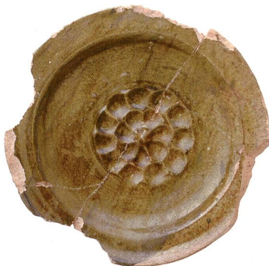
Abb. 14 Tellerkachel mit rosettenförmig angeordneten Fingereindrücken, zweites Drittel 14. Jahrhundert. Massstab 1:3.

Haus sichtbaren Teile der Stadtmauer werden künftig nebst einer Vitrine mit ausgewählten Funden den Besucherinnen und Besuchern des regionalen Zivilstandsamts zugänglich sein. Die ausserhalb des Hauses Bergli liegenden Mauern der Burg werden aus konservatorischen Gründen wieder überdeckt und deren Verlauf mit modernen Materialien nachgezeichnet, so dass der Grundriss der Anlage auch in Zukunft im Gelände gelesen werden kann. Einzig der Sodbrunnen, der zum Zeitpunkt der Abfassung dieses Berichts noch nicht archäologisch erforscht war, soll instand gestellt und als originales Element der Burg sichtbar erhalten bleiben. Weiter ist eine Informationstafel geplant, auf der die Ergebnisse der archäologischen Forschungen dargestellt werden. Die wissenschaftliche Auswertung wird ab Herbst 2005 von Jonathan Frey im Rahmen einer Lizentiatsarbeit an der Universität Bern vorgenommen.