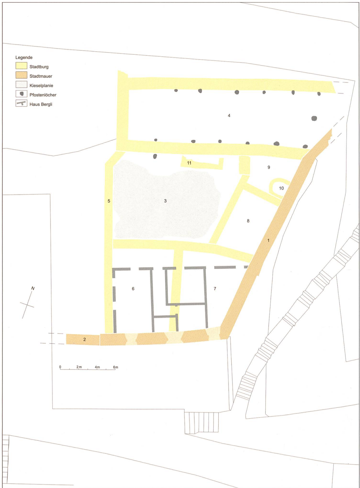
Abb. 2 Willisau, Haus Bergli, Übersicht.