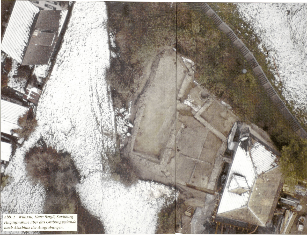
Abb. 1 Willisau, Haus Bergli, Stadtbürgli. Flugaufnahme über das Grabungsgelände nach Abschluss der Ausgrabungen.