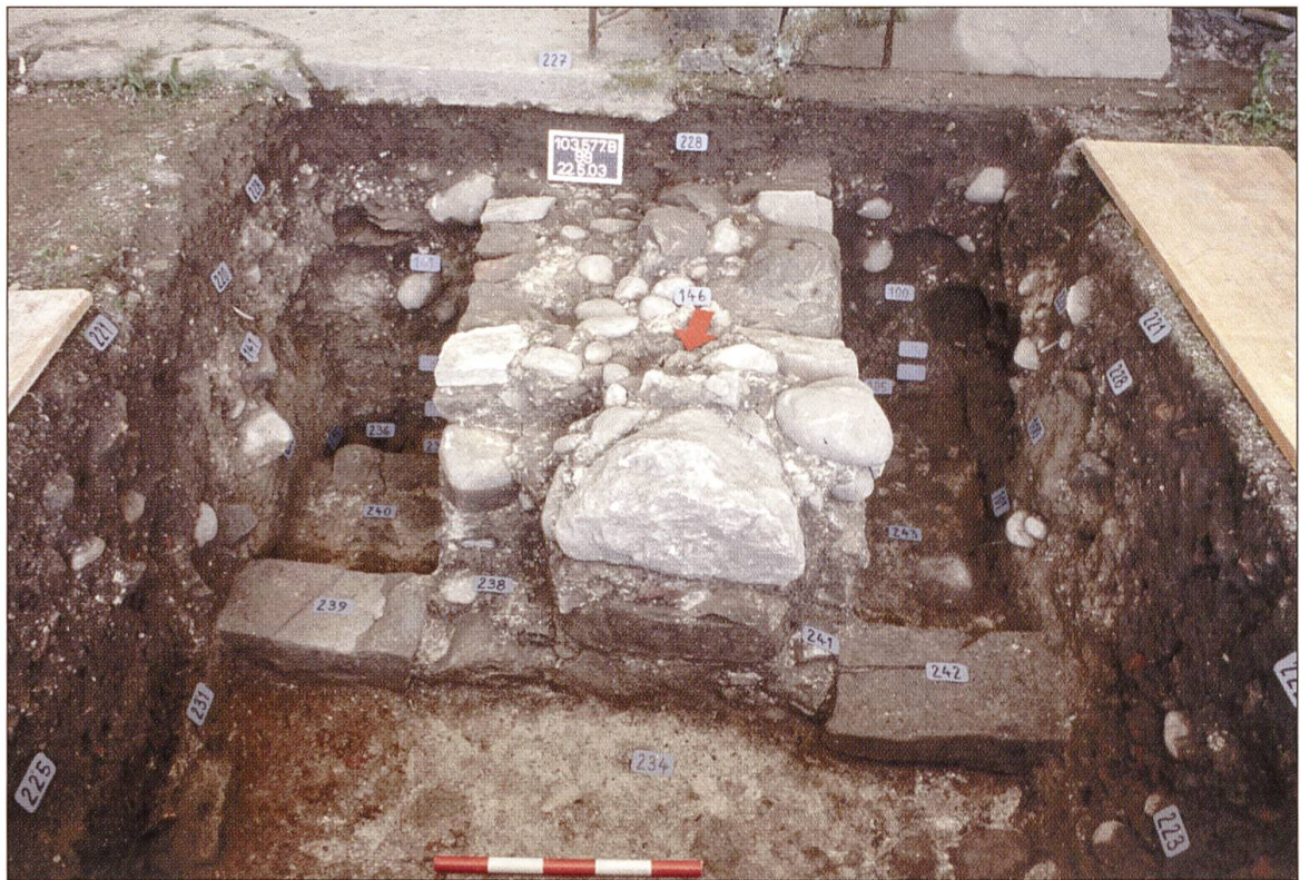
Abb. 9 Vom Innenhof (im Vordergrund) gelangte man über die Schwellen zweier ebenerdiger Eingänge in die Räume Nr. 7 (links) und Nr. 6 (rechts).

Stadtgraben im Süden. Die wichtigsten Fassaden gegen die Stadt hin waren jene des Hauptgebäudes Nr. 4 und der Westmauer Nr. 5. Eine kleine Strebemaier im Westen des Hauptgebäudes kann einerseits als Stützmaier, andererseits als Traverse verstanden werden, die das Queren des Hanges erschweren sollte. Im Westen dürfte sich auch der Hauptzugang zur Burg befunden haben, der in den Innenhof führte. Eine flache Mulde, die sich unter dem Bauniveau abzeichnete, ist jedoch der einzige konkrete Hinweis auf einen Eingang.