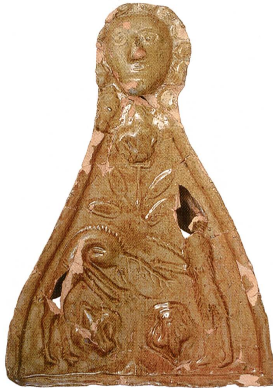
Abb. 11 Dreieckige Kranzkachel mit einem Zweikampf zwischen Hirsch und Bär; zweites Drittel 14. Jahrhundert. Massstab 1:3.

denn auch jener Teil der Burg, der prominent gegen die Stadt hin orientiert war. Von der Stadt aus muss der Anblick der breiten Nordfassade eindrucklich gewesen sein. Die Deutung als Hauptgebäude wird durch den Brunnen im Nebenraum Nr. 9 gestützt (Abb. 7). Raum Nr. 3 ist wegen des Treppenfundaments und wegen der Eingänge in den Nordtrakt eindeutig als Innenhof zu interpretieren (Abb. 9). Die Räume Nr. 6 und Nr. 7 sind aufgrund der Mauerstärken einem zweiten grossen Gebäude zuzuweisen, welches sich ebenerdig über zwei Türen zum Innenhof Nr. 3 öffnete.