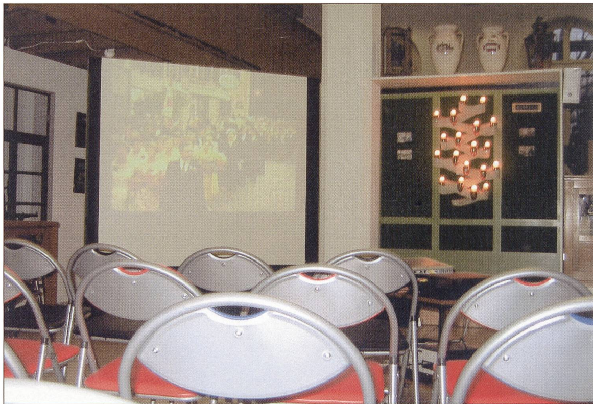
Das kleine Kino im Museum Zofingen; heute beliebter Treffpunkt und Vorführort der «Scholl»-Filme.

wusst, wie schnell aus der Gegenwart Geschichte wird. Es zeigt auf, dass wir den Gegebenheiten des «Heute» Respekt zollen müssen und bewusst die Gegenwart in breit gefächerten Zeugnissen in die Zukunft weitertragen müssen. In Zofingen hat uns der Filmidealist Eugen Scholl einen in seinem Wert noch nicht ganz erfassbaren Blick ins kaum vergangene Jahrhundert ermöglicht, der aber sicher bei kommenden Generationen nebst köstlichem Schmunzeln, Erstaunen und Bewunderung sogar viel Verständnis für Gewesenes auslösen wird.