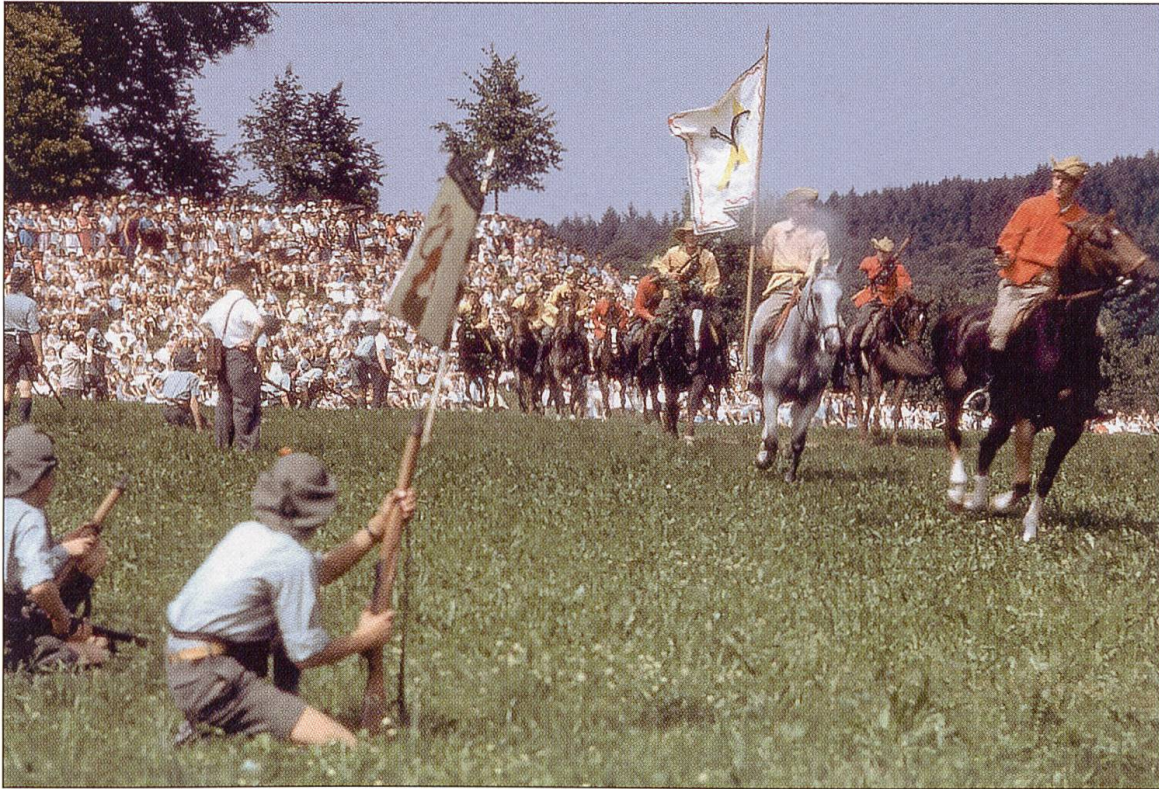
Alle Jahre wieder: Das Zofinger Kinderfest. Ab 1929 sind Umzüge, Spiele, Tanz und das traditionelle Gefecht auf dem Heitern vom Studio Scholl auf vielen hundert Metern Film gebannt.