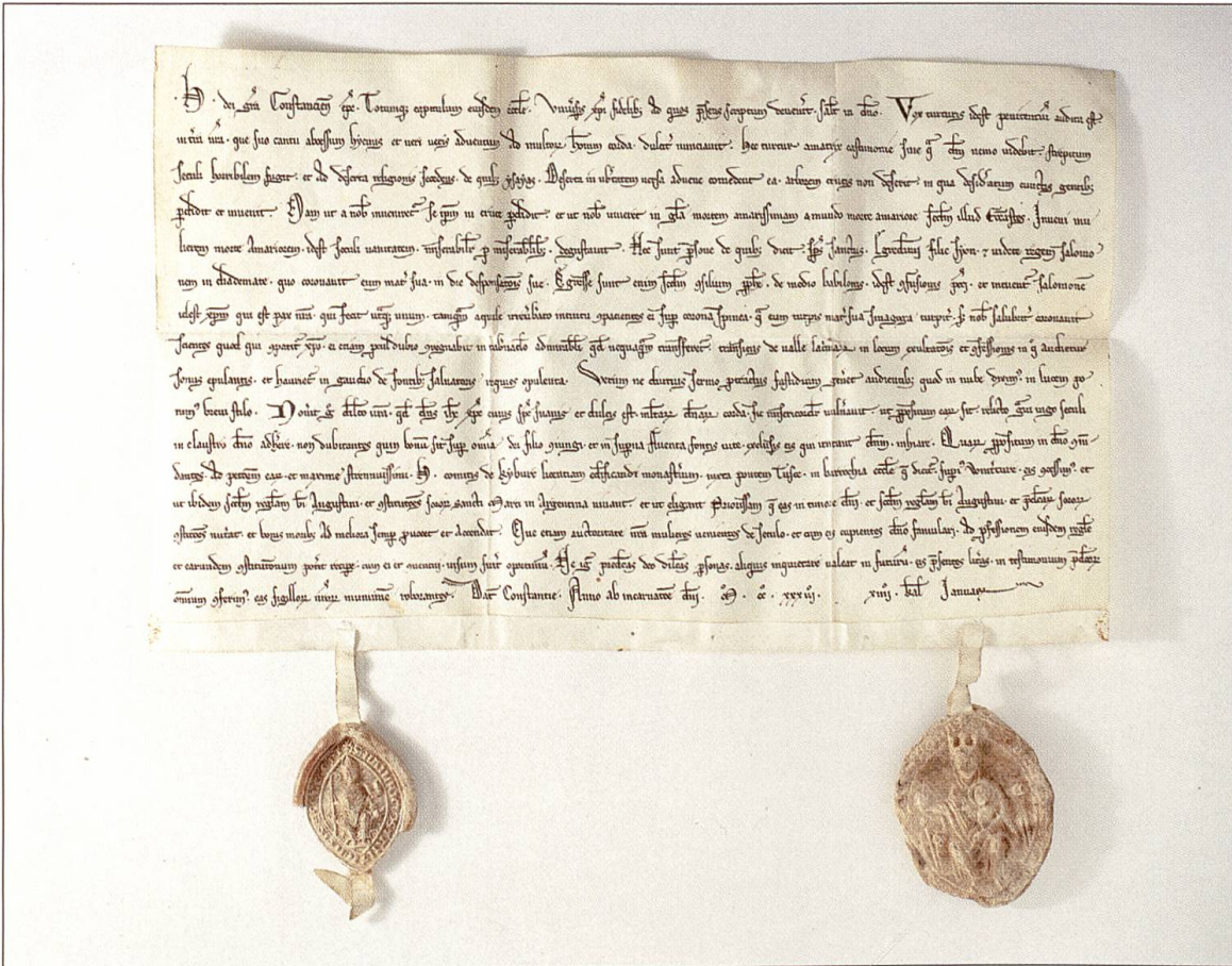
Urkunde vom 19. Dezember 1233. Der Bischof und das Domkapitel von Konstanz gestatten den Herren von Kyburg, an der Tössbrücke von Oberwinterthur ein Frauenkloster zu bauen. Urkunde: Staatsarchiv des Kantons Zürich.