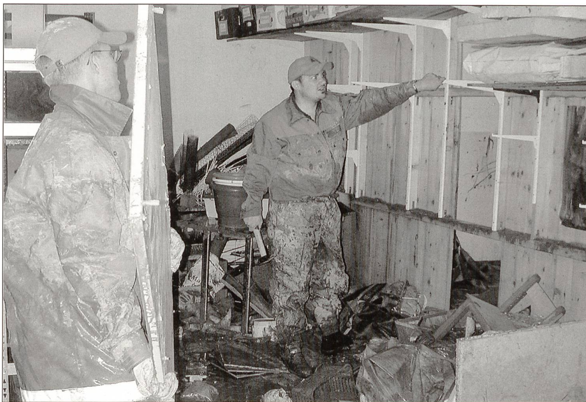
Grosse Schäden verursachte die Überschwemmung in der Heilpädagogischen Schule von Willisau.