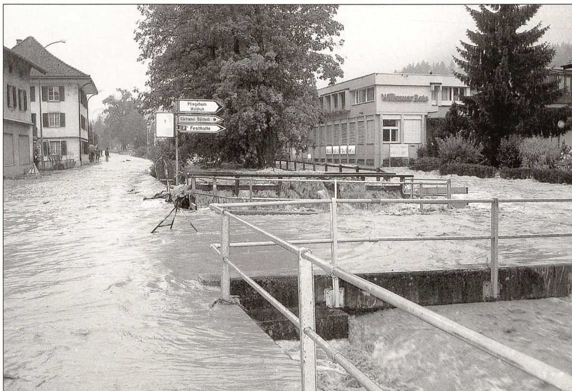
Der Fussgängersteg und die Brücke beim «Lustgarten» erwiesen sich wie 1988 als ein Hindernis und brachten die Enziwigger zum Überlaufen.

sich an den Brücken und verursacht Stauungen, die durch das Geröll noch verstärkt werden.