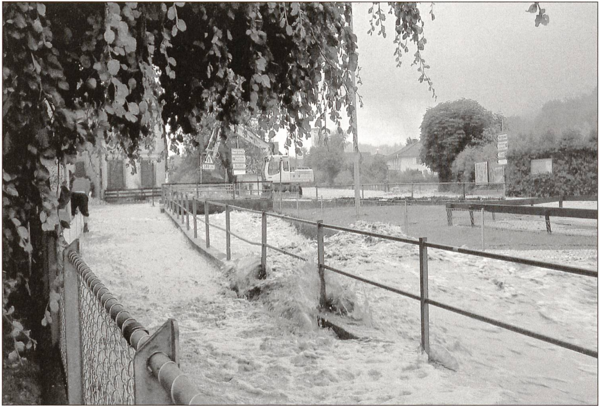
Grosse Flutwellen prägten das Bild bei der «Löwen»-Brücke in Willisau.