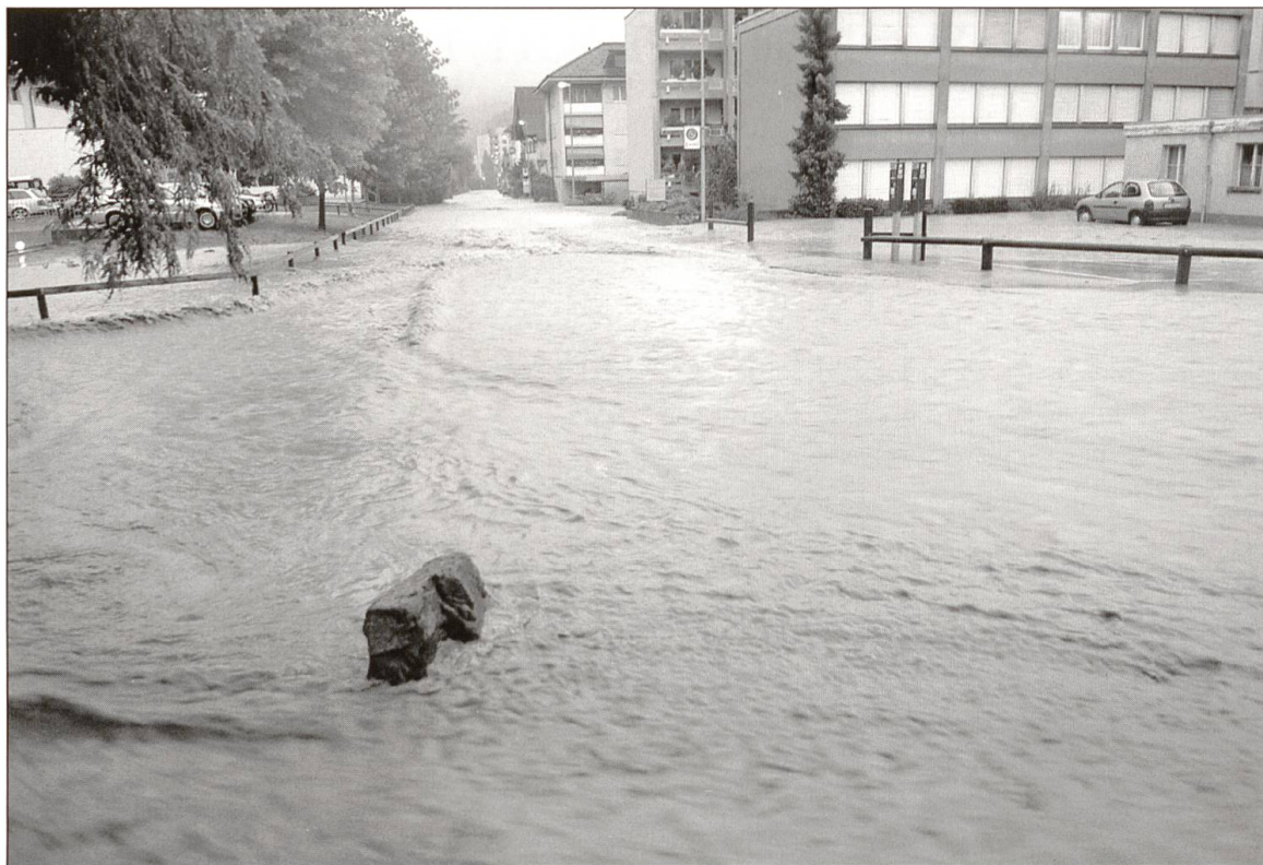
Die Adlermattstrasse schluckte das übergelaufene Hochwasser der Enziwigger.