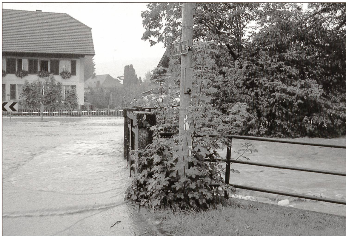
Brücke über die Wigger an der Strählgasse. Sie wurde beim verheerenden Hochwasser zum «Nadelöhr» und verursachte die Überschwemmung in Brittnau.