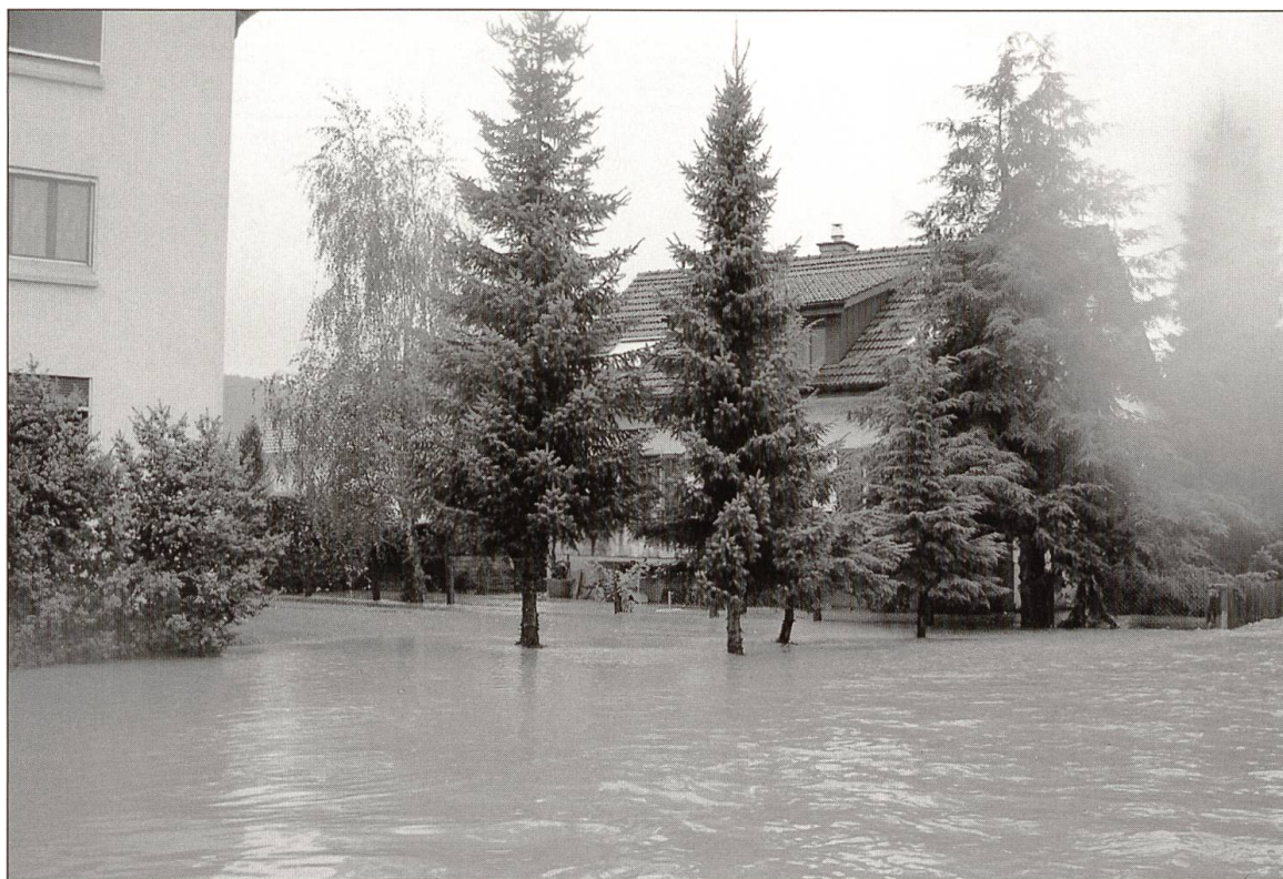
Auf der Zofingerstrasse war keine Fabrbahn mehr zu sehen, sie verwandelte sich in einen breiten Fluss.