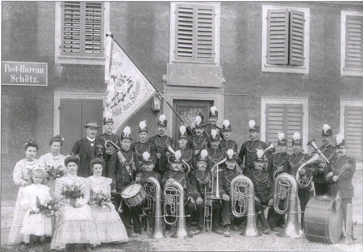
Das Bild zeigt die «Frohsinn» anlässlich ihrer Fahnenweihe 1909 vor der alten Post (Haus Fries Anton an der Nebikerstrasse). Die Uniform stammt aus dem Jahre 1906. Sie bestand aus einem grünen Kittel, einer schwarzen Hose und einer Mütze mit Weissm Federbusch. Dieser ist auf alten Fotos ein gutes und oft einziges Unterscheidungsmerkmal, denn die «Eintracht» trug einen dunkleren, zweifarbigen Busch!

Ehrgeiz, der Fleiss und der Siegeswille, verbunden mit erheblichem finanziellem Aufwand, die «Frohsinn» und die «Eintracht» gepuscht, und man geht nicht fehl in der Annahme, dass manche Höchstleistung ohne dorfinterne Konkurrenz so nicht zu Stande gekommen wäre!