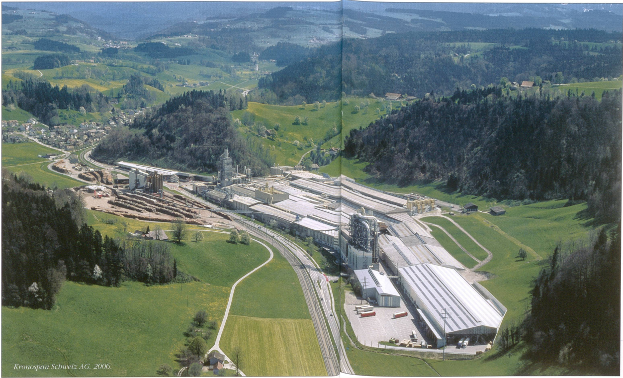
Kronspan Schweiz AG, 2006.