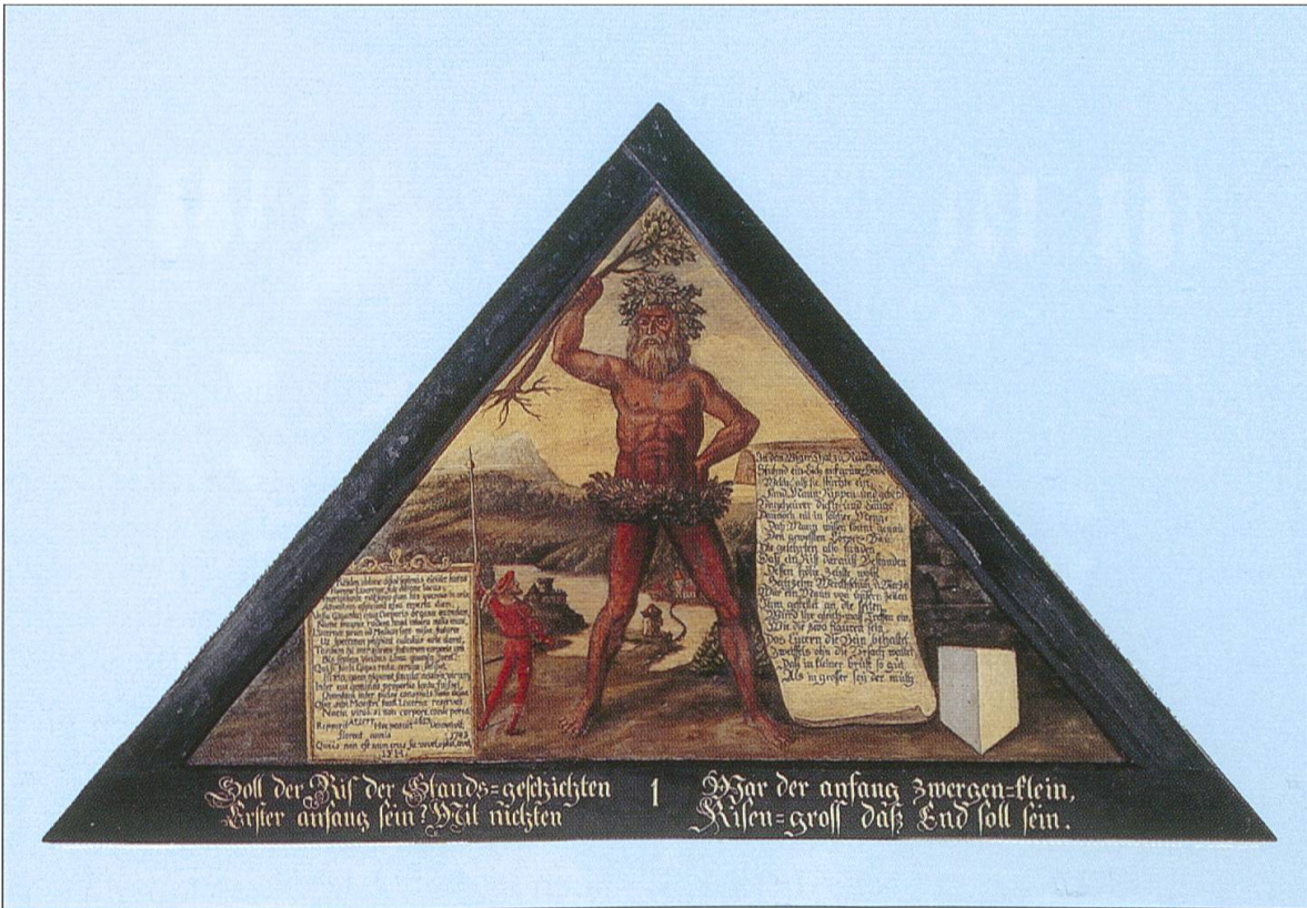
Die Tafel Nr. 1 mit dem Riesen von Reiden auf der linken Reussseite ist beim Brand der Kapellbrücke 1993 verschont geblieben.

Im Bild selber findet sich auf der rechten Seite des baumschwingenden Riesen ein lateinischer und zu seiner Linken folgender Text: