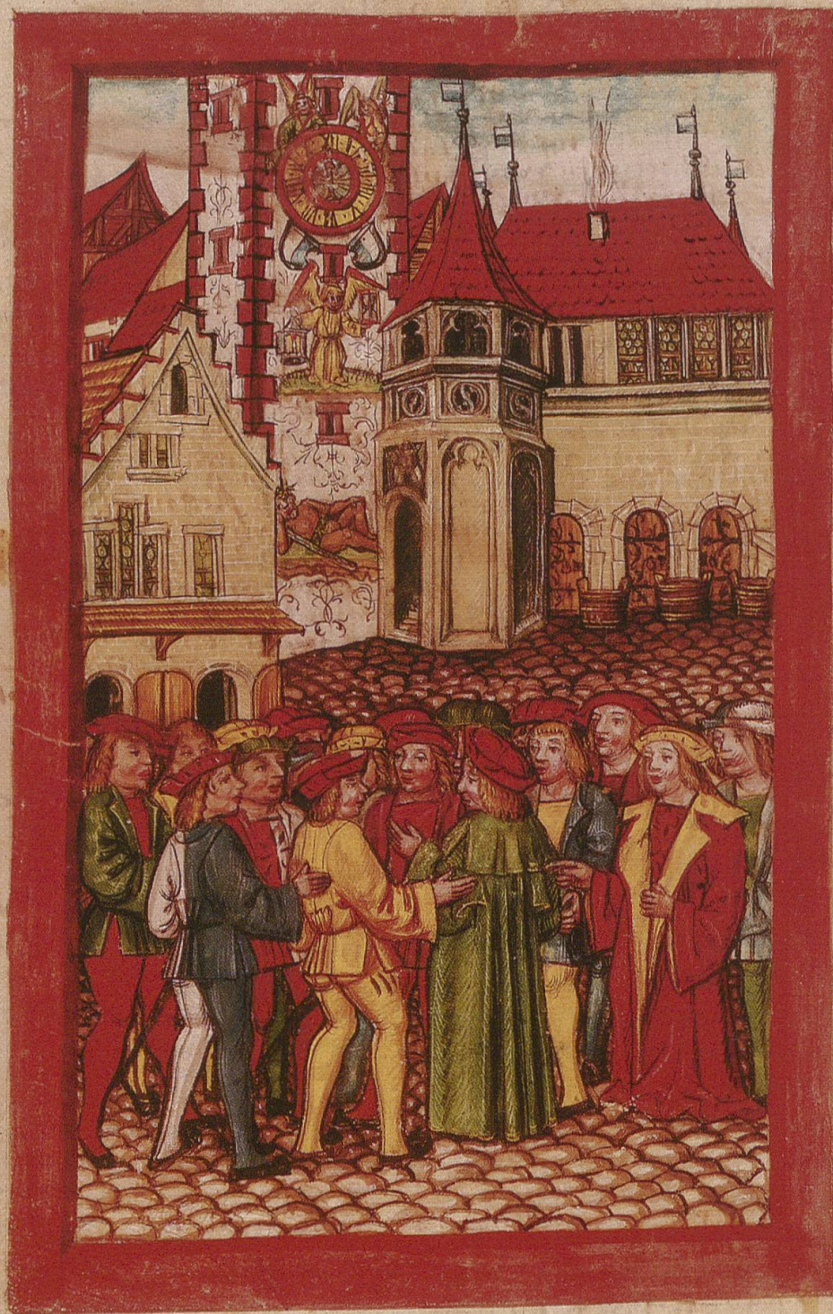
Auf Tafel 281 der 1513 erschienenen Diebold-Schilling-Chronik (Eigentum der Korporation Luzern) ist der «Urahn» des Riesen von Reiden zuunterst auf dem Rathhausturm zu sehen.