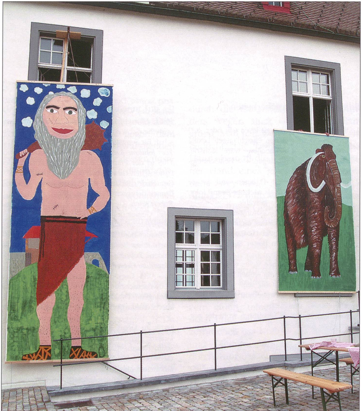
Zwei Primarklassen aus Reiden und Langnau haben den Riesen von Reiden und ein Mammut in Lebensgrösse gemalt.