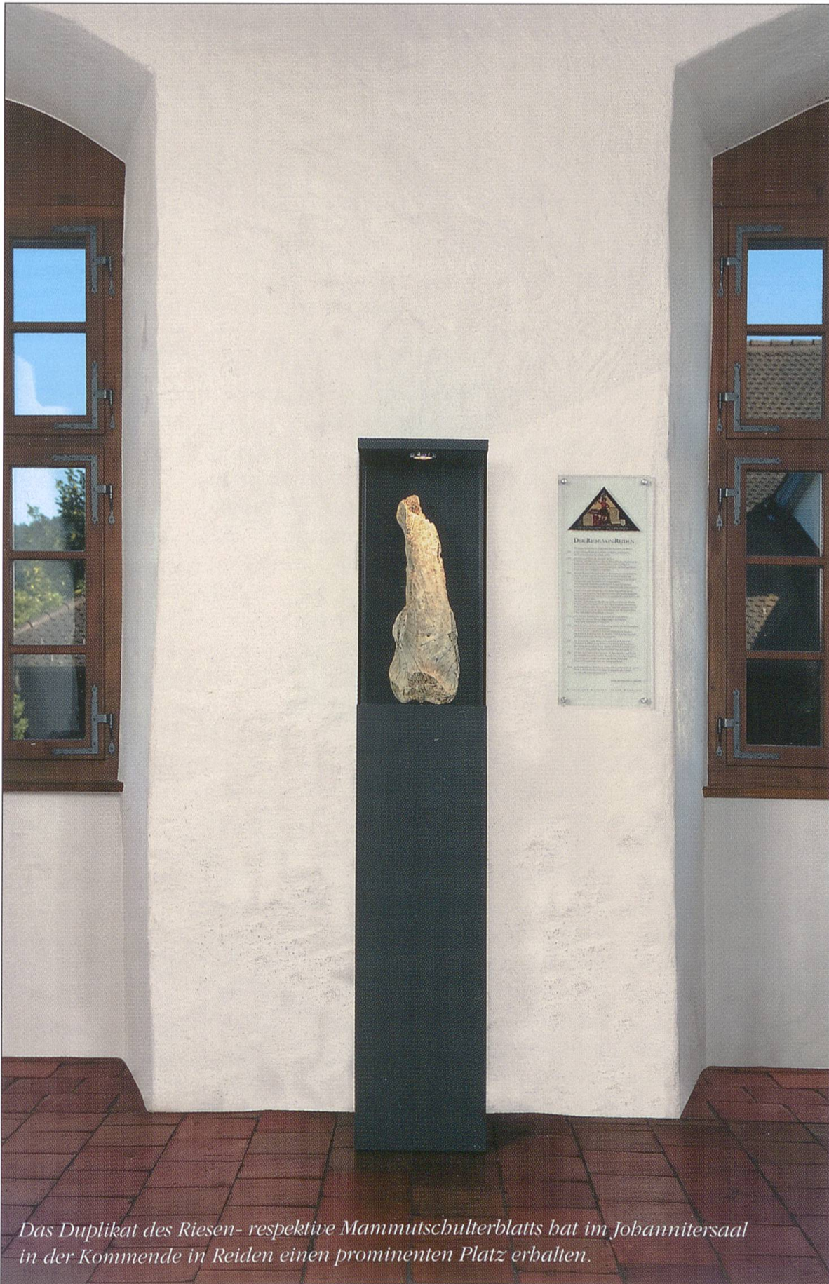
Das Duplikat des Riesen- respektive Mammutschulterblatts hat im Johannitersaal in der Kommende in Reiden einen prominenten Platz erhalten.