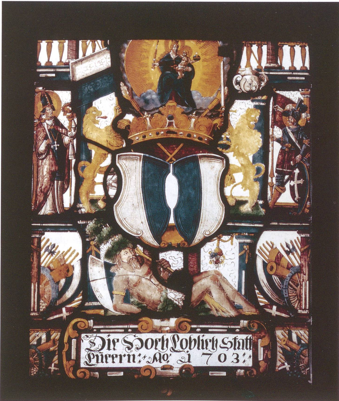
Der Riese von Reiden auf einer Luzerner Stadtscheibe aus dem Jahr 1703 in der Pfarrkirche St. Maria Himmelfahrt in Winikon.

Geschosse aufgeteilten Turmes untermauert die biblische Deutung des Riesen als Wurzel Jesse und – in der politischen Entsprechung – als Fundament des Luzerner Staatswesens.