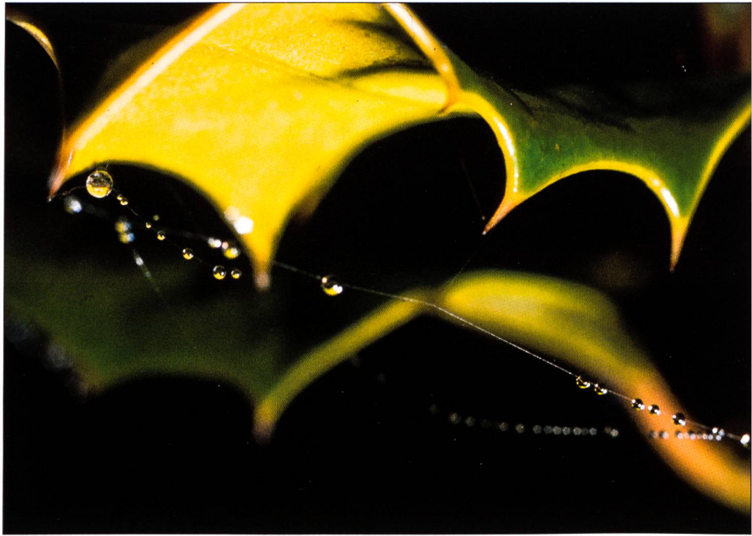
Ein Detail aus der Natur mit intensivem Farben- und Formenspiel: Spinnenfäden an Stechpalmenblatt.

Wunsch nach einem zweiten Schulraum auf. Übernachtungsmöglichkeiten und Küche hätten es erlaubt, mehrtägige Besuche für Klassen zu offerieren.