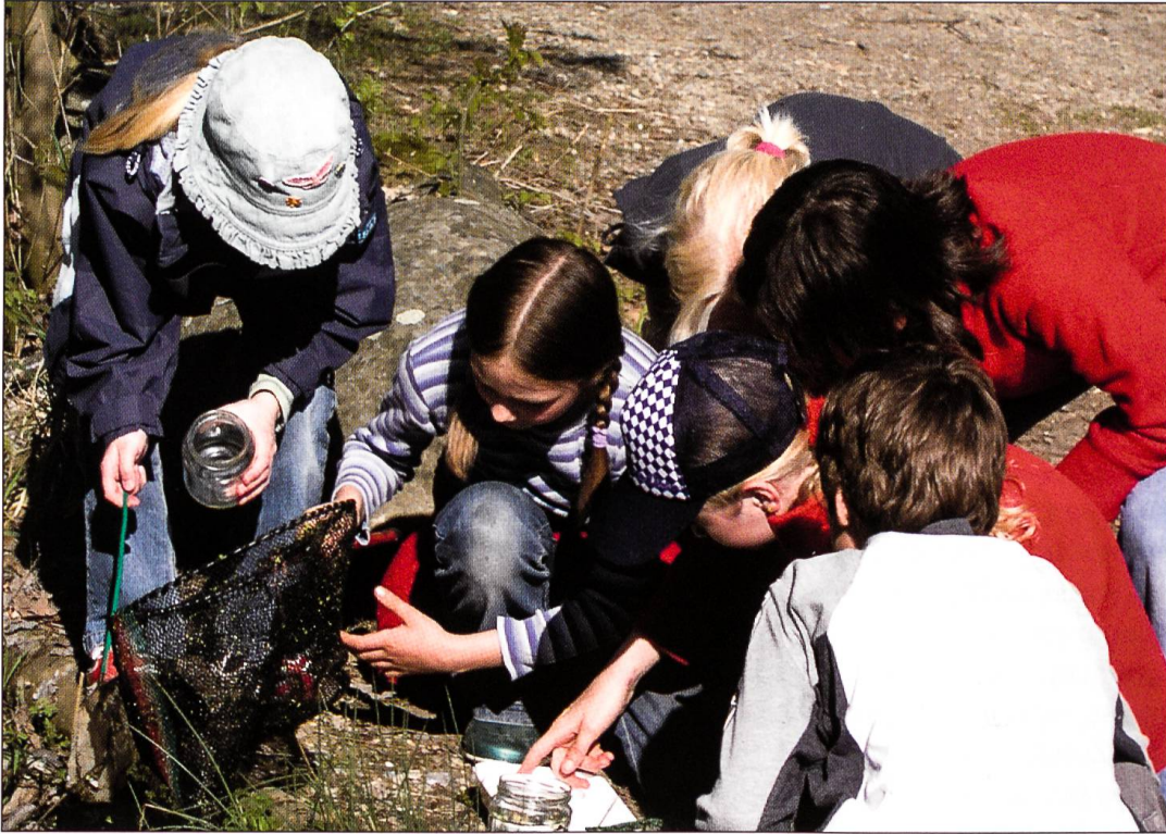
Die Hauptaufgabe des Lehrgebiets ist es, Jugendlichen den direkten Kontakt zur Natur zu schaffen.

dass der Kompromiss, verglichen mit der Schulstunde, Richtung Erlebnis verschoben werden kann, was von den allermeisten Schülern sehr geschätzt wird.