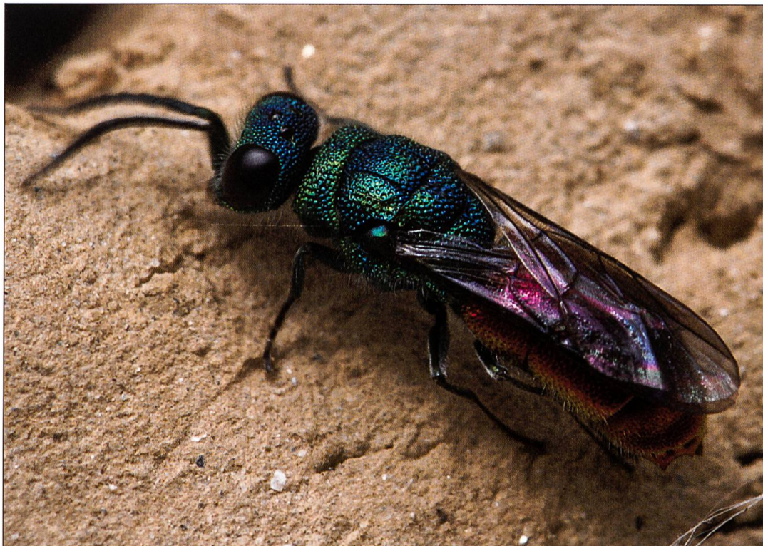
Diese metallisch glänzende Goldwespe weist eine Körperoberfläche voller Trichter auf. Sie ist ein Parasit von Wildbienen.

2004 konnten wir im Zentrum des Lehrgebiets eine ansehnliche Kiesfläche realisieren, eine sogenannte Ruderalfläche. Die spontane Besiedlung durch die Vegetation kann hier studiert werden, insbesondere indem Parzellen alle paar Jahre wieder auf ihren Urzustand zurückgesetzt werden. Nebeneinander liegen ganz frische, leicht und stärker besiedelte Areale und veranschaulichen den Prozess des Bewachsens, welchen man Sukzession nennt.