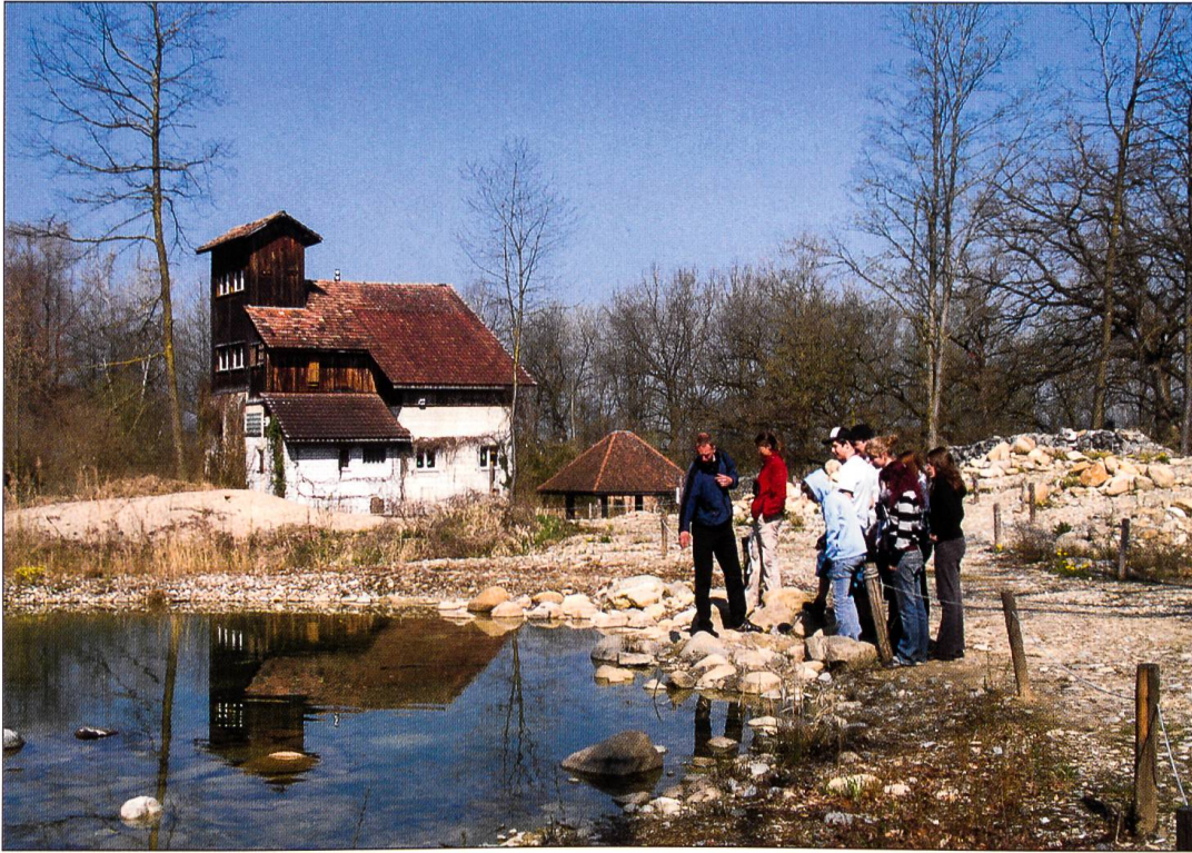
Schüler beobachten auf der neuen Kiesfläche die Kleinlebewesen im grossen Teich. (April 2007).