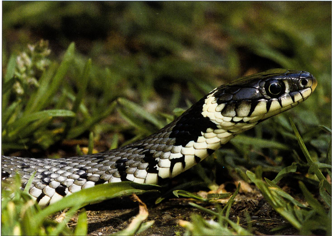
Die Ringelnatter (hier ein Bild aus dem Tessin) ist auch im Naturlehrgebiet heimisch.

chen. Auch wenn keine Klassen hier sind, so herrscht doch während der Arbeitszeit Betriebsamkeit im Nachbarwerk, gelegentlich üben unweit die Jagdschützen (diese Zeiten sind auf unserer Homepage publiziert). Abends oder an den meisten Samstagmorgen ist die ruhigste Zeit. Zu noch ruhigerer nächtlicher Zeit kamen auch schon Vandalen und einmal Einbrecher. Wichtiger als die ist uns aber unsere Hauptklientel: Klassen, vom Kindergarten bis zur Hochschule.