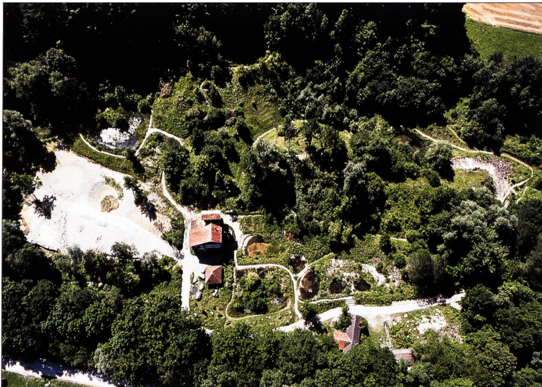
Der zentrale Teil des Lehrgebietes ist ein mosaikartiges halboffenes Gebiet (Luftfoto September 2005). Links vom Turm ist die neue Kiesfläche sichtbar.

Raum unglaublich vielfältiger Lebensraum entstand, in welchem sich Bewohner und Besucher wohl fühlten.