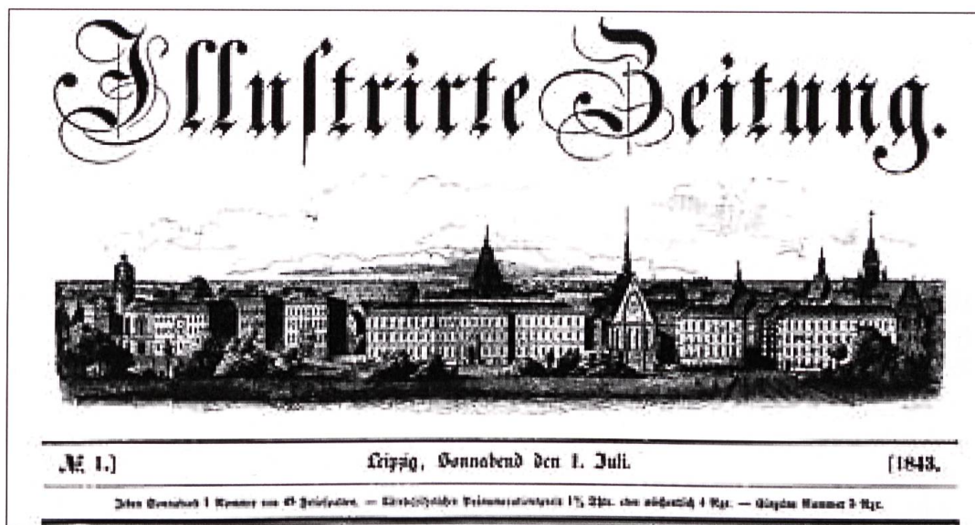
Kopf der «Leipziger Illustrirte Zeitung».