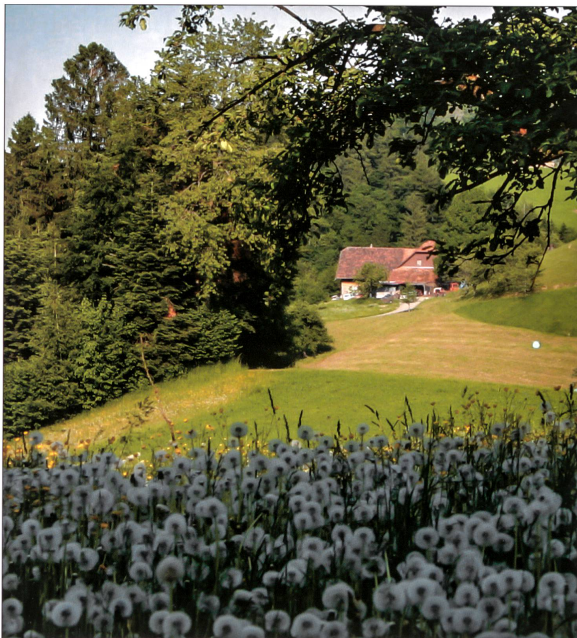
Das Wiggertal ist ein herrliches Arbeits- und Wohngebiet. Ausblick von der Bösegg (Willisau).

Ausflugsorten Menzberg, Willisau, Ettiswil, Luthern, Altishofen, St. Urban...» könnte der Anfang einer gemeinsamen Werbung für den Tourismus sein. Wahrscheinlich ist die geografische Bezeichnung gar nicht so entscheidend. Viel wichtiger dürfte sein, dass wir zu unserem Lebensraum Ja sagen, ihn schätzen und schützen und ihn so gestalten, dass er lebenswert bleibt, dass