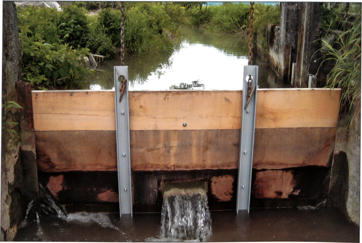
Entnahmeeinrichtung aus Altflachen.

flächenwasser anzureichern, bewährt sich. Dieses Pilotprojekt stösst auf viel Beachtung und grosses Interesse. Edi Gassmann, Wasserbauer, beurteilt das Projekt als rundum erfolgreich: «Der Versickerungsanlage liegt ein einfaches, natürliches System zugrunde. Es integriert sich harmonisch in bestehende Strukturen. Die Kontrollmessungen zeigen, dass das Wasser nebst der mengenmässigen Anreicherung des Grundwassers auch als Trinkwasser hervorragend schmeckt. Wasser ist wertvoll, Wasser verdient Respekt, damit wir eines unserer wertvollsten Privilegien auch weiterhin unbedacht geniessen können: Trinkwasser einfach ab dem Wasserhahn trinken zu können.»