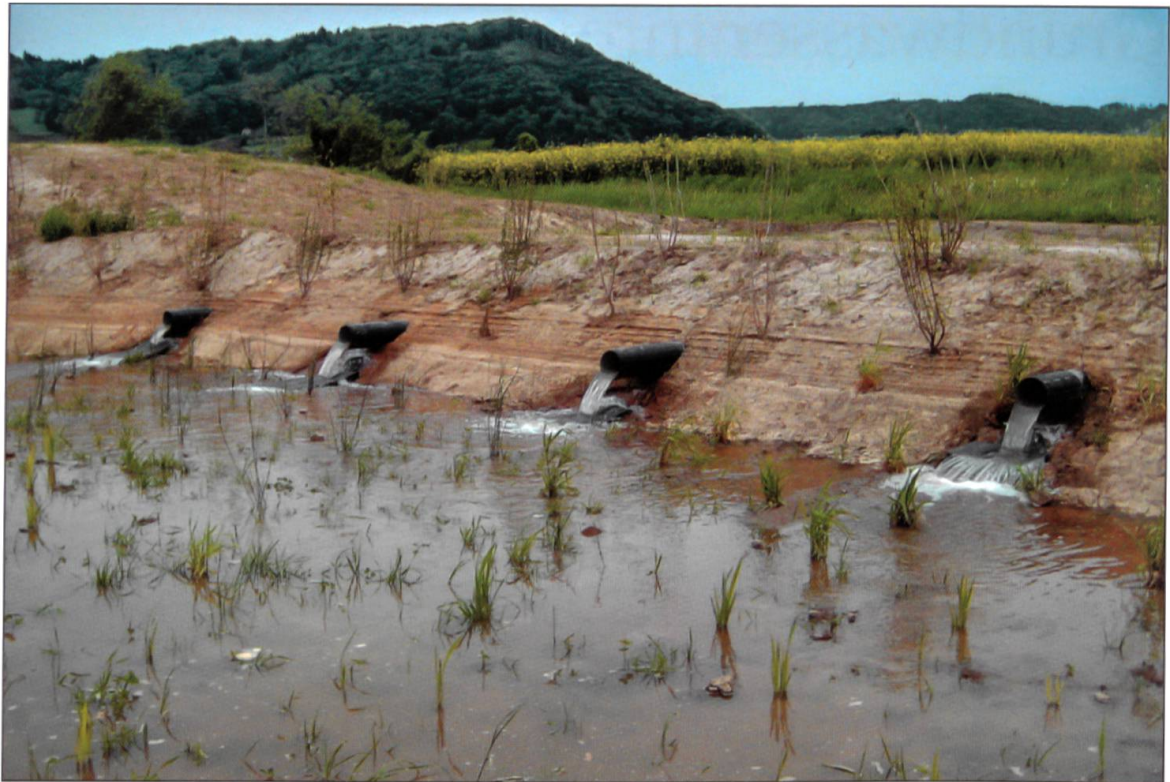
Versickerungsbecken mit Bepflanzung.