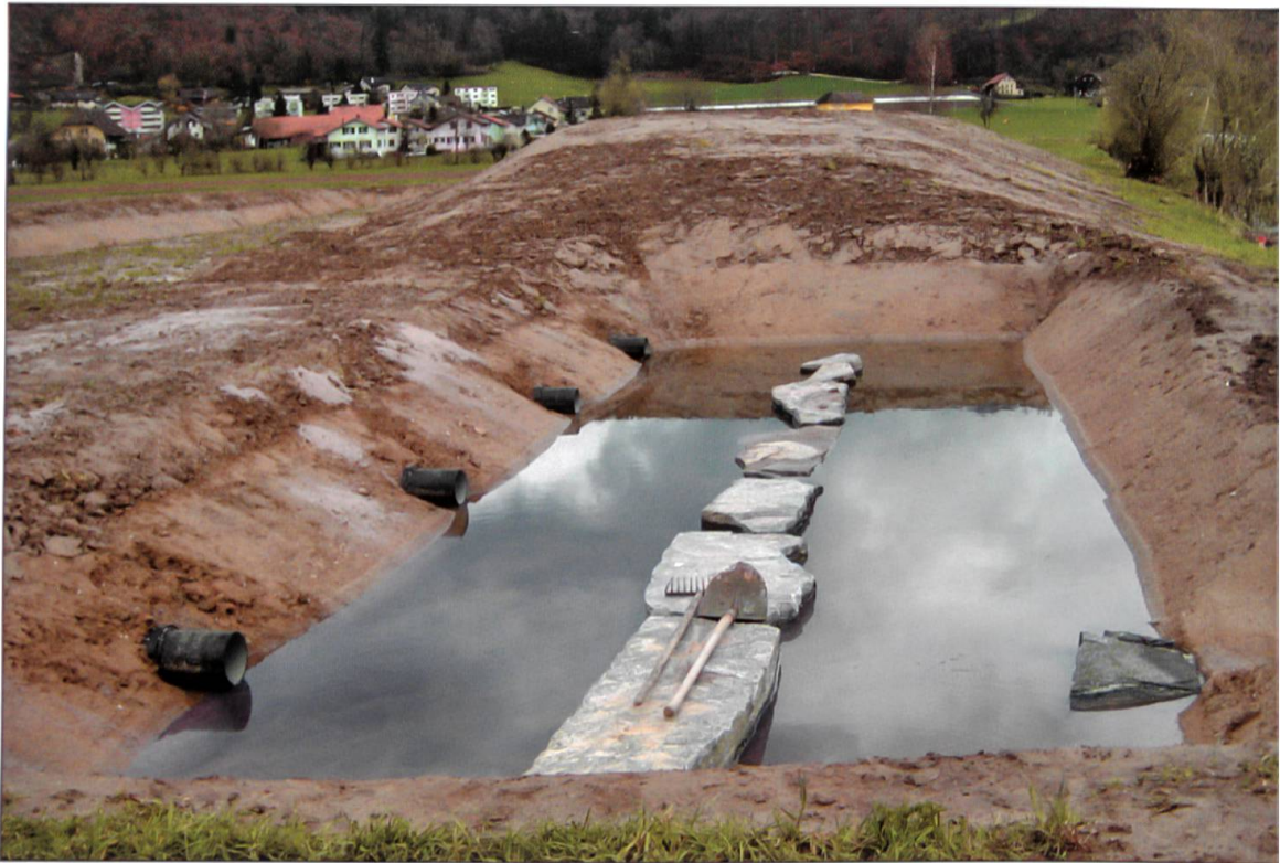
Vormulde als Absatzbecken.

Schacht wird die Qualität des gereinigten Oberflächenwassers überwacht, bevor dieses in eine tiefere, sickerfähige Schicht aus einem Meter Betonkies unterhalb der Sperrschicht geleitet wird. Durch diesen Betonkies sickert das Wasser dann selbstständig in die darunter liegenden kiesigsandigen Lockergesteine und reichert dort den Grundwasserstrom an. Über den zentralen Sickerschacht kann die Wasserzufuhr ins Grundwasser jederzeit unterbrochen werden.