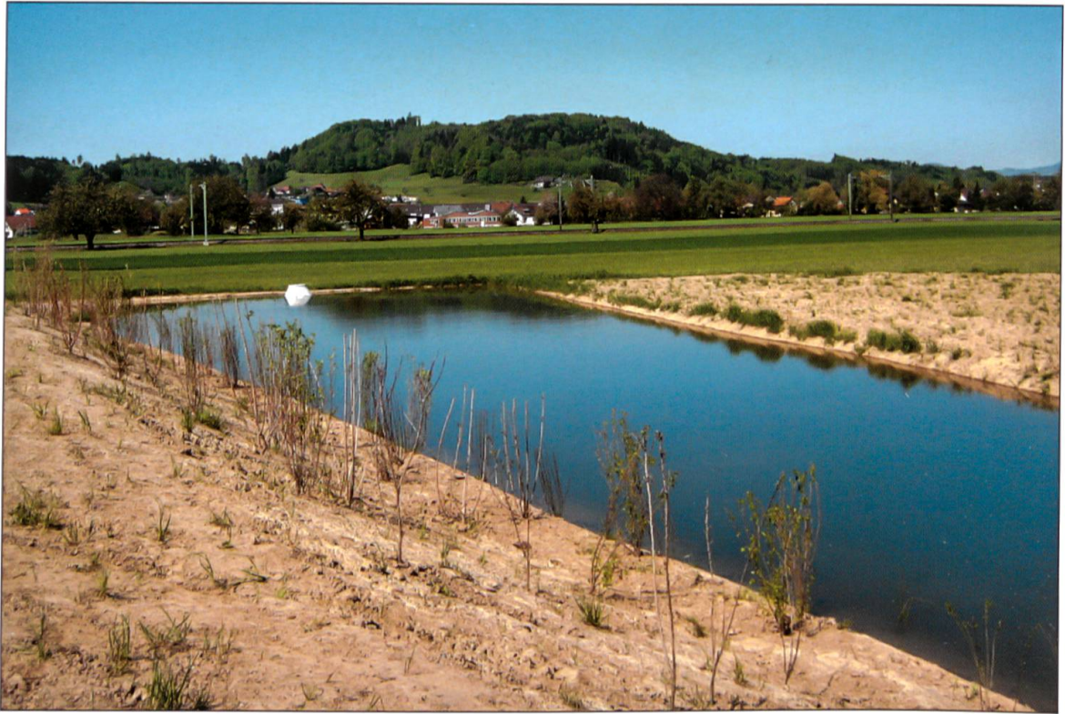
Versickerungsbecken in Betrieb.

Wassers zu erhalten. Sechzehn Tage nach dem Markierstoffeintrag wurde beim Pumpwerk Altachen der Farbstoff nachgewiesen. Auch die weiter talabwärts liegenden Pumpwerke profitierten vom Eintrag. Und ganz wichtig war: Es konnte kein Farbastrag in die Oberflächengewässer (Wigger, Seitenbäche, Drainagen) festgestellt werden. Mit einer maximalen Strömungsgeschwindigkeit von 100 Meter pro Tag (Vermutung: unterirdische, sehr gut durchlässige Fließwege, alte Flussverläufe) ist die Reinigungswirkung im Grundwasserleiter in diesem Talabschnitt eher gering. Entsprechend wichtig ist ein strukturiertes Filtersystem für die Versickerungsanlage, damit die im Oberflächenwasser mitgeführten Schadstoffe nicht zu unzulässigen Belastungen des Grundwassers