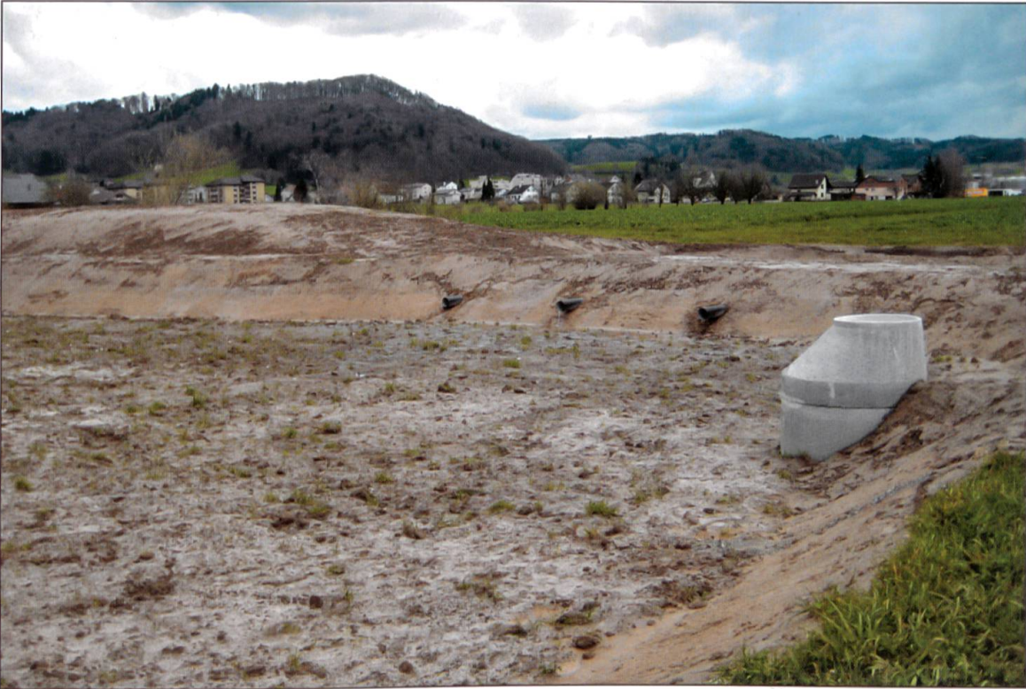
Versickerungsbecken im Bau.

meinen Wasser von hervorragender Qualität. So können beispielsweise 38 Prozent – das ist mehr als ein Drittel – des gewonnenen Trinkwassers ohne jegliche Aufbereitung ins Versorgungsnetz eingespeist werden. Ein Drittel wird einstufig mit einer Entkeimungsanlage aufbereitet. Dabei wird Ozon- oder UV-Strahlung eingesetzt. Der Rest durchläuft schliesslich eine mehrstufige Aufbereitung. Vor allem Oberflächenwässer werden in mehreren Schritten mit Schnell- und Langsam-Sandfiltern oder seit einigen Jahren auch mittels schonender Membranfiltration aufbereitet.