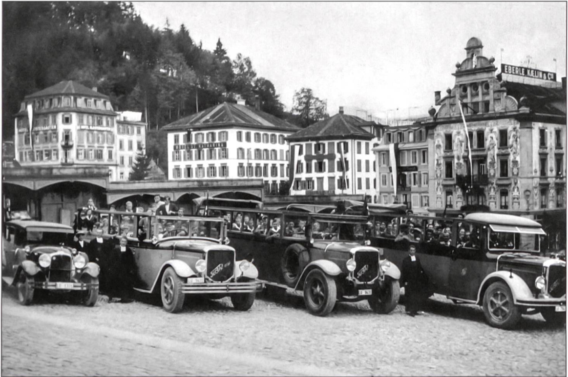
Carpark der Gebrüder Galliker Hofstatt mit Pilgern auf dem Klosterplatz Einsiedeln, 1934.

fahrzeuge für den Personen- und Warentransport), zwei Langholzwagen, einen Kipper und drei Personenwagen.