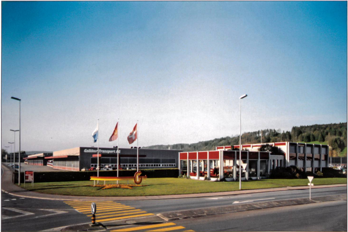
Firmenareal der Galliker Transport AG Altishofen nach dem Neubau 1980: Einstell- und Lagerhalle, Werkstatt- und Servicegebäude sowie Verwaltungstrakt (von links nach rechts).

verarbeitet sie in der Nacht und stellt sie am nächsten Morgen um sieben Uhr zu. Der Transport von Paketen dauert damit einen Tag weniger lang als bei der Post. Dieser Betriebszweig wird 2002 an einen Mitbewerber verkauft.