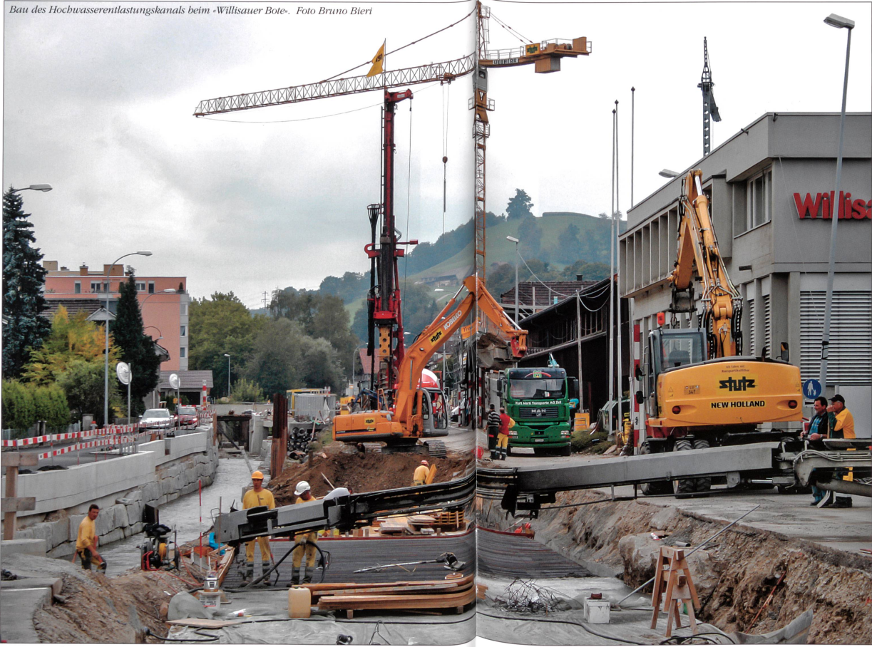
Bau des Hochwasserentlastungskanal beim «Willisauer Bote».