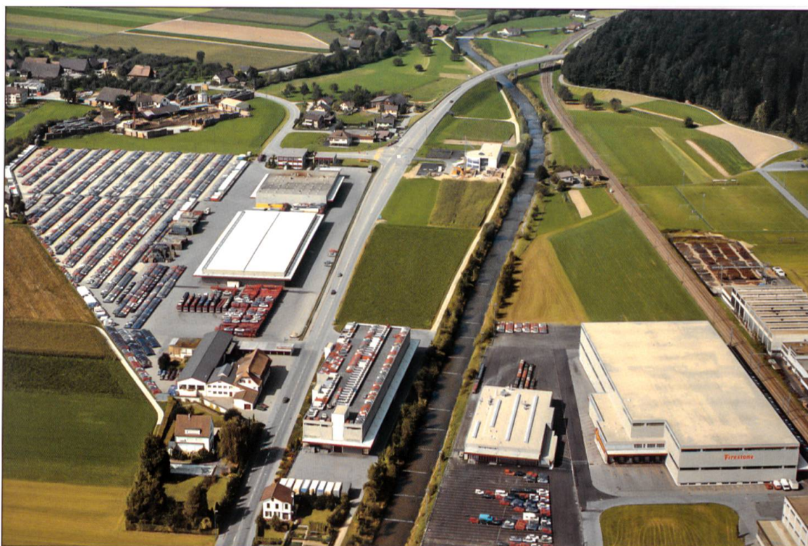
Das 1984 erbaute Lagerhaus 1 (links der Wigger) ermöglicht den Durchbruch im Stückgutverkehr. Mit dem Lagerhaus 2 (rechts aussen) realisiert Galliker den ersten Bahnanschluss. Bildmitte: PDI (Pre Delivery Inspection).

von Coop samt Fahrzeugen und Personal. Am 1. Januar 1997 startet Galliker in Pratteln mit 30 neuen Volvo-Sattelzügen den Betrieb.