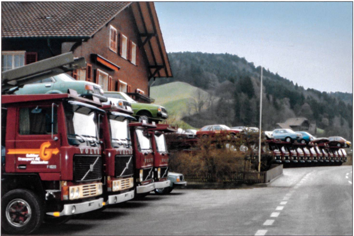
Ende 1979 stehen die Fahrzeuge mit neuem Logo auf dem zu eng gewordenen Firmenareal in Hofstatt für den Umzug nach Altishofen bereit.

dieser Investition kann Galliker auch Kunden im Automobilsektor alles aus einer Hand anbieten. Autoimporteure können nun Verzollung, Aufbereitung, Umschlag und Transport ihrer Autos integral in Auftrag geben. Damit ist der Geschäftsbereich Car Logistics geboren. Ein Grossauftrag für die Aufbereitung, den Umbau und die Verteilung von Autos der Marke Renault im Jahre 1993 führt zu einem weiteren Wachstum der Car Logistics. Es werden nun rund 100 000 Autos bearbeitet und verteilt. Im Jahre 2001 errichtet Galliker in den ehemaligen Produktionshallen der Firma Prolux in Nebikon ein zusätzliches modernes Servicecenter für das Personewagengeschäft. Gleichzeitig wird die Lagerkapazität auf 4 000 Fahrzeuge ausgebaut. Diese Ausbauschritte ermögli-