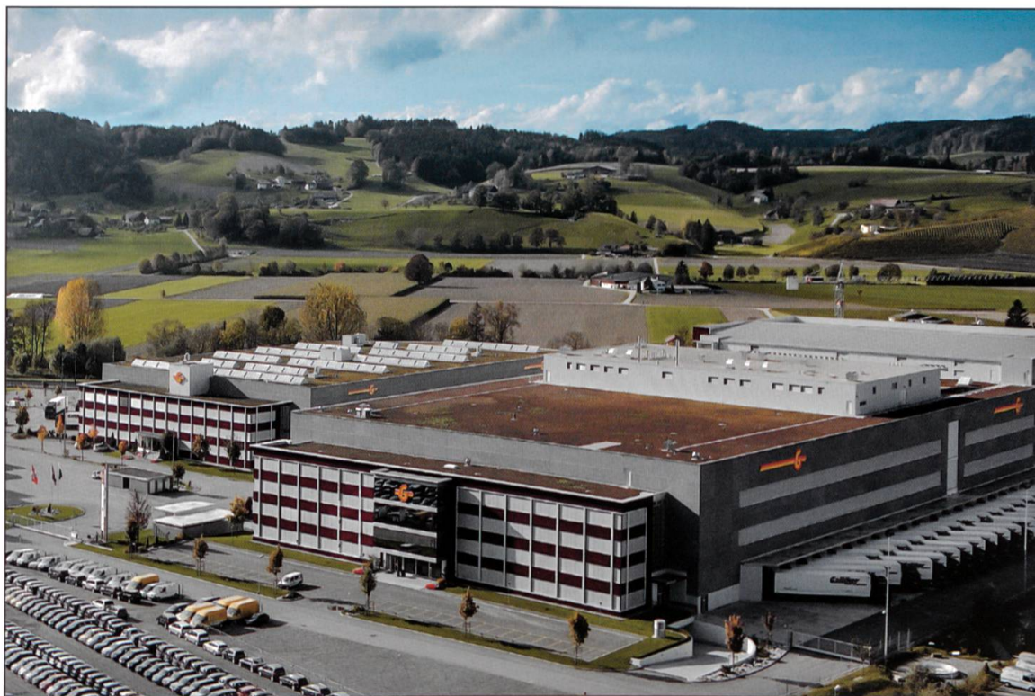
In den Jahren 2001 und 2004 entstehen in Altshofen die Logistik Center 2 (Food, links) und 3 (Frigo). Im Logistik Center 3 mit dem Hochregal-Tiefkühlager befindet sich auch die Grossbäckerei von HicoPain.