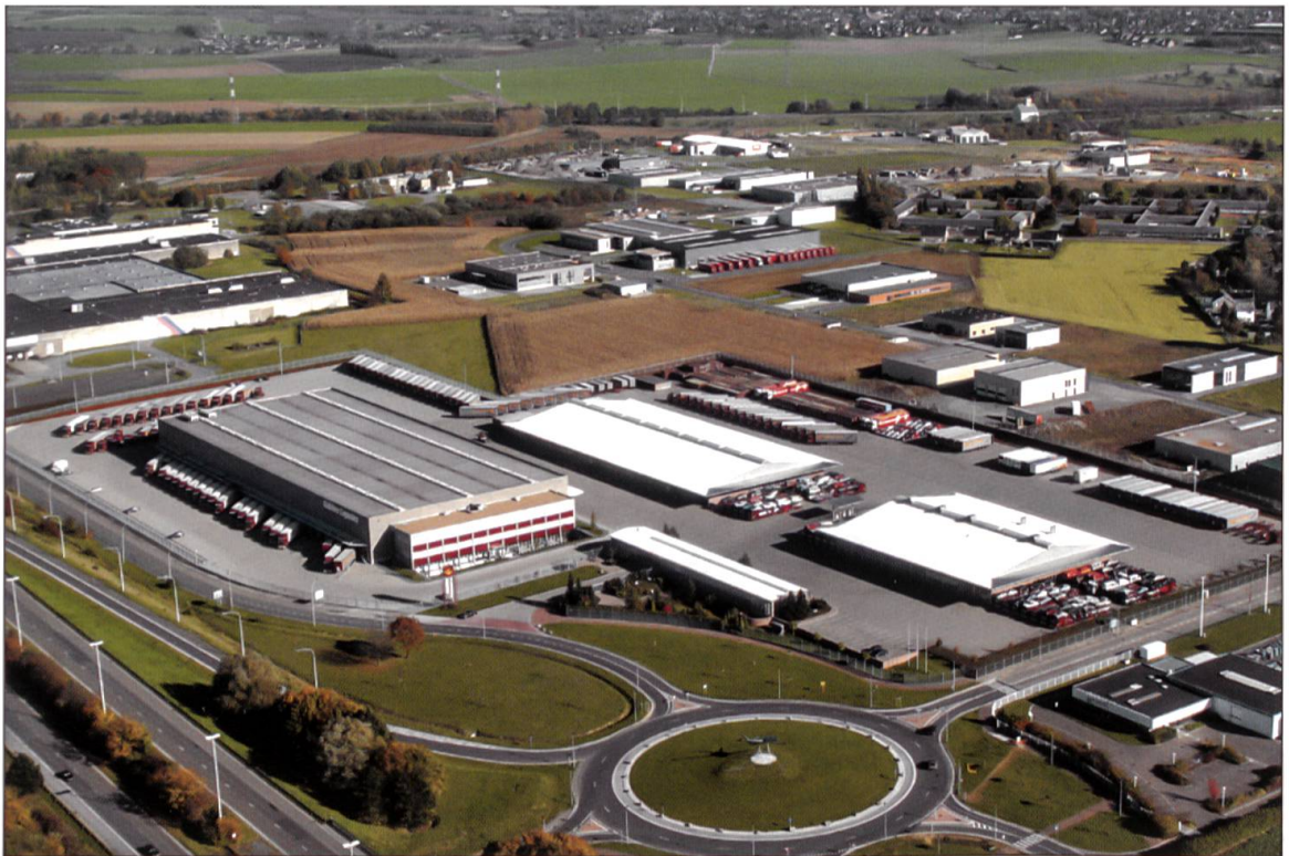
Die 1992 im Zuge der Internationalisierung des Geschäftes erbaute belgische Niederlassung Milmort wurde 2003 mit einem grossen Logistik Center erweitert.

zeugverkehrs ab. Seit der Firmengründung 1918 verzeichnet der technische Fortschritt im Fahrzeug- und Strassenbau sowie im Transport- und Logistiksektor reihenweise Quantensprünge. Um 1900 ist der Kanton Luzern weitgehend autofrei. In der Stadt Luzern gibt es 60 Pferdedroschken. Besonders auf dem Lande herrscht gegenüber den «Luxusvehikeln» eine feindliche Einstellung. So verfügt Obwalden eine Geschwindigkeitslimite von zehn Kilometern pro Stunde, erhebt Strassenbenützungsgebühren und schliesst 1905 den Brünigpass für den Automobilverkehr. Das Auto hat einen schweren Stand. Das Pferd ist um 1900 der wichtigste Antrieb auf unseren Strassen. Der Erste Weltkrieg bringt den Privatverkehr fast zum Erliegen. Erst nach