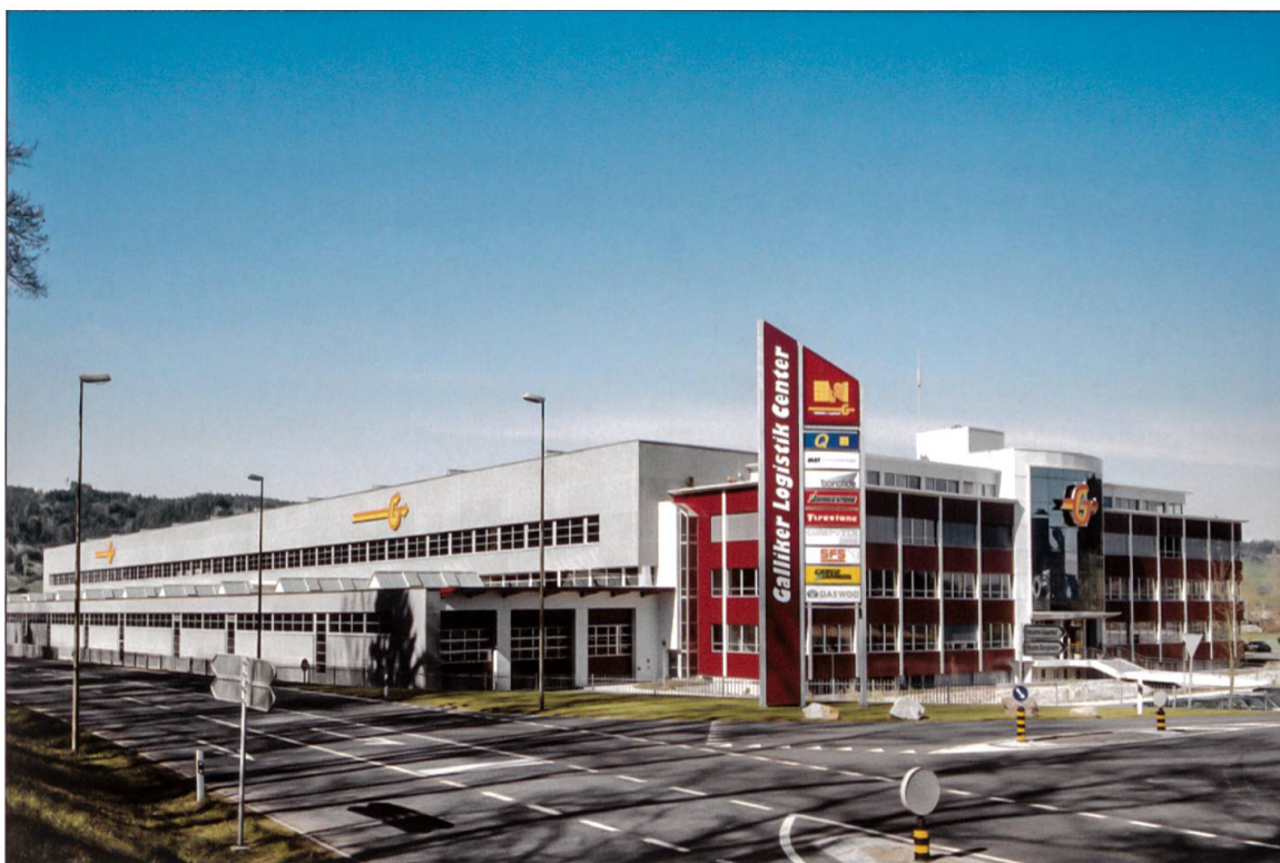
1996 entsteht in Altishofen das mit modernsten Infrastrukturen ausgerüstete Logistik Center 1. Dieser Neubau mit Geleiseanschluss macht aus der Transportfirma endgültig eine Logistikunternehmung.

Containerumschlag realisiert. Zwischen Belgien und Schweden werden die Güter mit unbegleiteten Aufliegern auf dem Wasserweg transportiert. Transporte bedeutender Tonnagen für die belgische Stahlindustrie befördert Galliker mit Wechselbrücken auf der Bahn. Die Firma Galliker erhält im Jahre 2003 das CO 2 -Label. 2005 schliesst sie mit dem Bundesamt für Umwelt eine Zielvereinbarung ab. Danach verpflichtet sie sich, ihren CO 2 -Ausstoss gegenüber 1990 bis 2010 um zehn Prozent zu reduzieren. Die jährlichen Audits zeigen, dass Galliker auf Kurs ist.