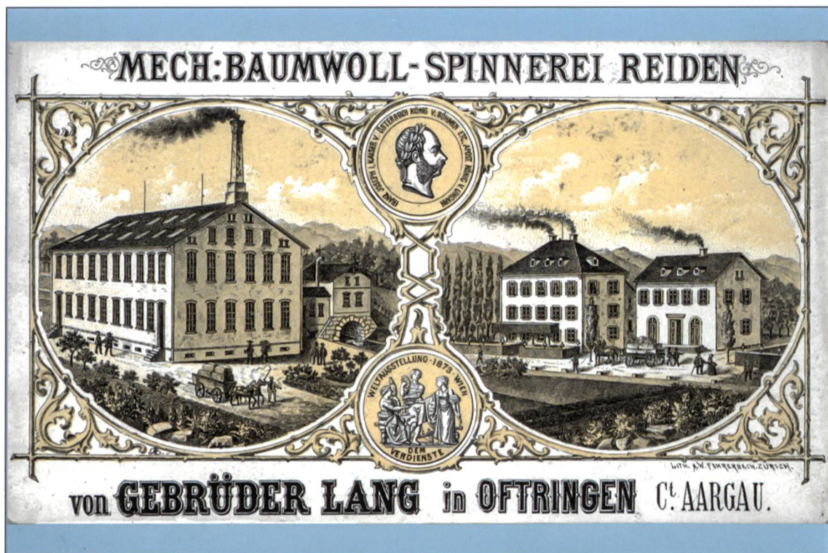
Karte um 1867: Links die 1867 eröffnete mechanische Baumwoll-Spinnerei in Reiden, rechts die Stammgebäude der Gebrüder Lang in Oftringen.

Kids». Die fortlaufende Nummerierung («Fatto a Mano» Nr. 167: Damen-Strickmode Frühjahr/Sommer 2009) und «Fashion Kids» (Nr. 168: Strickmode für Ihre Allerliebsten) geben einen Hinweis auf die Anzahl der erschienenen Hefte.