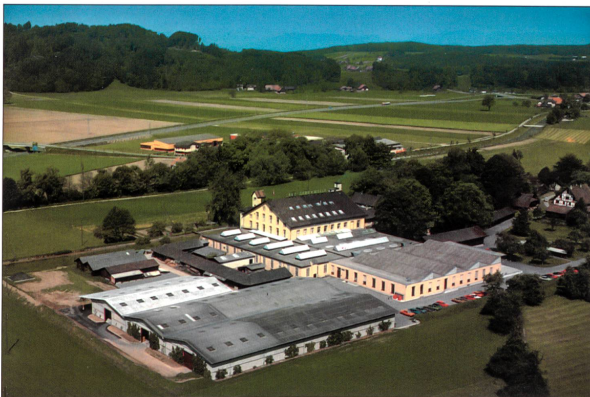
Areal und Betriebsgebäude der heutigen Lang Yarns AG: In der Mitte das Hochhaus, davor die im Laufe der Jahre erfolgten Erweiterungen. Das Riegelhaus am rechten Bildrand ist die Reider Unterwasser-Mühle, erbaut im 18. Jahrhundert.