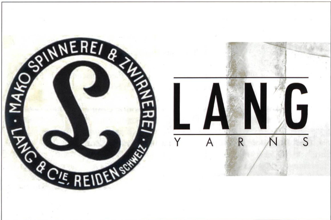
Links das Signet der Spinnerei & Zwirnerei Lang & Cie aus Reiden, als in Reiden noch produziert wurde. Rechts das Logo für alle Produkte, die von Lang Yarns heute weltweit vertrieben werden.