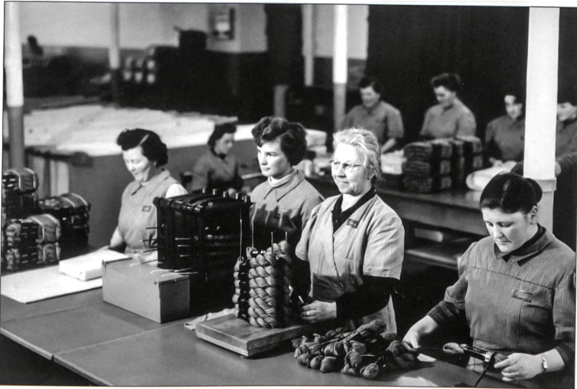
Die Handstrickgarne werden etikettiert und verpackt (um 1940).

erneuerte Erich Lang den Produktionsapparat und erweiterte die Fabrik um mehrere Bauten. Die Ausdehnung des Fabrikationsprogrammes durch Aufnahme von Wollstrickgarnen und das Insistieren und Festhalten am Qualitätsbegriff trugen wesentlich dazu bei, die Marke «Lang-Garn+Wolle» im eigenen Land und darüber hinaus bekannt zu machen. Ab 1926 schaltete die Firma die Grossisten aus und lieferte direkt an Läden und Warenhäuser in der ganzen Schweiz.