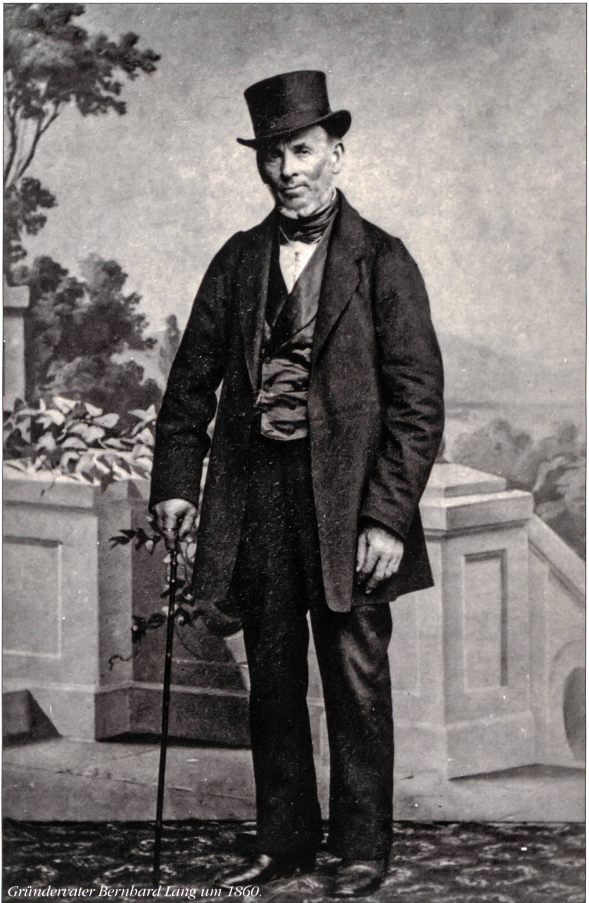
Gründervater Bernhard Lang um 1860.