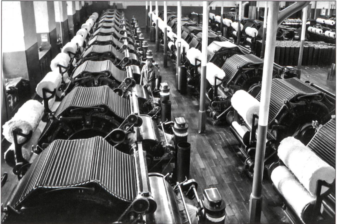
In der Karderie wurde die Baumwolle zum Spinnprozess vorbereitet (um 1950).

nehmenden synthetischen Chemiefasergarne auf, deren Verarbeitung intensive Studien und Versuche erforderten. In der Folge entwickelte sich die Firma Lang zur Spezialitätenspinnerei für modische, qualitativ hoch stehende Textilien (Vorhänge, Dekostoffe). Diese wurden nach der Öffnung der Märkte ab den 60er-Jahren auch ins Ausland geliefert.