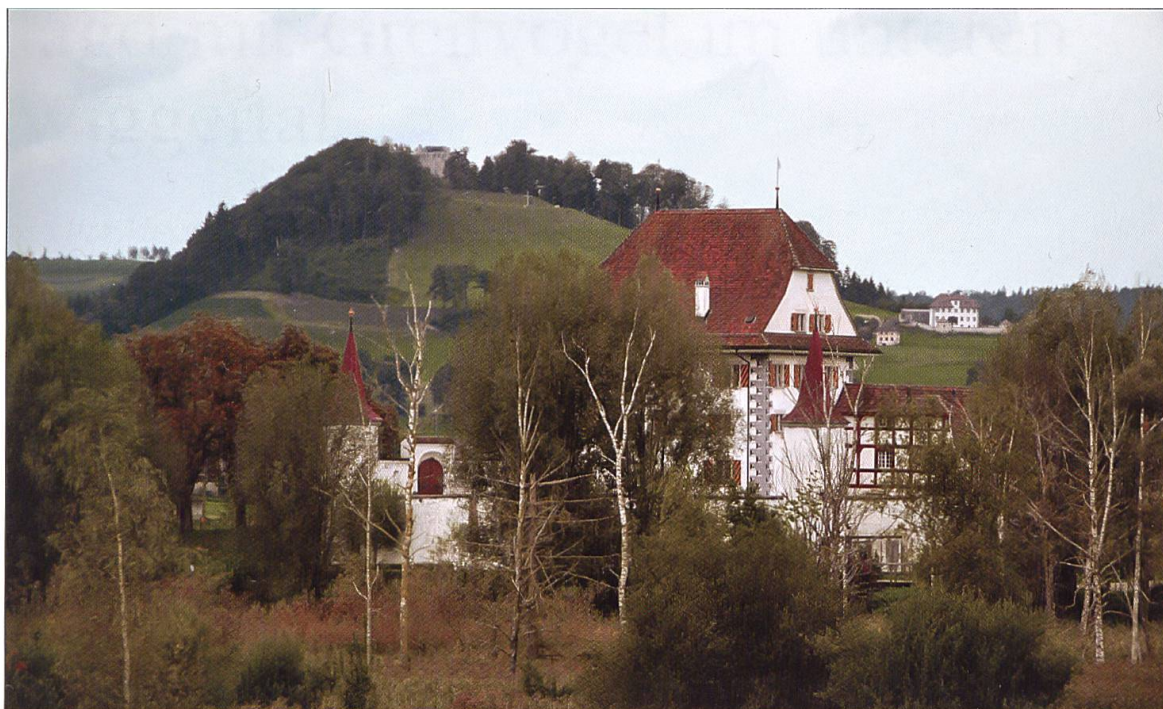
Schloss Wyber, umrahmt von der Kastelen Alberswil und dem Schloss Alberswil.