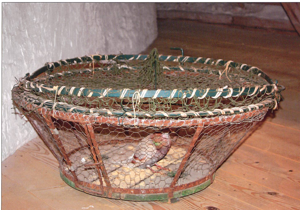
Jagdmuseum Utzenstorf: Korb für den Wildvogelfang.