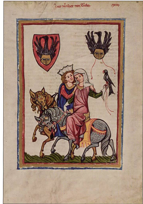
Wernher von Teufen.

Jagd mit abgerichteten Falkenarten. Im 16. und 17. Jahrhundert spielte nebst der Beizjagd auch der Beizvogelfang in anderen Regionen der Schweiz eine wesentliche Rolle.