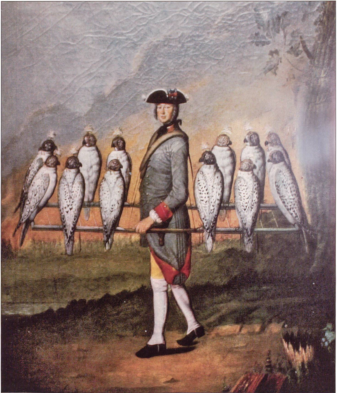
Jagdmuseum Utzenstorf, Falkonierknecht mit Trage. Gemälde von Ch. A. Hirsch, 1752.

Überlieferung). Doch im Osten wie in Mitteleuropa liess das Interesse an der teuren und aufwendigen Jagd mit Falken im 18. Jahrhundert nach. Horst Schöneberg schreibt in seinem Werk «Falknerei – Der Leitfaden für Prüfung und Praxis»: «Das herrschaftliche Inter-