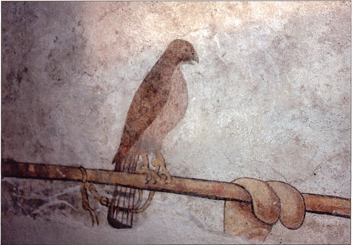
Freske im Schloss Wyber in Ettiswil.

raubten diese aus. Die Jungen oder Eier gelangten anschliessend zum Verkauf. Ab 1972 wurden die Horste im Französischen und Schweizer Jura mit den Mitteln des Fonds d'intervention pour les rapaces (FIR) unter Bewachung gestellt. Verlassene Nistplätze in verschiedenen Landesgegenden waren in der Folge wieder von adulten oder noch nicht ganz brutreifen Vögeln besetzt.