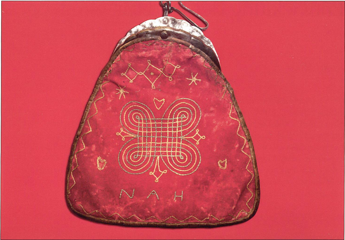
Jagdmuseum Utzenstorf: Falknertasche aus dem Mittelalter.

hielt an seinem Hof in Aachen ebenfalls Beizvögel. Der Adel fand Gefallen an dieser Art Jagd und schränkte die allgemeine Jagdnutzung (die sogenannte Volksjagd) ab dem 5. Jahrhundert immer weiter ein. Er behielt herrenlose Wälder und belegte diese mit dem Bann für die sogenannte Königsjagd. 802 erklärte Karl der Grosse alles freie Gebiet zum Besitz der Krone. So war denn auch die Beizjagd den europäischen Königs- und Fürstenhäusern vorbehalten. Nach römischem Recht konnte jedermann jagen – jedoch war die Jagd an Grundbesitz gebunden.