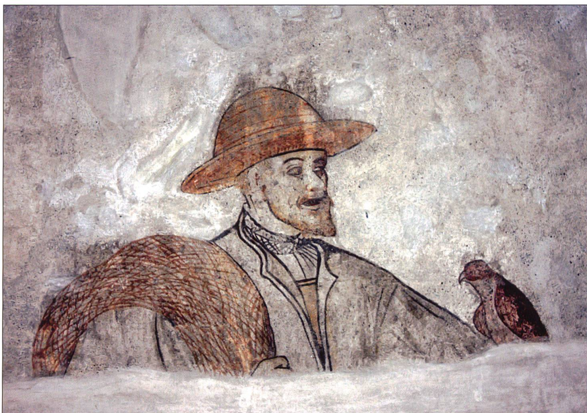
Freske im Schloss Wyber in Ettiswil, eventuell Petermann Feer, Staatsmann und Heerführer (1454–1519).

des, Hetzen (hessen) das Jagen im freien Feld gegen ein Gehölz, Beissen (venari), das später zum Unterschied von Beissen (mordere) zu «Beizen» umbenannt wurde, das Jagen mit Hunden oder Habichten und Birsen das Jagen im Gehege.