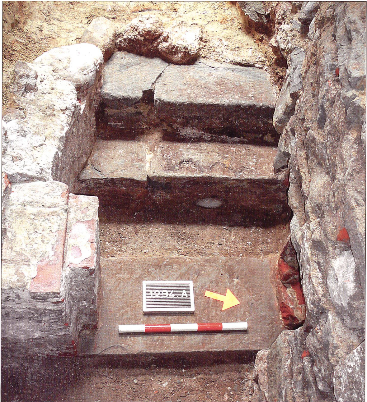
Der Nebeneingang in der nordwestlichen Ecke des Kellers.