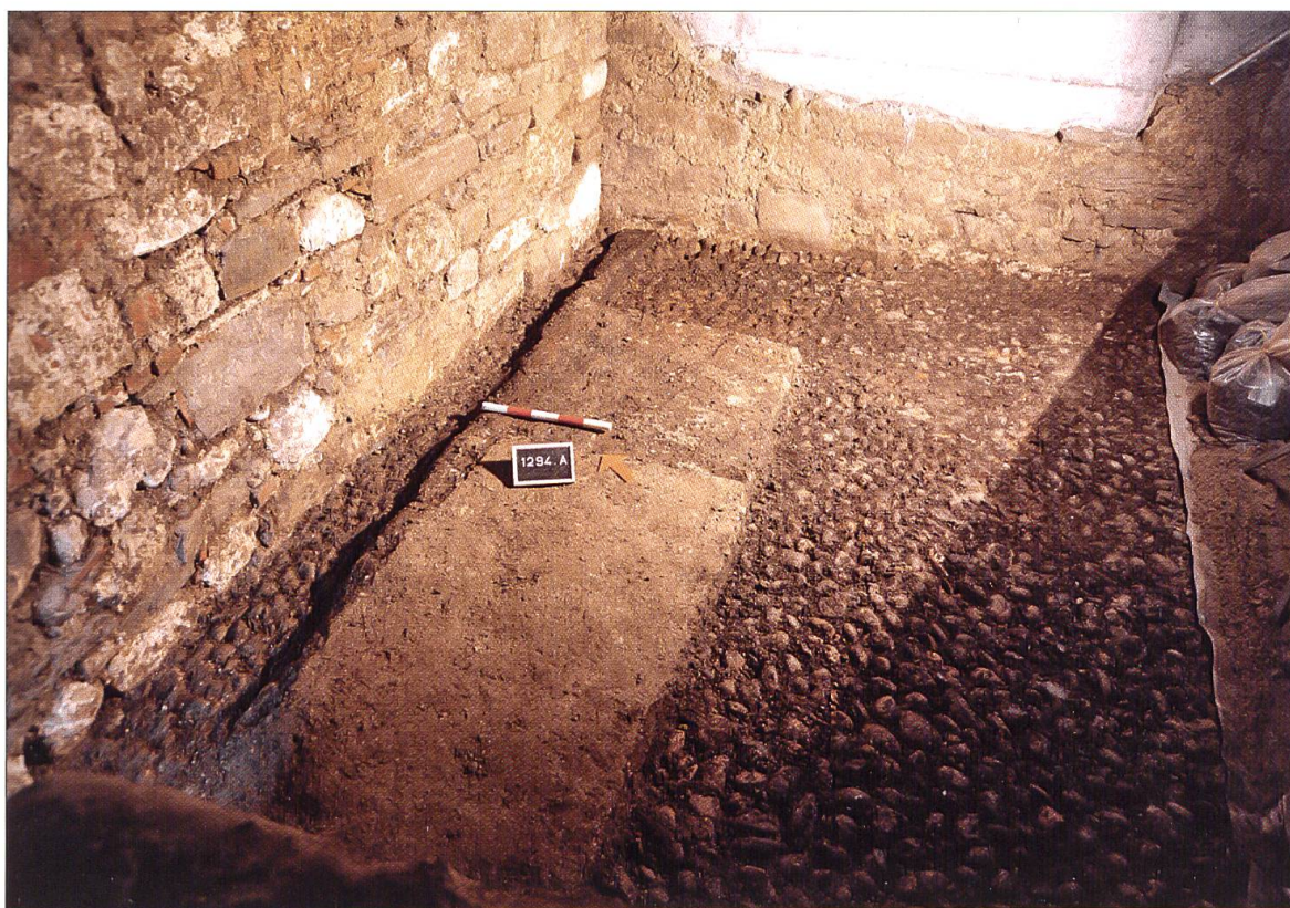
Das Fundament der Nordfassade der Schlossscheune (links) wurde direkt auf die Pflästerung des mittelalterlichen Kellers gestellt. Ansicht aus südwestlicher Richtung.