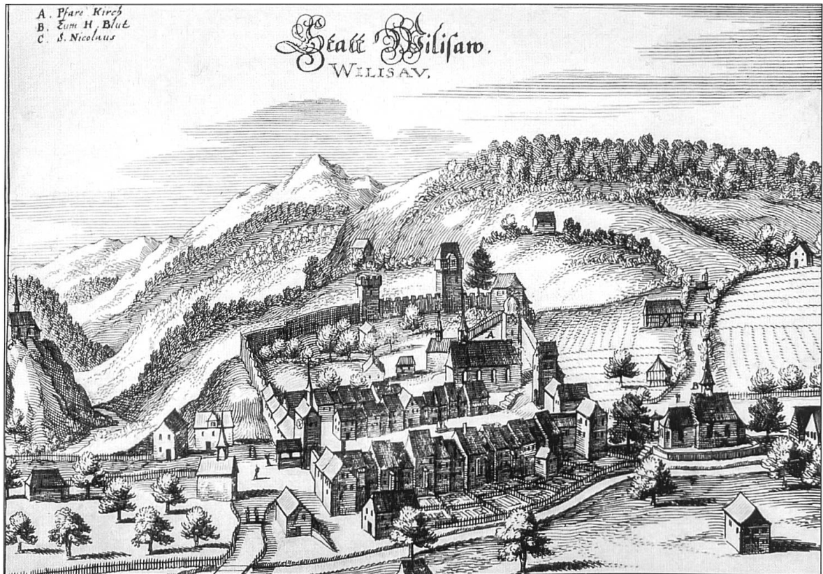
Die Schaffnerei des Klosters St. Urban und das Haus Bergli am Standort der ehemaligen Stadtburg (links) auf dem Stadtprospekt von Matthäus Merian, 1654.