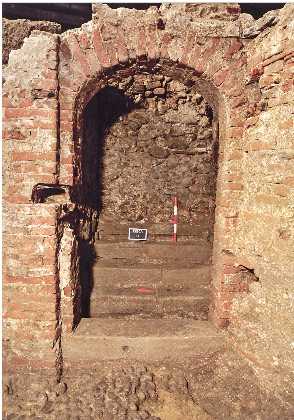
Hinter dem südöstlichen Eingang sind die Treppenstufen sowie die kurz vor dem Bau der Schlossscheune eingebaute Quermauer zu erkennen. Ansicht von Westen.