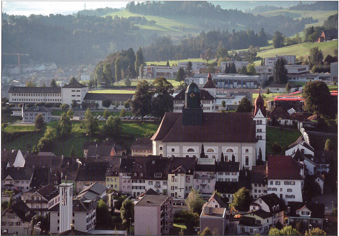
Die Scheune steht hoch über der Stadt im Bereich der südwestlichen Ecke der mittelalterlichen Stadtbefestigung. Im Steilhang nördlich der Schlossscheune gut zu erkennen: das letzte noch frei stehende Teilstück der Stadtmauer, welches direkt auf die Schlossscheune zuläuft. Links im Bild das Haus Bergli am Standort der ehemaligen Stadtburg von Willisau. Aufnahme aus nördlicher Richtung.