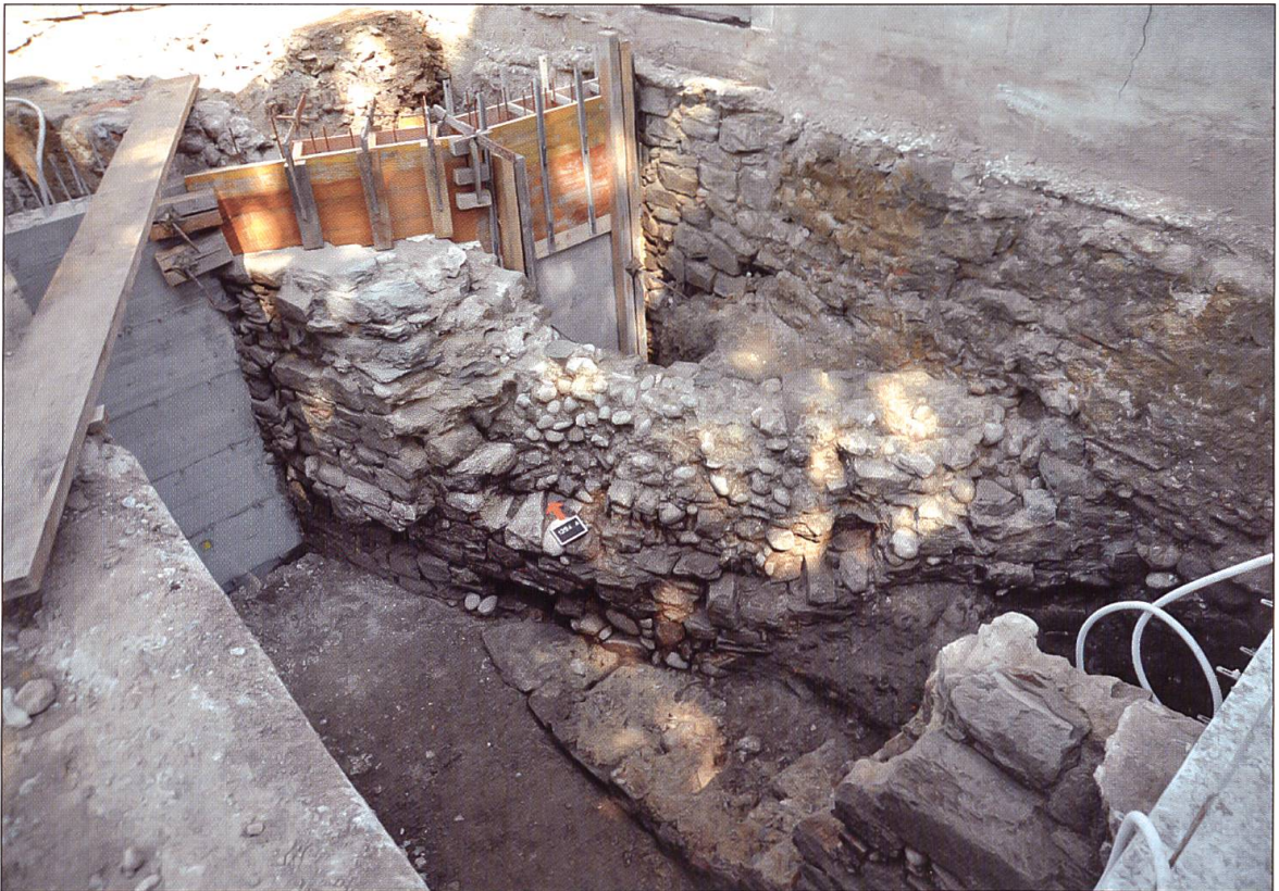
Die Stadtmauer im Bereich des westlichen Vordachs der Schlossscheune. Im Vordergrund die Stützmauer des Vordachs der ersten Bauphase der Schlossscheune. Ansicht von Westen.

Abgesehen vom Keller des Kirchherrenhauses hat sich auf der Stadtseite kein aufgehendes, das heisst ursprünglich sichtbares Mauerwerk erhalten. Im Gegensatz dazu ist auf der Feindseite aufgehende Substanz erhalten geblieben, die jedoch im Rahmen der Untersuchung nur beschränkt zugänglich war. Das Scharfenfenster des Kellers belegt, dass die Südfassade der Stadtmauer zumindest vom Fenster an frei gestanden haben muss. Tatsächlich weisen auch die massiven, bei der Ausgrabung festgestellten Planieschichten südlich der Stadtmauer darauf hin, dass sich der bei der Ausgrabung der Stadtburg festgestellte Wehrgraben bis zur Hangkante auf der Westseite der Stadt erstreckt haben muss (JbHGL 22, 2004, S. 238-246, v.a. S. 242). Die Unterkante des