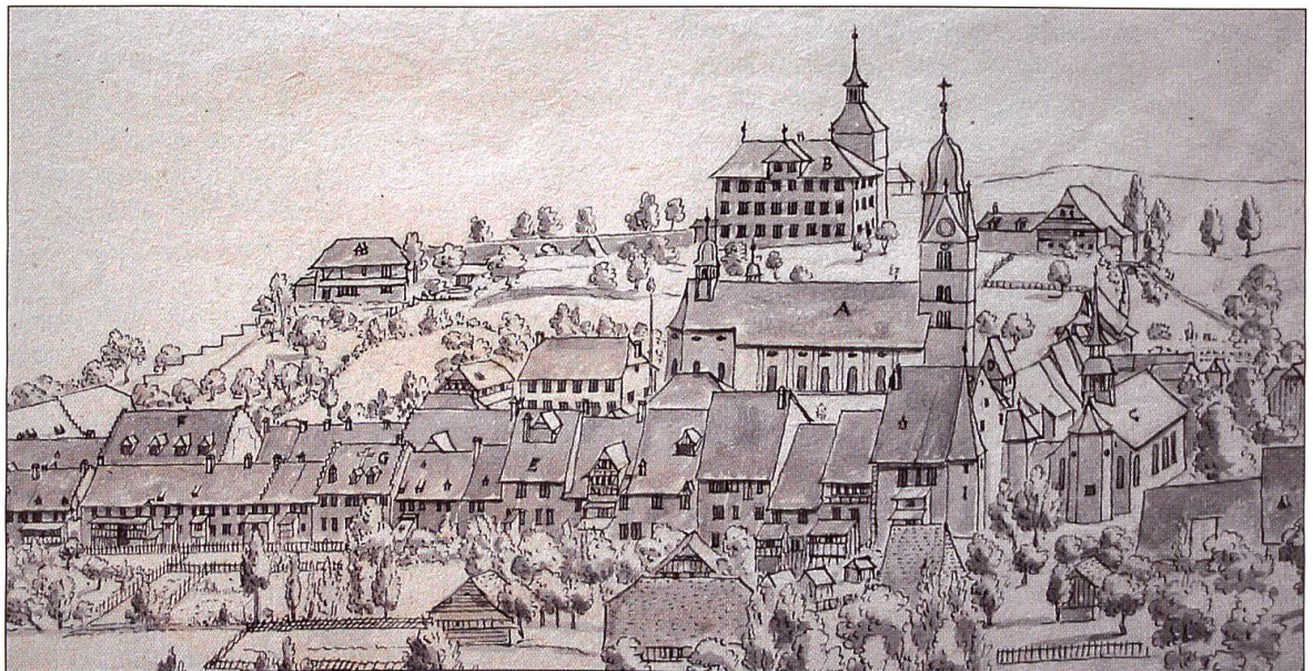
Der Vorgängerbau der Schlossscheune und das Haus Bergli auf einer undatierten Tuschezeichnung von Johann Ulrich Schellenberg (1709–1795), Kunstmuseum Winterthur.