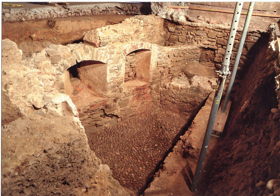
Stadtmauer mit Schartenfenstern, Kellermauern Ost und West und Fundament der Schlossscheune. Ansicht aus nordöstlicher Richtung.