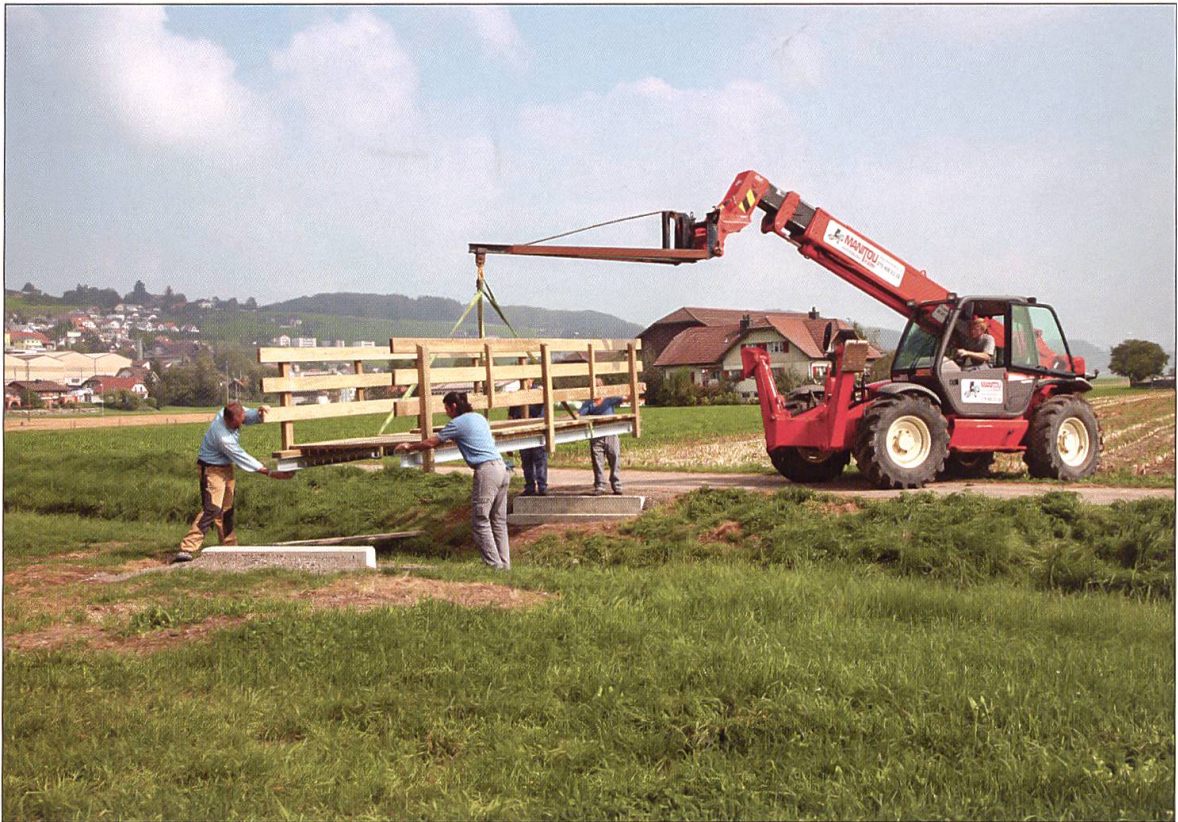
Die von der Strafanstalt Wauwilermoos erstellte und gespendete Brücke über einen Entwässerungsgraben wird gesetzt – der Lernpfad nimmt Gestalt an.