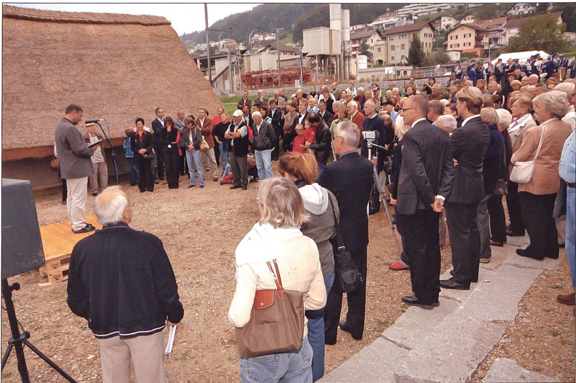
Einweihung der Gesamtanlage Lernpfad und Pfablbausiedlung am 26. September 2009.