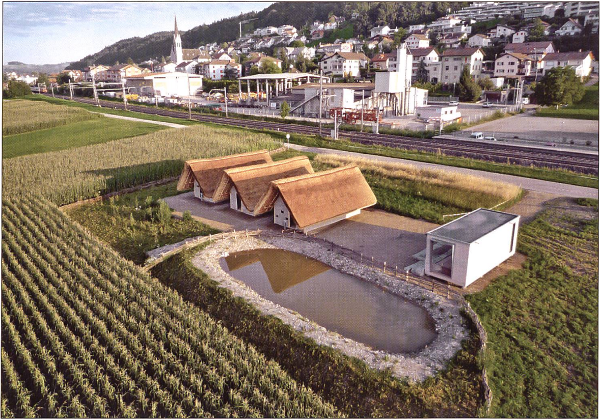
Die Siedlung ist fertig.