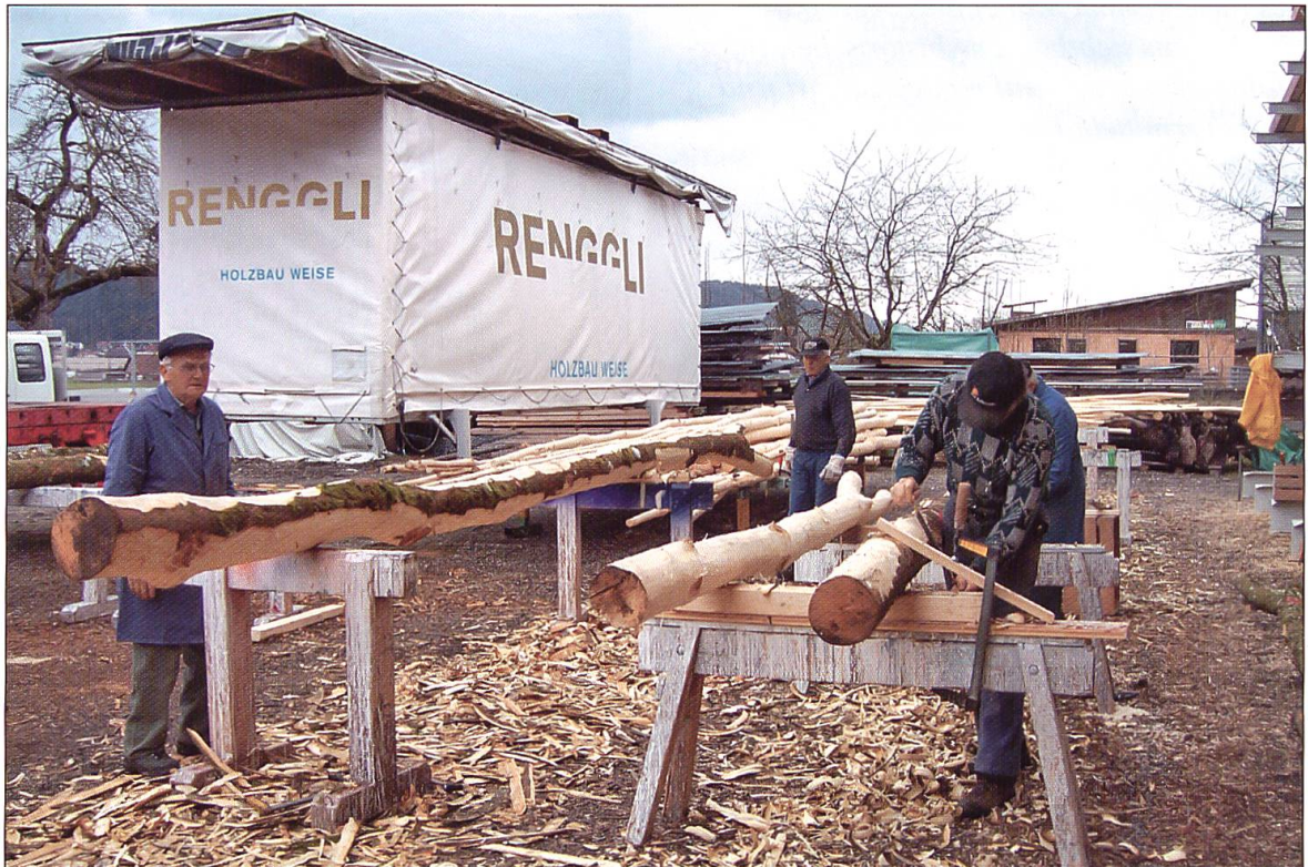
Zurichten des Bauholzes im Holzbauwerk der Firma Renggli, Schötz.