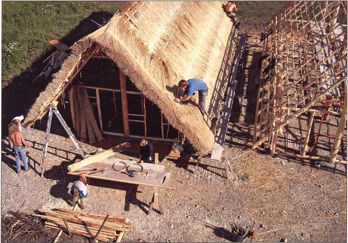
Die Bauten werden gedeckt.