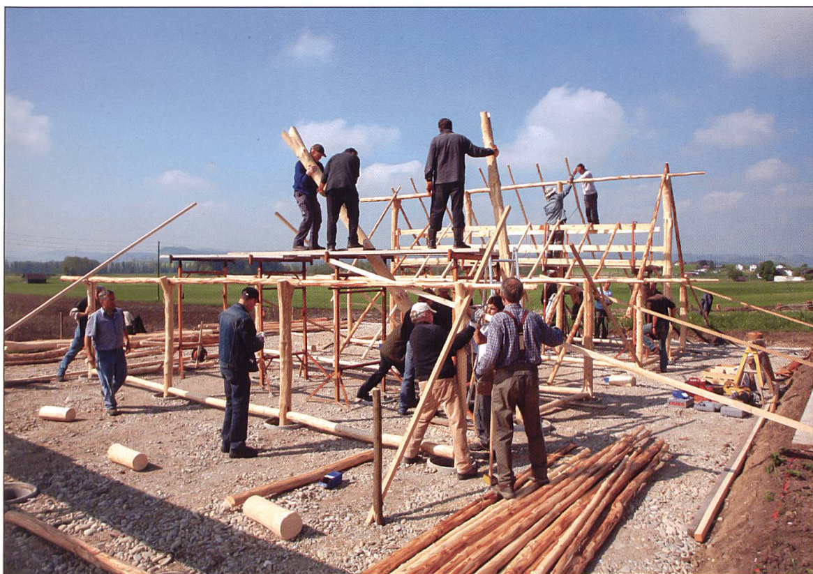
Aufrichten der Rohbauten.