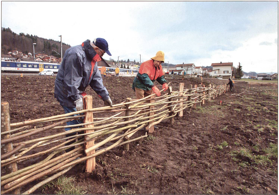
Erstellen des Flechtwerkzauns um die Siedlung.