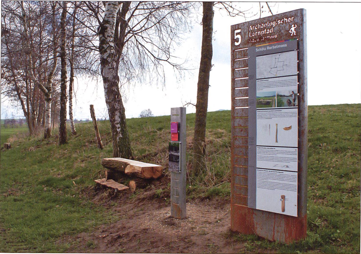
Die Informations- und Jugendstelen des Lernpfads.