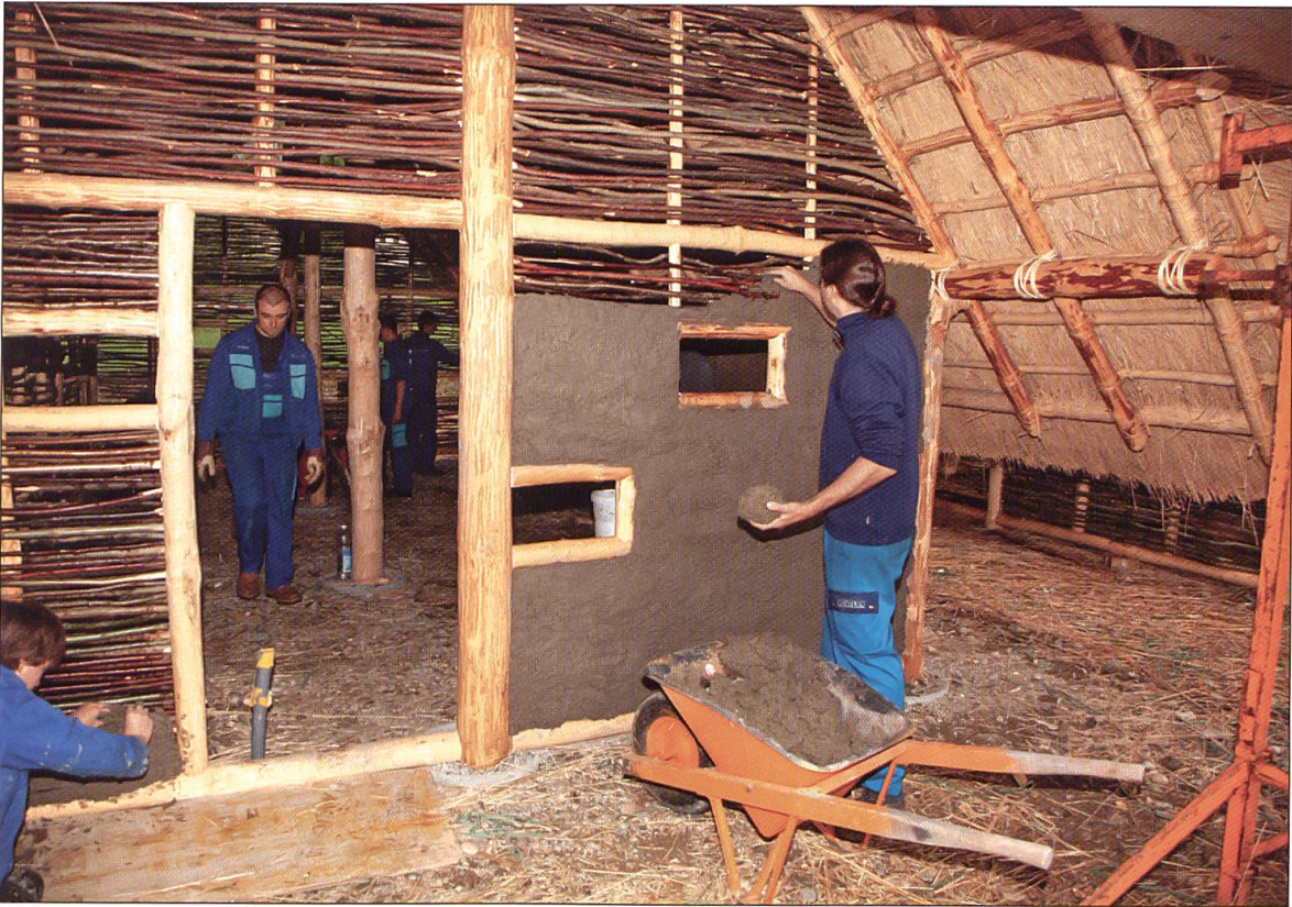
Fachmännisch werden die Mauern verputzt.