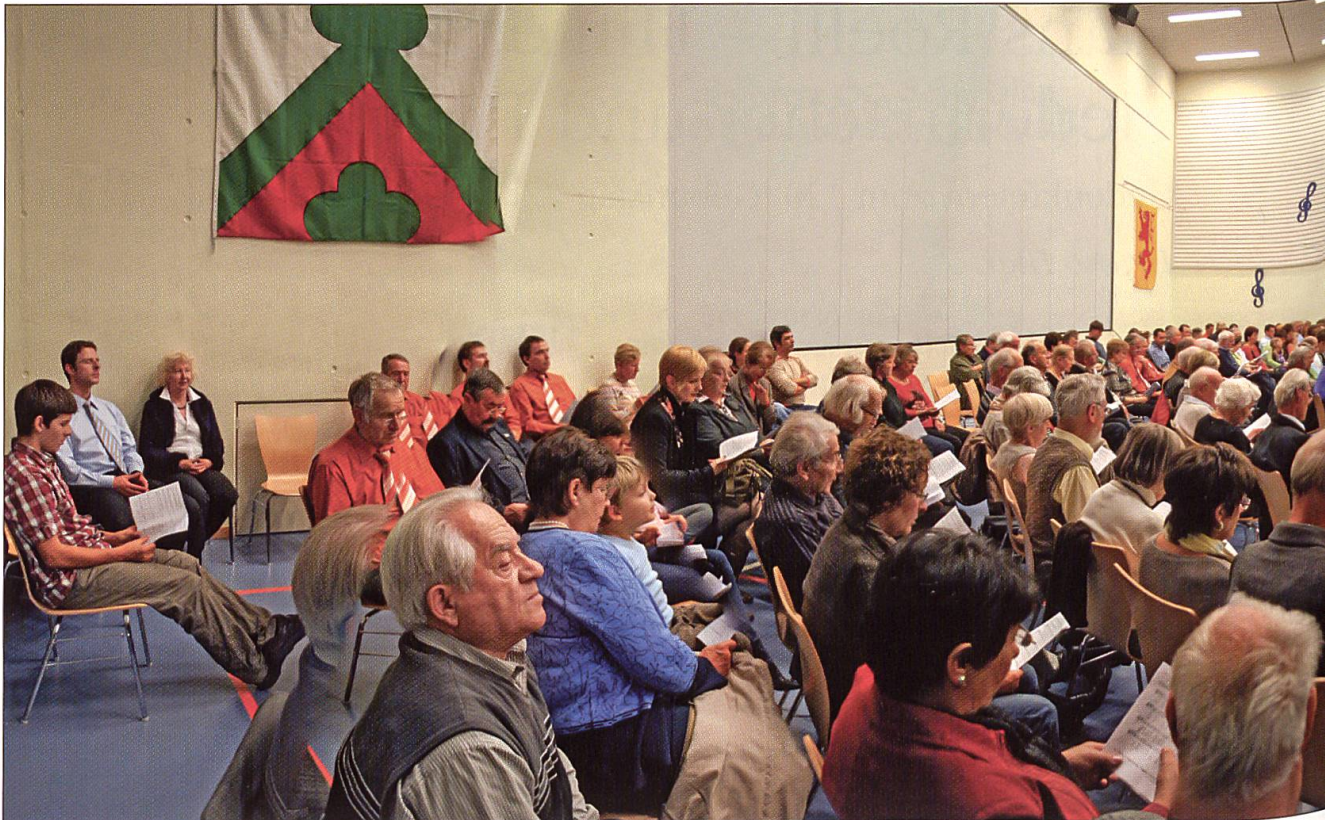
Panoramabild vom offenen Singen in der Altbürer Hiltbrunnenstube.

die Situation, in der diese Werke entstanden seien, nicht mehr rekonstruieren lasse. Wollte man das, gerieten sie unweigerlich in einen musealen Kontext. Wenn wir sie einer kommenden Generation erhalten wollen, müssen wir sie auf unsere Art erleben dürfen.