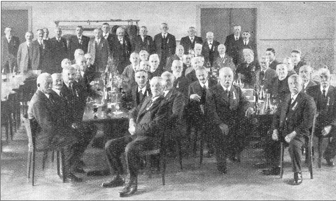
Zur 50-Jahr-Gedenkfeier fanden sich 1941 rund vierzig noch «gängige» Okkupationsveteranen im Hotel Kreuz in Willisau ein.

dieses bekannten Truppenkörpers. Seit der Schaffung der Armee XXI gehört auch das Bataillon 42 in seiner alten Zusammensetzung, wie zahlreiche andere Einheiten, der Geschichte an.