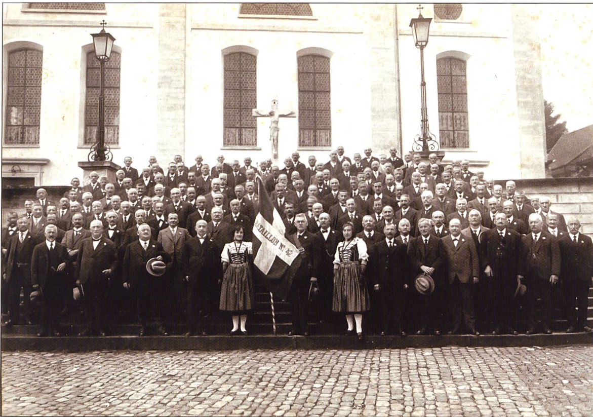
Rund 140 Tessin-Veteranen treffen sich nach vierzig Jahren am 12. Oktober 1930 in Willisau zu einem Gedenk Anlass auf dem Kirchplatz und im Mobrensaal unter Mitwirkung der Stadtmusik Willisau und des Männerchors Concordia.

Revolutionen gehandelt, und die Ermordung Rossis habe zur Abwechslung und Erheiterung des Tessiner Alltags beigetragen.