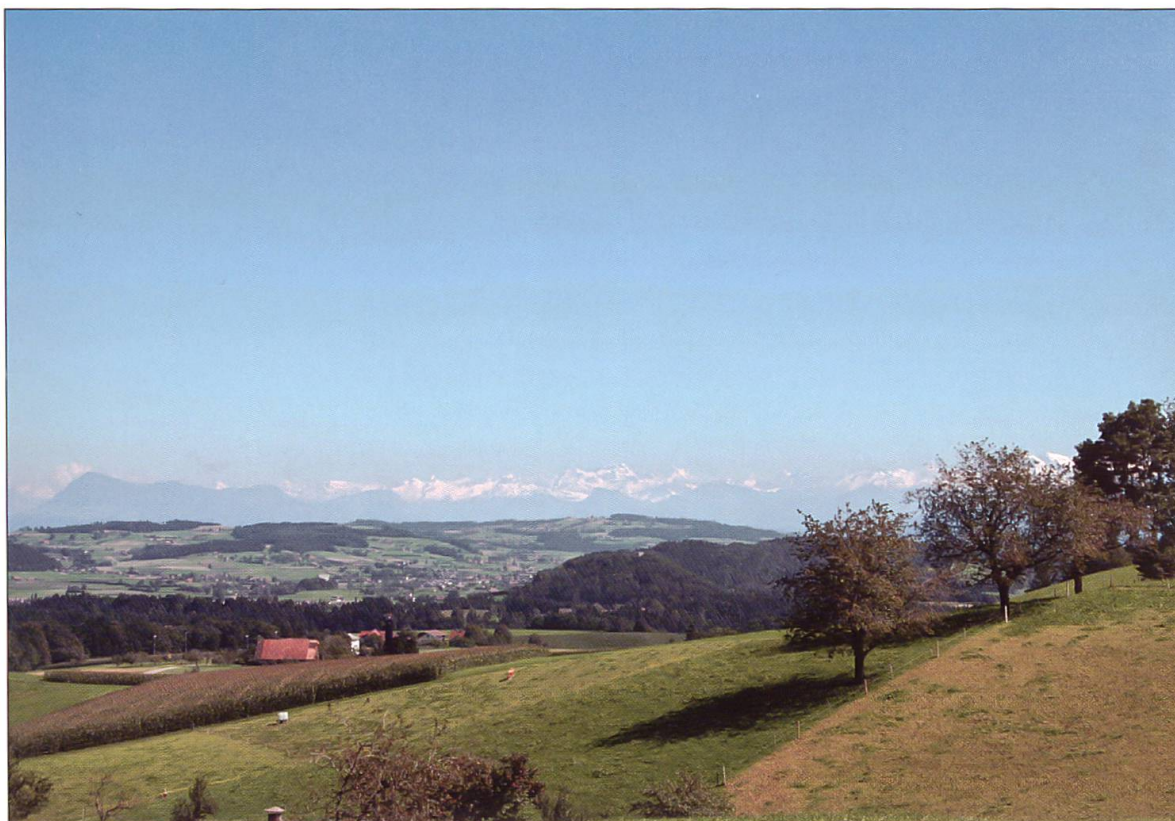
Blick von westlich des Weilers Fadehof (Gemeinde Ohmstal, Koordinaten 637 900 / 224 100 / 690)...